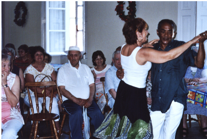
Apresentação de Dança de morador e voluntária do asilo, durante o Encontro do Voluntariado- Dezembro de 2006