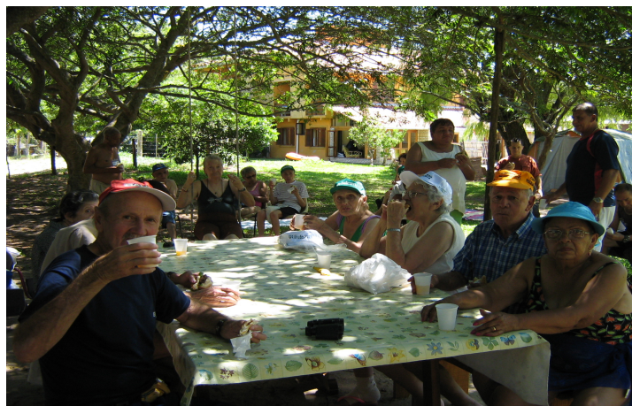
Almoço durante o passeio a praia de Itapuã, no município de Viamão- RS Janeiro de 2007