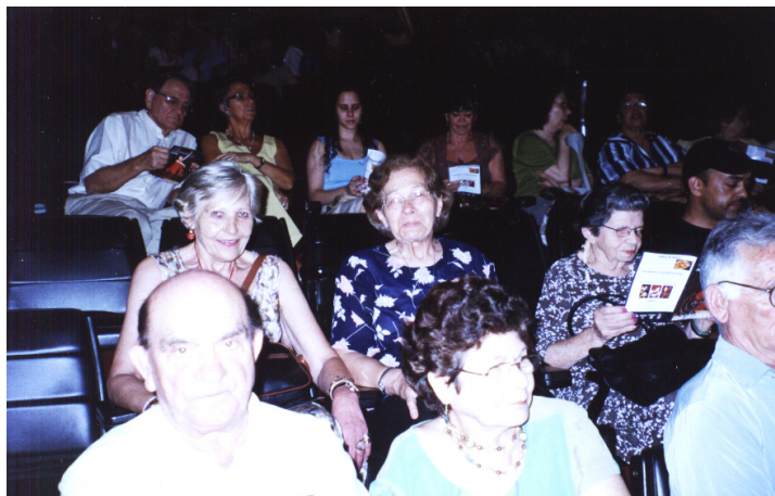
Idosos assistindo apresentação de Dança Flamenca na Assembléia Legislativa de Porto Alegre Novembro de 2006