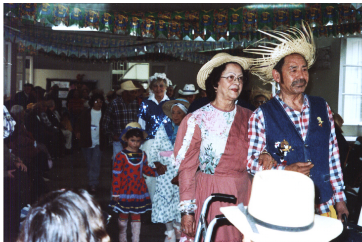
“Casamento caipira” em Festividade Junina Junho de 2006