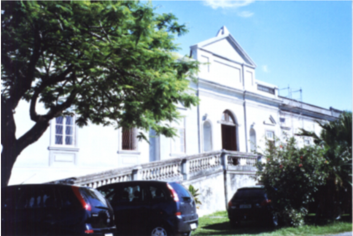
Fachada do Asilo Padre Cacique Janeiro de 2007