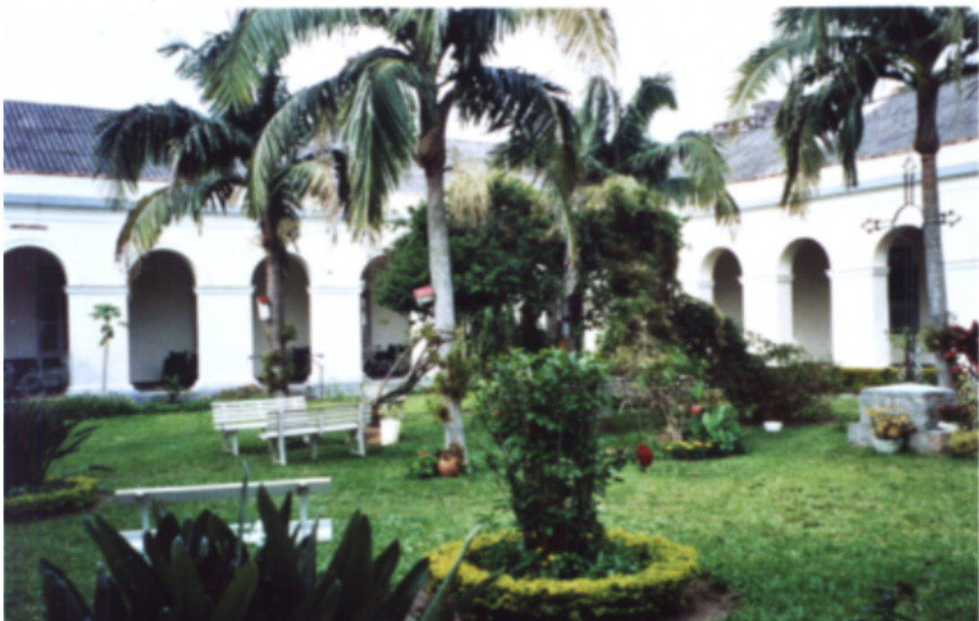
Jardim do Pátio Interno do Asilo Padre Cacique Janeiro de 2007