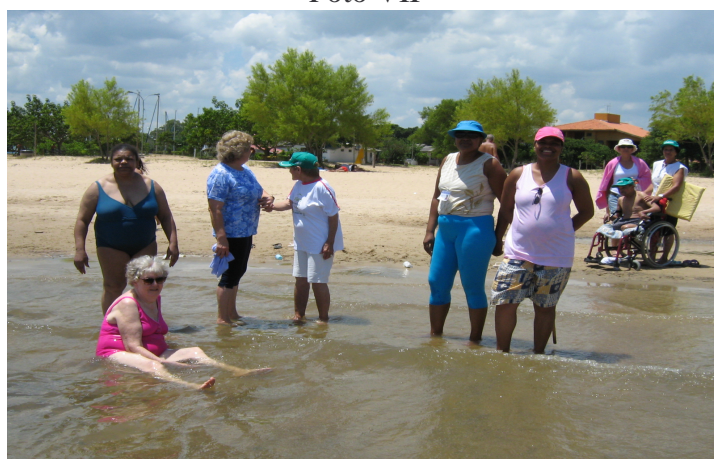
Passeio a praia de Itapuã, no município de Viamão- RS Janeiro de 2007