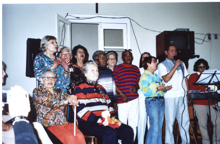
Apresentação do Coral do Asilo durante as comemorações do Dia Nacional do Idoso Setembro 2006