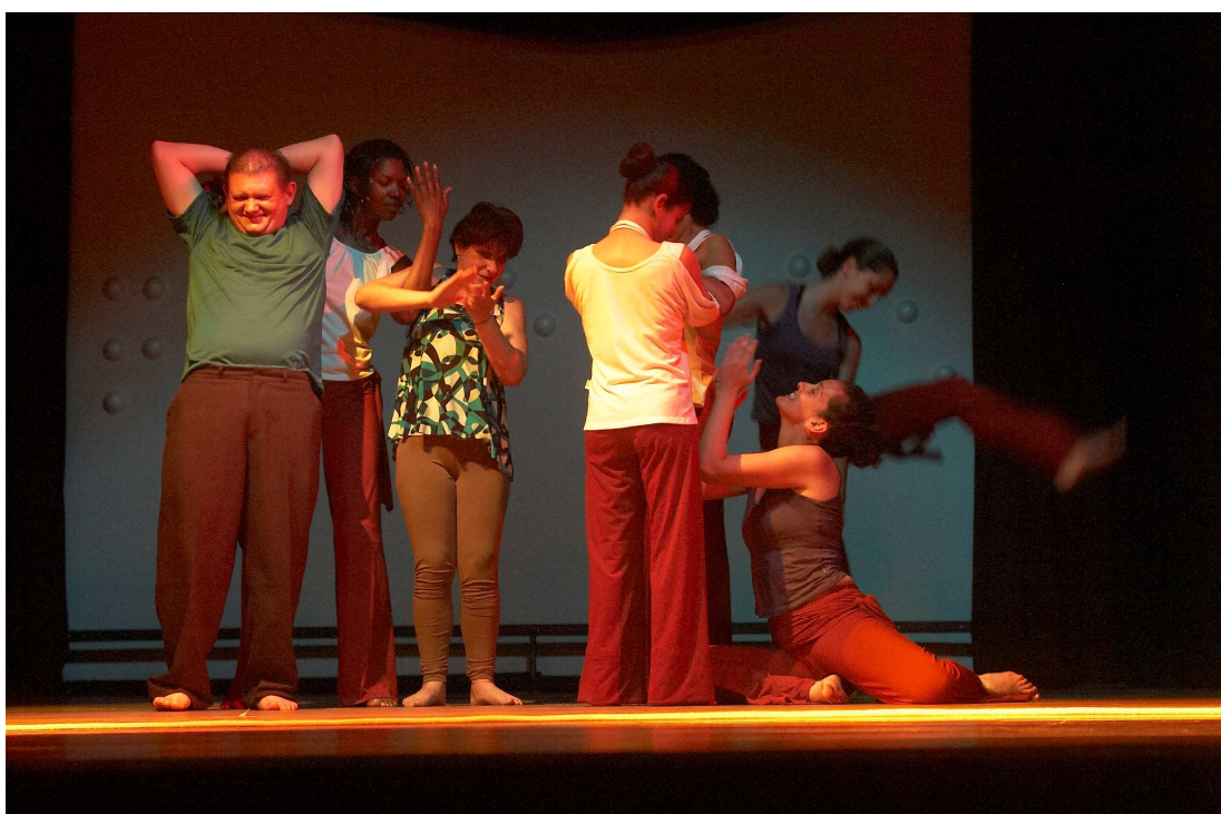
Potlach Grupo de Dança