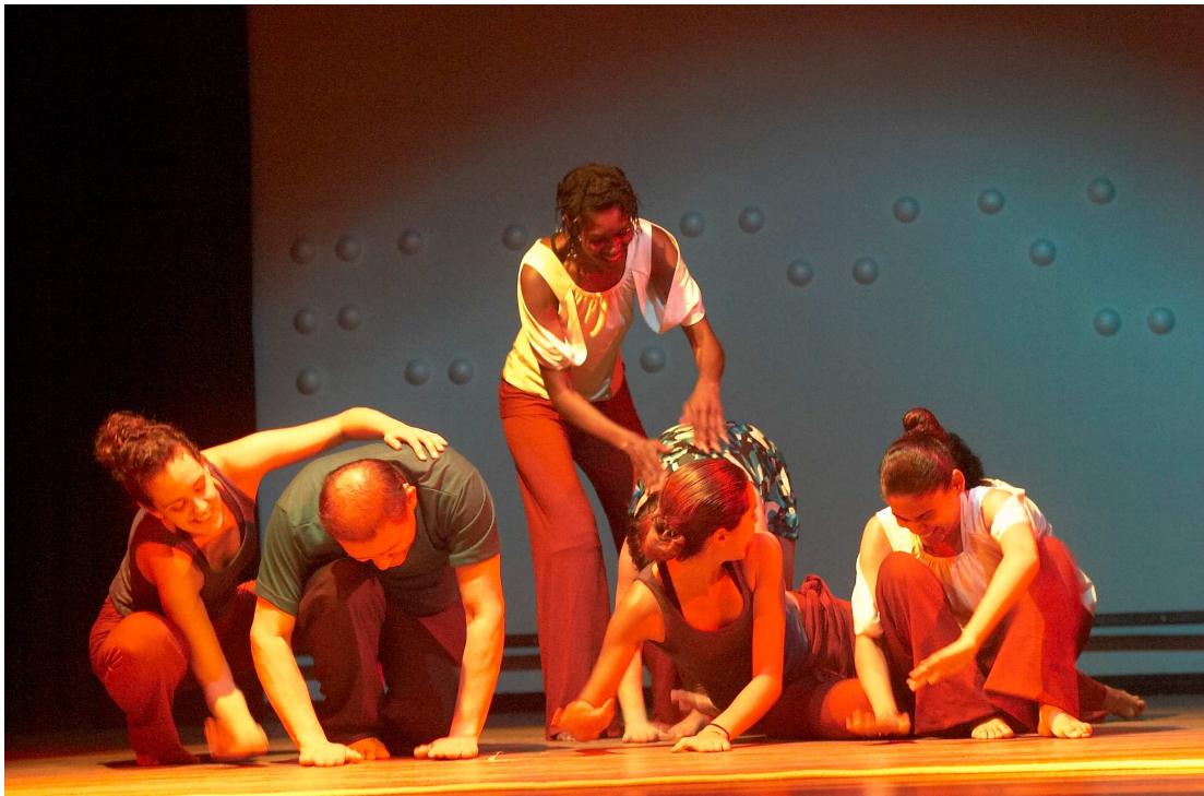
Potlach Grupo de Dança

Estou em constante procura de mim mesma Quando penso que me encontrei Encontro sempre um outro que me era desconhecido Um outro que faz parte de mim Um outro que sou eu mesma Um outro que passou e deixou suas marcas seus registros em meu corpo e fico tranqüila pois posso ver os outros em mim.