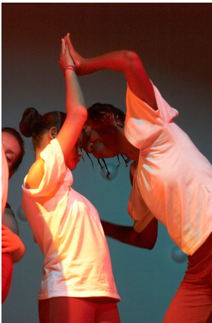
Potlach Grupo de Dança