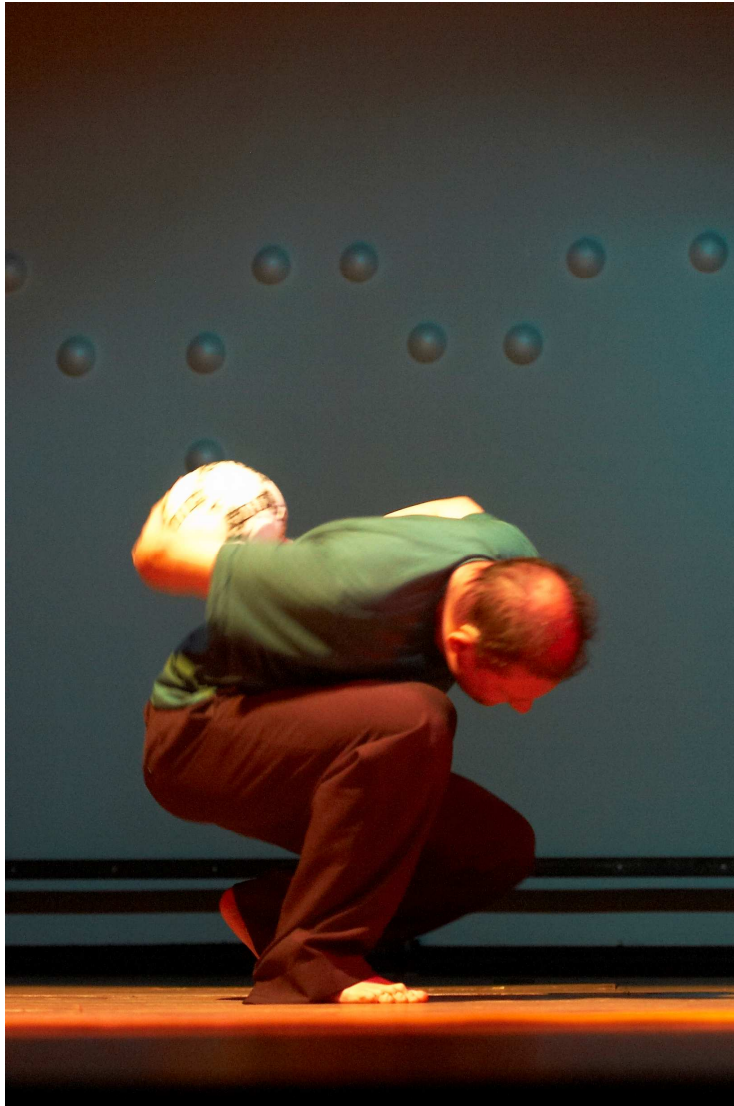
Potlach Grupo de Dança