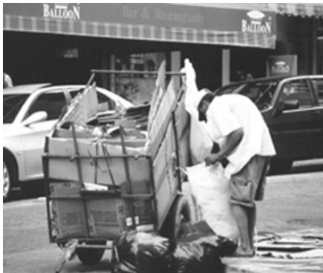
Imagem 4. Catador de Papelão,Foto Gaio.2003

É esta intrincada cosmologia de eventos e espaços interligados que conferem a multiplicidade de significados ao espaço público na cidade. Assim a metrópole leva a si mesma e, conseqüentemente, aos indivíduos que nela habitam a moverem-se em todas as direções, abrindo novas redes de contato e conflito, engolindo todo espaço a sua volta e, sobretudo, transformando os espaços do já construído. Fundando “multiplicidades anômalas e nômade e não mais normais e legais; multiplicidades de devir, ou de transformações, e já não de elementos numeráveis e relações ordenadas; conjuntos vagos e não mais exatos etc.” (DELEUZE,1997,p.220).