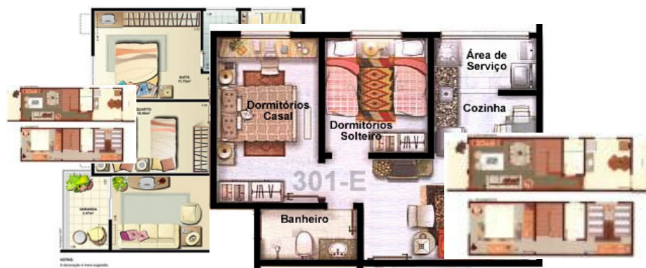
Imagem 01- Gaio - colagem com plantas de jornal. 2006

No entanto, o que menos importava nas minhas invenções arquitetônicas eram a hierarquia e uma possível circulação entre os espaços retirados do jornal. Gostava especialmente do jornal Folha de São Paulo: os apartamentos eram imensos, diferente dos da minha cidade - Salvador. Isso já me mostrava ainda criança, certa desigualdade social considerando o planejamento espacial dispare entre classes sociais do sul e o nordeste.