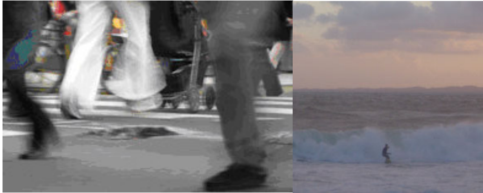
Imagens 6 e 7. Espaço liso. 2004

Estes termos correspondem a universos de um espaço aberto, intervalo de significações singulares que só podem ser percebidas e não vistas. Nesta direção, a cartografia de um espaço liso se desdobra invisível ao olho nu e insuficiente para modelar o palpável. São como zonas quase autônomas que modelam a si mesmas com um potencial rizomático de manifestar-se a qualquer tempo e lugar. O grande trunfo de um espaço liso é a sua invisibilidade aliada a uma instabilidade que é natural a um objeto ambulante.