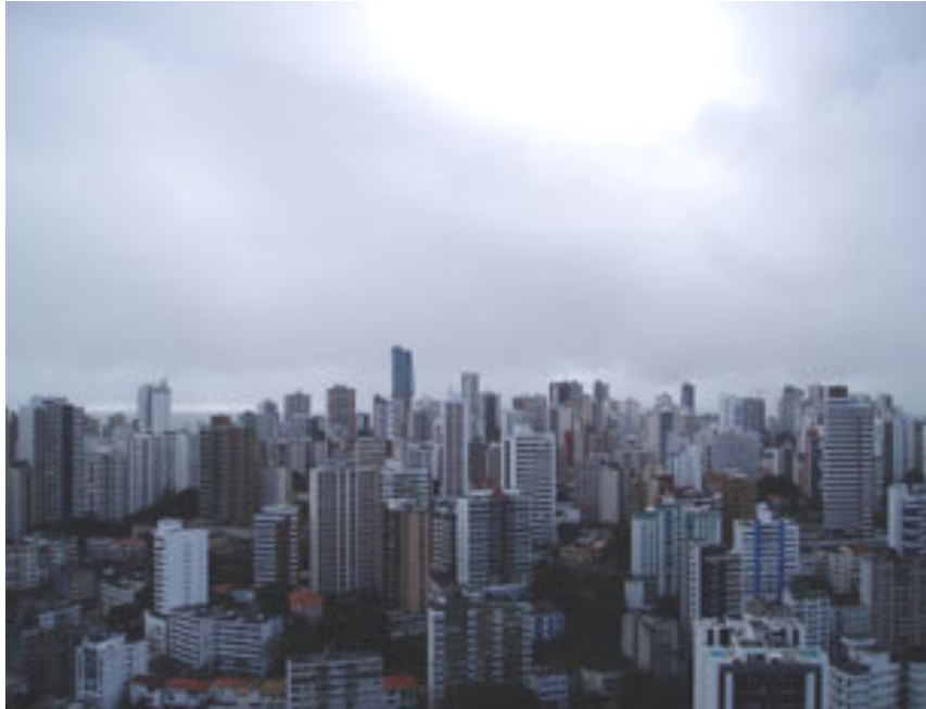
Imagem 08. Espaço estriado.

O modelo estriado é linear e matemático, fechado em coisas visíveis e sólidas, ordenadas e inscritas a partir do cálculo. É a celebração da lógica euclidiana verticalizada na forma de cidades, recortada em linhas de construção que tem como função medir, fatiar e permitir a constituição de um corpo fixo e enraizado.