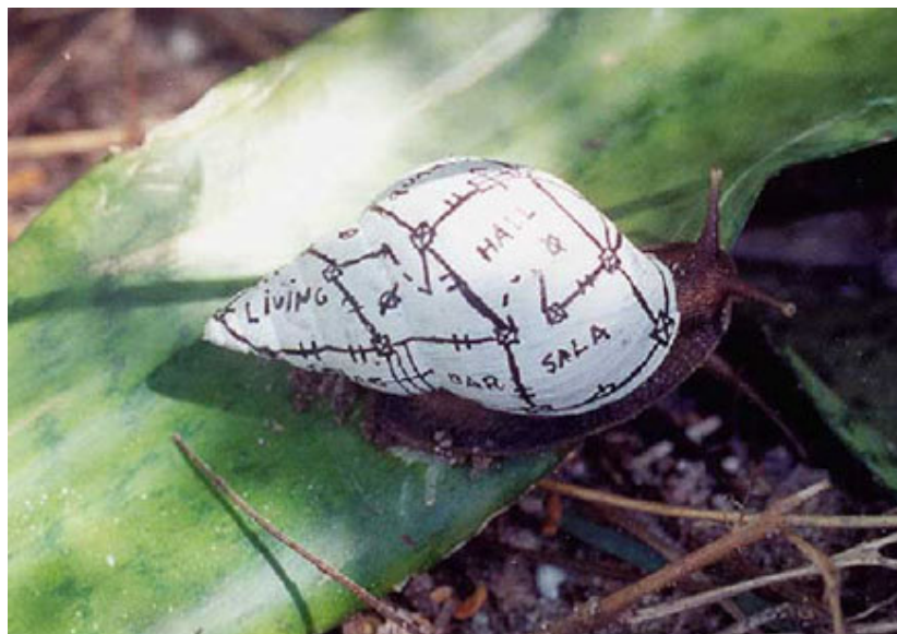
Imagem 05 Gaio- da Série Ambulantes.

Objeto inscrito e construído num território específico, esta forma de espacialização organiza-se por uma série de instrumentos materiais enraizados ao solo como redes de esgoto, rede elétrica, hidráulica, sinais de antena de TV, etc. - e outros imateriais como valor de mercado, endereço e posse, que vinculam o cidadão a um lugar estático e localizável. Este tipo de empreendimento é a arquitetura visível, tal como a conhecemos, dimensional, funcionalista e verticalizada.(JACQUES,2003).