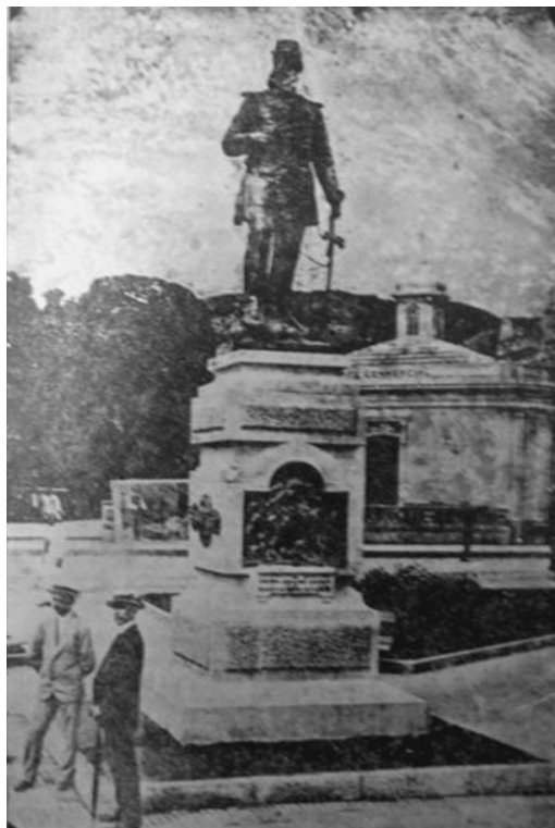
Florianópolis, Jornal O Estado , n.529, de 11/02/1917

Entre Apolo e Dionísio: A imprensa e a divulgação de um modelo de masculinidade urbana em Florianópolis (1889-1930)