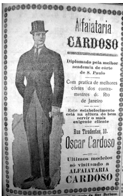
Figura 4: Alfaiataria Cardoso - O Estado , n. 2904, de 01/03/1924

Um homem bem trajado era a representação de um homem honrado. A roupa, quando seguia os cânones da moda, poderia corrigir a postura masculina, dissimulando ou destacando certas partes do corpo, dando-lhe o tão valorizado aspecto de juventude, força e vitalidade. Os que não correspondiam ao modelo de corpo valorizado socialmente, mas com algum dinheiro para gastar, podiam fazer uso dos acessórios para ressaltar ou disfarçar alguma parte do corpo. Num anúncio da loja Ribeiro e Cia., que afirmava ter ficado conhecida como a “detentora dos melhores artigos para homens”, entre os produtos masculinos ofertados estava o “algodão para enchimento”. 193 Munidos desses acessórios, os bons alfaiates da cidade, além de costurarem ternos moldavam corpos.