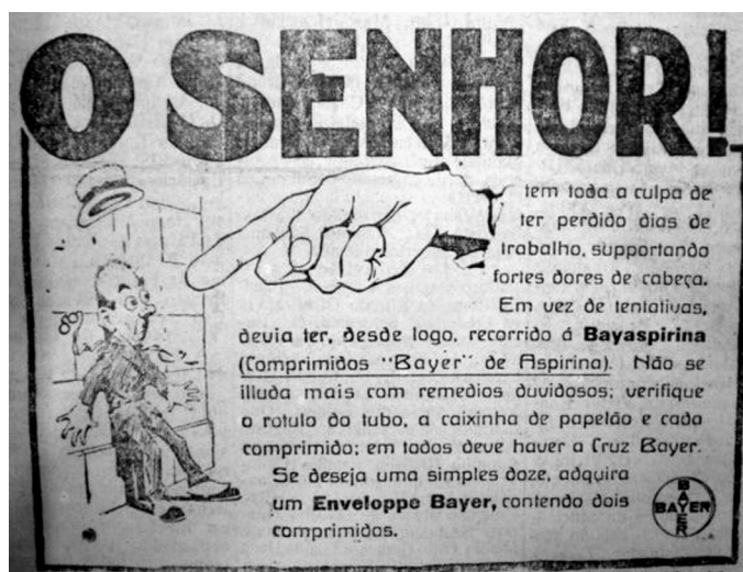
Figura 3: Bayaspirina - O Estado , nº. 2860, de 10/01/1924

a pena de não cumprir com o seu papel de provedor. Nos anúncios das Pílulas de Foster , que prometiam agir sobre as dores dos rins, afirmava-se que muitos homens apesar de “incapacitados” persistem trabalhando por “temor de perder o emprego e o sustento”. 119 As fortes dores nos rins, conforme várias peças publicitárias das Pílulas de Fosters , faziam com que o homem tivesse que curvar seu corpo, 120 perdendo assim a sua forma ideal, saudável e ereta, símbolo de honradez, virilidade e de juventude.