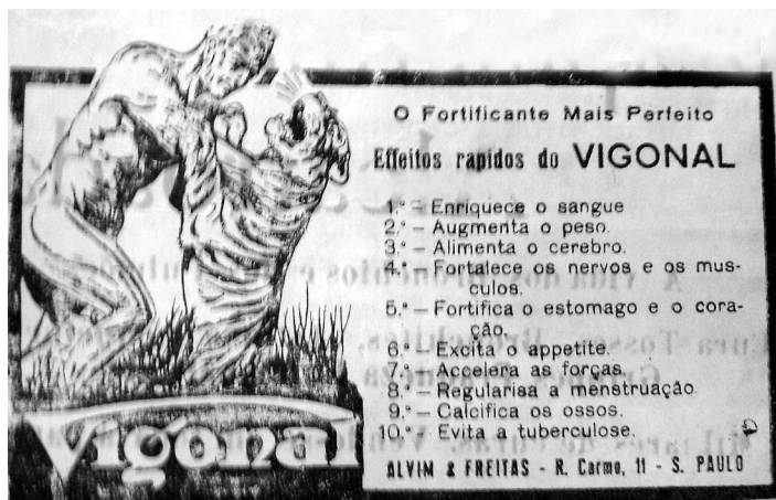
Figura 2: Vigonal: O Miliciano , n. 01 de 28/09/1927

presente no anúncio do fortificante Vigonal , 86 divulgado no jornal O Miliciano . Na imagem, que remete ao mito de Hércules, 87 aparece o desenho de um homem nu, de porte atlético, lutando com um tigre. O lutador é representado como sendo maior que o animal e se coloca de pé, segurando as patas do felino, subjugando-o com sua força. O tigre, um animal que simboliza a força e a agilidade, é enfrentado por um homem cujos músculos e a destreza contrastam com a fera. Mas, não é qualquer homem, é um homem jovem e saudável, que venceu a natureza doentia com um corpo forte: é o rei da força e da razão.