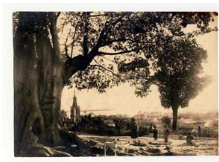
“Menino Deus – segunda igreja (década de 10)” Foto 350

Na última imagem atribuída a Calegari, temos a torre da nova igreja diluída na paisagem, em uma tomada feita acima do nível da rua, provavelmente da colina que serviu de ponto de observação para as anteriores. A cena é um contraluz e o destaque é para a árvore que emoldura a composição a partir da lateral esquerda e toma conta de quase dois terços do quadro. Sob a árvore, um grupo composto por uma mulher, três crianças e um cachorro posam para a fotografia. Ao fundo, o casario do Menino Deus e o rio. A identificação da localidade é feita pela torre da igreja, mas nesta composição, fica evidente o destaque dado para a natureza que assume maior relevância que os sinais de modernização e incorporação do Menino Deus ao conjunto urbano da capital.