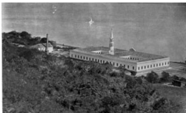
“Asilo Padre Cacique (mendigos)”

Uma hipótese para explicar o enquadramento escolhido seria que, provavelmente, o espaço disponível entre a fachada principal, voltada para a rua então denominada Praia de Belas, e a margem do rio não fosse suficiente para permitir um recuo que possibilitasse uma tomada de todo o prédio. Nesse caso, a opção do autor teria sido por utilizar a encosta do Morro Santa Tereza para obter um ângulo em que a instituição aparecesse inteira, deixando ver o conjunto com a divisão em duas alas e a torre que ocupa a nave central do prédio principal.