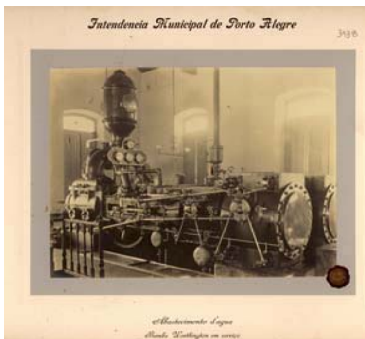
“Abastecimento d’Agua Bomba Worthington em serviço” Intendência Municipal de Porto Alegre “Vistas do Novo Abastecimento d’Água”

As imagens trazem legendas descrevendo os equipamentos e, além da denominação, as fotografias das máquinas contêm a informação “em serviço”, enfatizando o caráter e a importância das máquinas para a dinâmica do sistema. Merece destaque a imagem feita da Bomba Worthington pelo seu conteúdo de quase apologia da máquina. A composição usada remete à idéia de uma locomotiva, imagem amplamente associada à Revolução Industrial. O retrato da máquina é rico em detalhes ressaltados pelo brilho obtido nas peças de metal. Em uma tomada interna, as fontes de iluminação são aproveitadas para compor uma aura resplandecente em torno do que seria o coração do novo sistema de abastecimento.