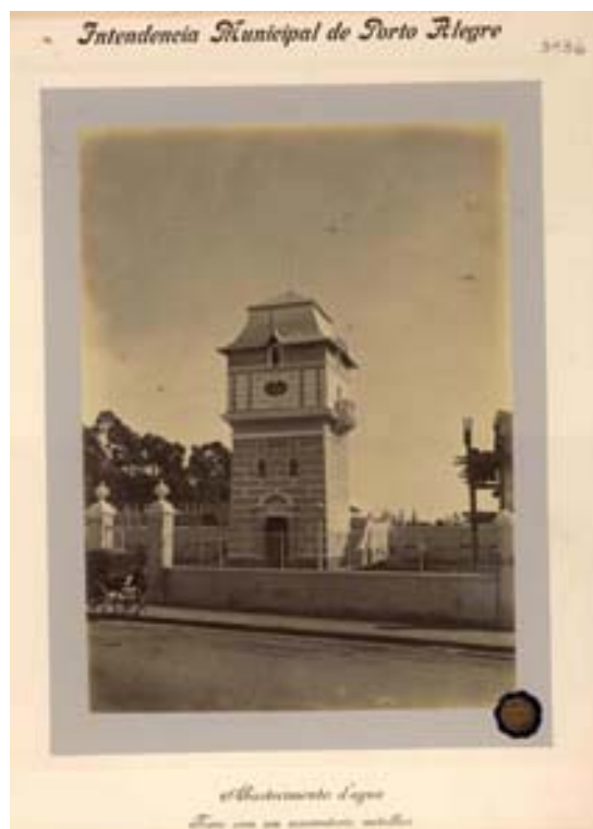
“Abastecimento d'Água Torre com reservatório metálico”

Ao optar pelo uso de enquadramentos mais abertos, o fotógrafo afasta-se do seu alvo e deixa de enfatizar o caráter monumental da torre para privilegiar sua integração ao espaço. Nesta ampliação do campo de visão, deixa ver que os novos equipamentos estão instalados em uma rua sem calçamento e diante de um terreno baldio, além de permitir levantar a hipótese de que a obra não estivesse totalmente concluída uma vez que, na lateral esquerda, aparecem andaimes e operários trabalhando possivelmente na reforma de um prédio já existente. As duas imagens ainda trazem pedestres, cavalos, um homem e uma charrete, elementos deixados pelo autor, capazes de indicar uma utilização nem tão moderna do espaço urbano.