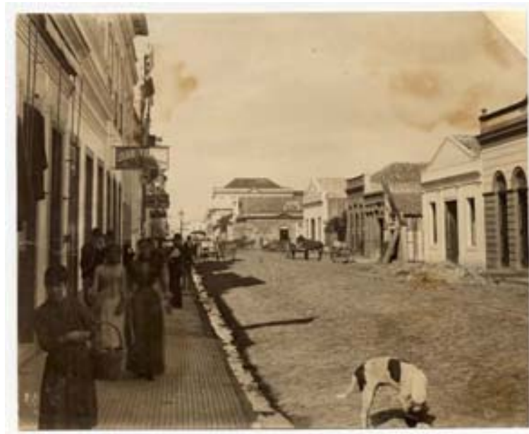
“Voluntários da Pátria” (final do século XIX)

Com exceção dos casos identificados como Praça Oswaldo Cruz e Praça XV, cujas imagens parecem ter sido feitas de algum ponto acima do nível da rua, o restante resulta de tomadas feitas a partir do meio da rua ou de uma calçada lateral. É interessante notar que, ao deslocar-se para a calçada, o fotógrafo deixa de lado a opção bastante usada de fazer coincidir o ponto de fuga com o final da rua e dá destaque para a figuração que aparecem em primeiro plano, justamente no lado não iluminado da rua. Nas sombras, encontramos homens e mulheres de classes sociais distintas, crianças aparentemente pobres, animais, carroças e até uma sarjeta escoando material.