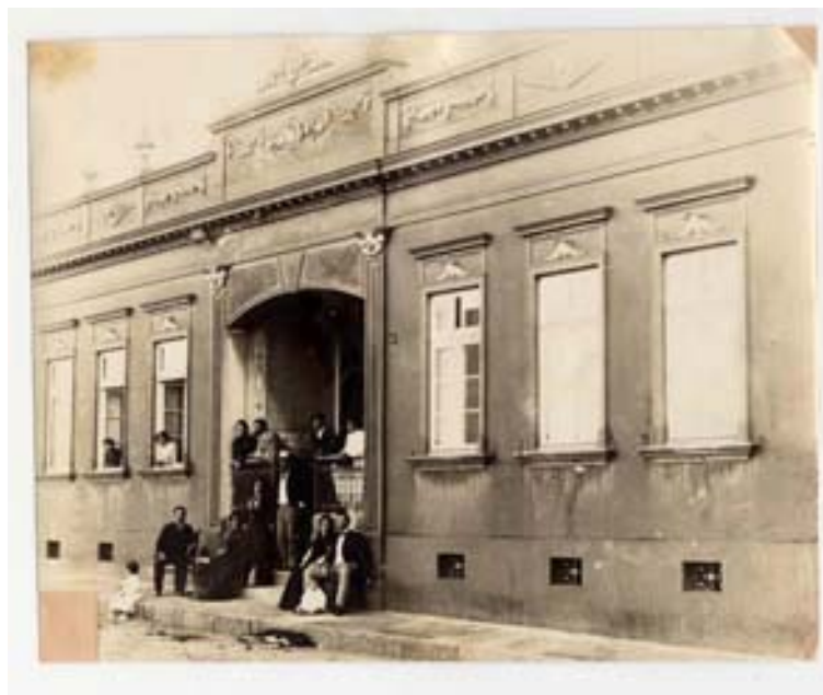
Riachuelo com família tradicional Foto 321

Depois de uma incursão pelos telhados e moradores da Rua Riachuelo, voltamos ao Álbum de Porto Alegre e suas visões. Na seqüência da imagem “aérea” dos telhados da Riachuelo, foi publicada outra vista identificada pela legenda Porto Alegre à vol d’oiseau (Porto Alegre vista do alto), possivelmente também feita a partir de uma das torres da Igreja das Dores, mas desta vez olhando para o norte 41 . Nesta imagem, temos um plano geral do porto e seus trapiches, com boa parte do quadro pontilhado por embarcações. Pela composição, o leitor é orientado a dirigir sua atenção para o quadrante superior direito, ocupado pelas ilhas que ficam em frente ao centro da cidade e formam o chamado Delta do Jacuí, ponto de confluência entre os rios Gravataí, Sinos, Caí e Jacuí.