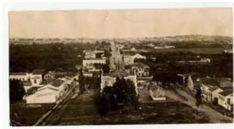
“Menino Deus – Vista parcial feita da colina do Menino Deus” Foto 277