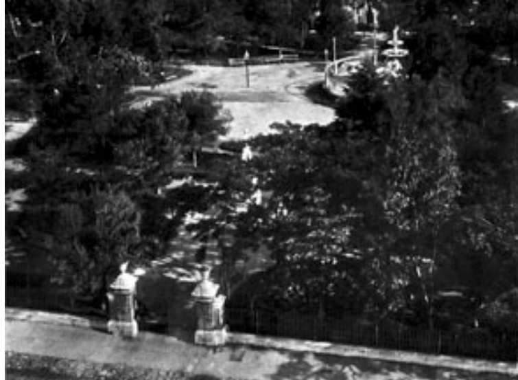
“Praça Marechal Deodoro” / Álbum de Porto Alegre POAF00849A

O projeto do monumento que ocupa o centro da praça até a atualidade foi encomendado a Décio Villares logo após a morte de Júlio de Castilho (24 de outubro de 1903), mas a construção só teria sido iniciada em 27 de julho de 1910, com o trabalho de embasamento e cantaria, justamente a fase da obra registrada por uma imagem pertencente ao acervo da Fototeca Sioma Breitman cuja autoria é atribuída a Calegari. Na fotografia, os operários posam junto à roldana usada para içar os blocos de pedra que formam a base onde está assentado o monumento. Deslocado à direita e posicionado à frente do grupo, um homem com roupas melhores que poderia ter como função chefiar o serviço.