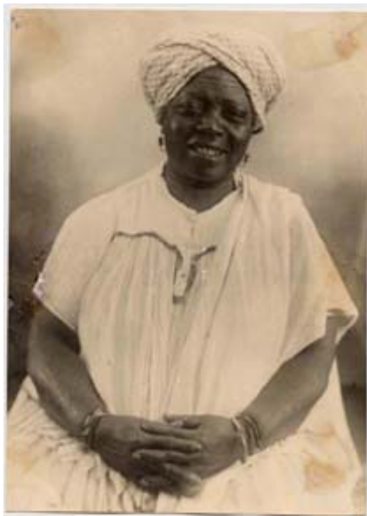
“Negra com turbante preto e branco”

Deste conjunto, foram selecionados para análise no âmbito deste trabalho, dois retratos de mulheres negras por serem considerados os que reuniam mais elementos capazes de informar sobre o interesse do fotógrafo pelos personagens da cidade e sobre sua habilidade em estabelecer uma relação eficaz com o fotografado. Em ambos, o enquadramento é um plano médio, tipo americano (apresenta o corpo do personagem até os joelhos). O fundo liso ressalta o personagem e há grande destaque para as mãos. Na primeira, temos uma mulher de turbante, vestido simples e poucos adereços. Ela está posicionada frontalmente em relação à câmera, mas seu corpo não assume uma postura rígida e a cabeça aparece até um pouco inclinada. A imagem dá grande ênfase às mãos da personagem que estão cruzadas e servem como base para a figura. Diferente da maioria dos retratos feitos pelo fotógrafo e disponíveis para pesquisa, o rosto abre-se em um sorriso de dentes intactos e dá à imagem uma aparência de contentamento sincero.