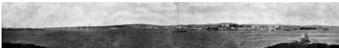
“Panoramas de Porto Alegre”

semelhanças identificadas a partir da comparação entre imagens apresentadas como diferentes levantam a hipótese de que algumas vistas poderiam ser, na realidade, parte dos panoramas 45 .