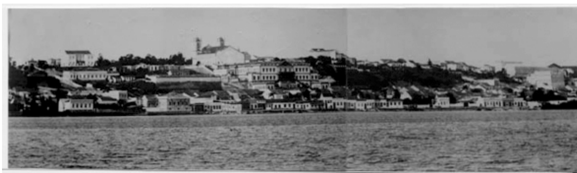
“Panorama de Porto Alegre – Washington Luis, Praça Mal. Deodoro”

Foto 224 – Acervo do Museu Joaquim Felizardo / Fototeca Sioma Breitman