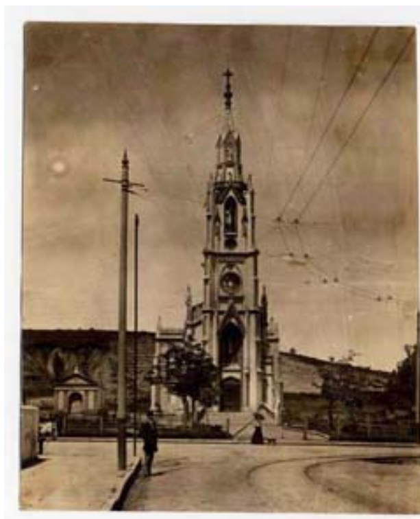
“Menino Deus – Vista parcial feita da colina do Menino Deus” Foto 278

Nas duas últimas imagens disponíveis, temos como referência a igreja que teria substituído a edificação original. Em uma tomada feita no nível da rua e deslocada para a lateral, a primeira fotografia apresenta a nova construção dominando boa parte do quadro e destaca a sinuosidade dos trilhos e da fiação do bonde elétrico. No primeiro plano, um homem que encara a câmera a partir da lateral, enquanto a cabeça de um cavalo surge atrás de um muro. A cena é cruzada por uma mulher sob sombrinha, seguida de um animal.