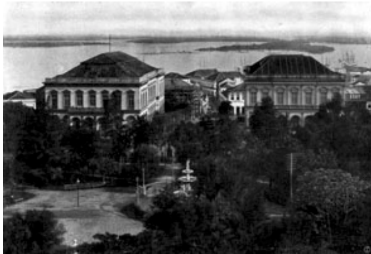
“Praça Marechal Deodoro – Thesouro do Estado e Theatro São Pedro” / Álbum de Porto Alegre POA FOO481A

Seria possível dizer inclusive que a leitura da posição do Guaíba muda. Apesar de ambas apresentarem uma inversão em relação às vistas feitas a partir das ilhas em que o rio dominava o primeiro plano, é na segunda que a alteração da relação entre a cidade e o rio é apresentada de forma mais acabada. Do rio que dominava a paisagem, passa-se à monumentalidade da cidade construída que avança sobre a natureza e chega-se a uma imagem que poderia representar de forma eficaz a capital.