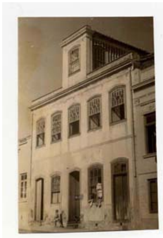
“Riachuelo – Vista de residência” (início do século) Foto 401

trânsito intenso e não seria surpresa se o fotógrafo estivesse diante de um cortiço. O quadro do empobrecimento é complementado pela figura de um garoto que cruza a cena em calças curtas e pés descalços e pelo contraste dos prédios vizinhos, com suas vidraças bem apresentadas e estrutura bem conservada. Entretanto, mesmo dando pistas do que seria considerado um processo de degradação da utilização, o autor utiliza um enquadramento que deixa mantida a antiga elegância, dando destaque para as vidraças do segundo andar, ressaltadas pela incidência do sol e pela projeção das suas sombras. Esta aparente condescendência visual poderia favorecer uma possível percepção mais positiva do prédio por leitores posteriores, fato que ajudaria a explicar a atribuição da legenda Riachuelo – Vista de Residência (início do século) , pelos especialistas que cuidaram da identificação da imagem.