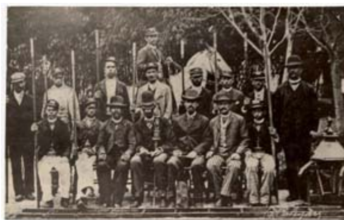
“Acendedores de Lampião”

Por volta de 1893, a iluminação das ruas da área central (perímetro compreendido entre as ruas Ramiro Barcelos, Venâncio Aires, João Alfredo e foz do Riacho) era responsabilidade da concessionária Companhia de Gás que empregava combustores a gás, enquanto no subúrbio, eram usados os lampiões a querosene instalados pelo município. Em 1908, fora concluída a Usina Municipal para atender o sistema de iluminação pública fora da área atendida pelo gasômetro. Segundo Franco, “já no ano seguinte, (a usina) permitiria a substituição de todos os lampiões a querosene dos bairros por 600 lâmpadas incandescentes”. Até a primeira guerra mundial, houve uma certa expansão do serviço a gás, mas em 1917 começou a substituição progressiva e definitiva dos combustores por lâmpadas elétricas.