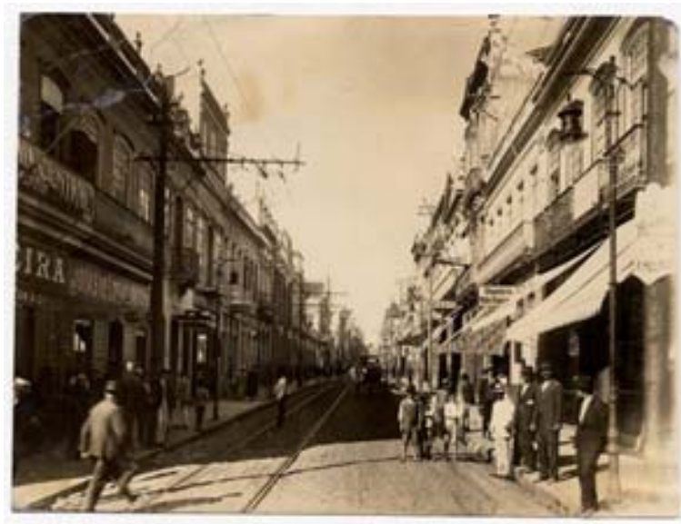
“Andradas x Marechal Floriano” (1910)

Se por um lado, temos um conjunto de elementos que facilitaríamos a inclusão de Porto Alegre no grupo de cidades modernas, a sombra revela a presença de uma carroça. Paralelo ao trilho do bonde, o silhueta de um carroceiro sobe a rua, afastando-se da lente do fotógrafo, metáfora de tempos que se cruzam frente ao olhar do autor.