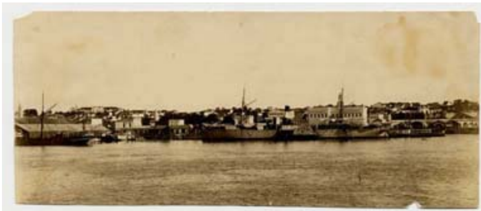
“Cais - 1910”

públicos sobressaem no contorno da paisagem. A mesma idéia poderia ser extraída de fotografias cujo tema é a movimentação de embarcações no porto da capital.