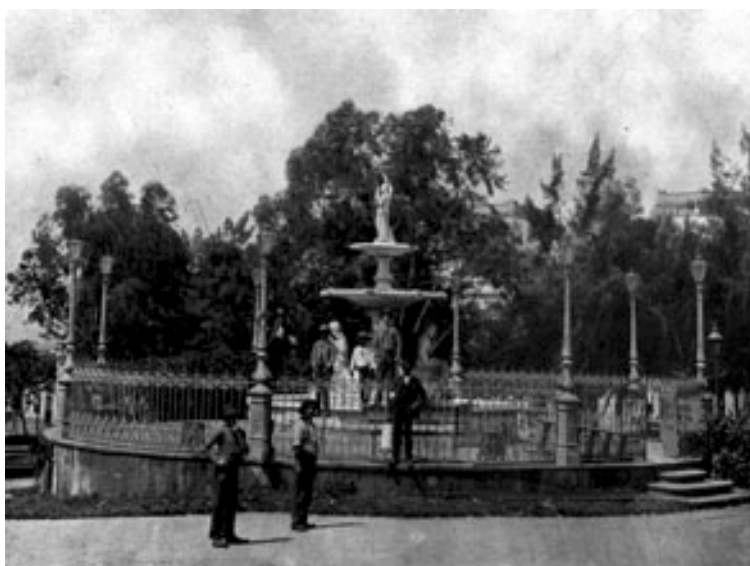
“Praça Marechal Deodoro” / Álbum de Porto Alegre POAF00501A