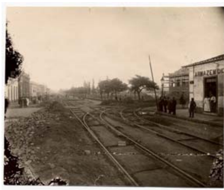
“João Pessoa x Venâncio Aires. Implantação dos trilhos do bonde. Armazém do João de Deus, Grupo Escolar Luciana de Abreu”

Foto 063