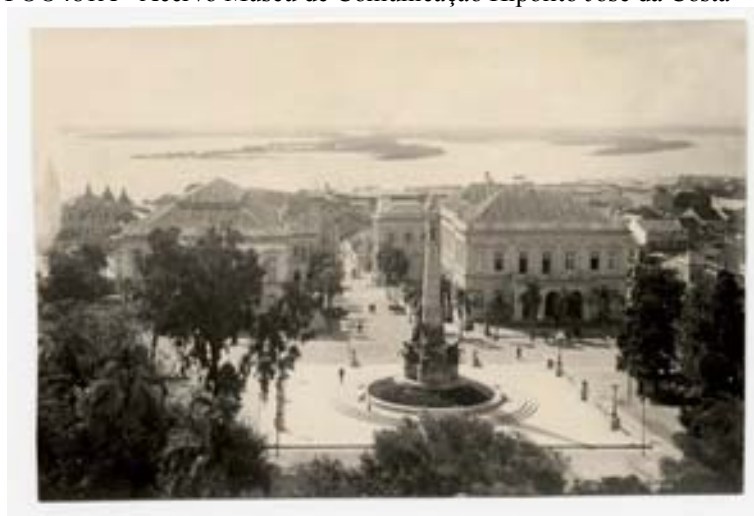
“Praça Marechal Deodoro” (década 20) Foto 247