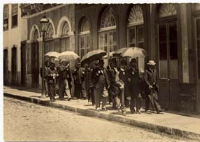
“Borges de Medeiros, Júlio de Castilhos e membros do PRR” (cerca 1900)

Na linha de frente, Júlio de Castilhos e Borges de Medeiros, sob a sombra de um acompanhante, seguidos por correlegionários. Passo firme, cruzam a cena na diagonal, em direção ao fotógrafo. Como cenário, a fachada do casario repleta de portas e janelas envidraçadas, enquanto a conversa no segundo pelotão garante um ar de espontaneidade corriqueira. Todos ostentam objetos como sombrinhas, bengalas, chapéus, cartolas, gravatas e reluzentes sapatos, atestando não apenas que se trata de um grupo distinto, mas garantindo também a aparência condizente com sua posição social.