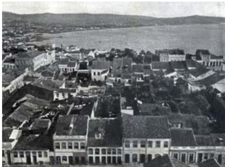
“Riachuelo x Gal. Bento Martins”

imagem, ainda seria interessante notar a presença de possíveis indícios da obra de retificação do Arroio Dilúvio, no canto superior esquerdo. Dessa forma, a imagem escolhida para funcionar como o retrato da urbe reuniria elementos capazes de atestar a presença apenas do que era possível de modernidade naquela sociedade.