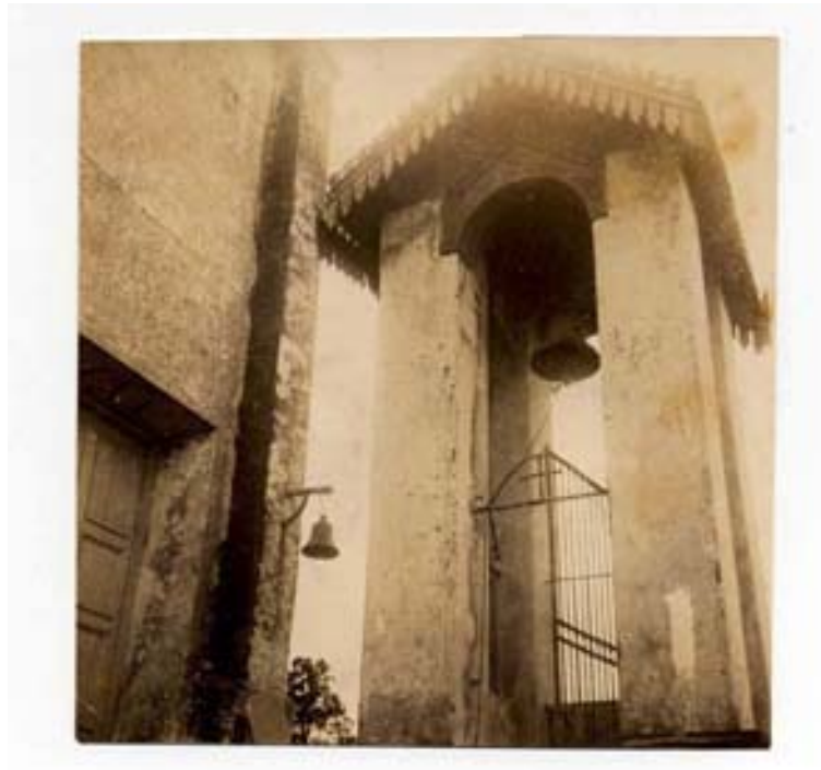
“Vista do antigo campanário da igreja de Belém Velho” Foto 434

A quarta imagem do conjunto é um contraluz ainda mais intenso. Feito a partir do interior da igreja, mostra os elementos do outro lado da praça através da abertura da porta, destacando o primeiro plano dominado pela vidraça decorada que emoldura a porta