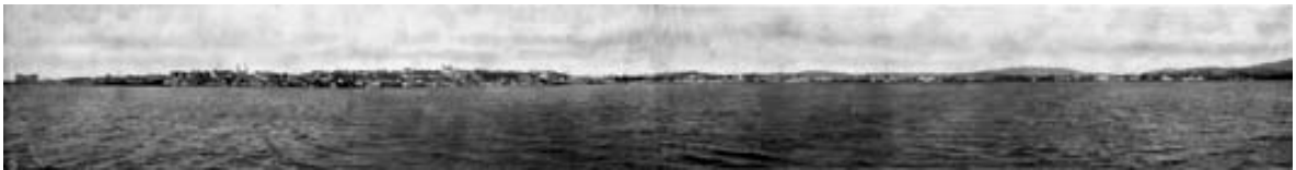
“Panoramas de Porto Alegre” / Álbum de Porto Alegre POA 00927A - Museu de Comunicação Hipólito José da Costa

O fato da narrativa do Álbum de Porto Alegre ser encerrado por uma dupla de “panoramas” da cidade também ajuda a pensar o problema proposto por este trabalho. Uma conclusão possível seria que após apresentar os principais marcos de referência da paisagem urbana de Porto Alegre, o autor usou duas imagens onde o elemento natural ganha em importância para finalizar seu discurso sobre a capital. Dessa forma, estaríamos autorizados a pensar que, naquele momento – primeira década do século XX – não teríamos um marco material capaz de sustentar uma imagem síntese e exclusivamente urbana da cidade. A natureza ainda se sobrepunha no retrato da cidade cuja elite pretendia impor-se pelo poder do esclarecimento e da racionalidade.