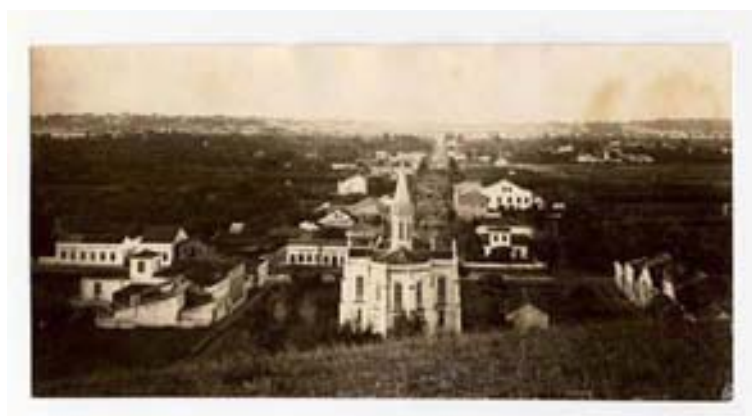
“Menino Deus – Vista parcial feita da colina do Menino Deus” Foto 276

Além de uma notável vegetação, a localidade precisaria adotar formas de socialização condizentes com os novos tempos. Entre as tradições que poderiam estar na iminência de transformação ou desaparecimento, poderíamos incluir as festas religiosas. São justamente os sinais destas festas locais que o fotógrafo Calegari deixou para serem vistos na imagem publicada no Álbum de Porto Alegre.