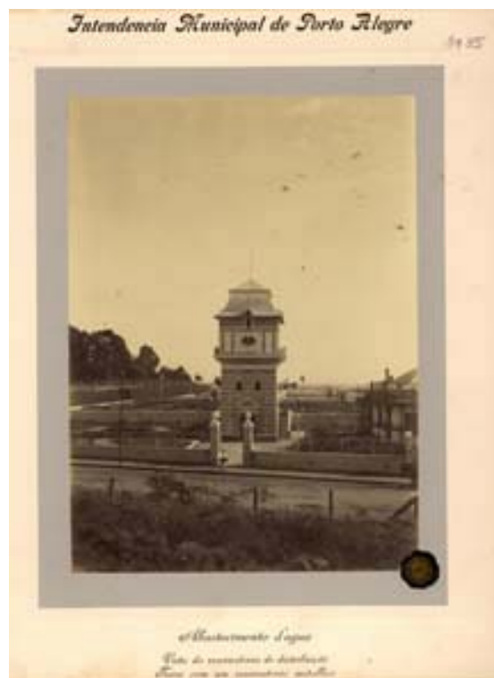
“Abastecimento d’Agua Vista do reservatório de distribuição Torre com um reservatório metálico”

Entretanto, mesmo em um trabalho destinado a imortalizar o esforço da administração pública para sintonizar a cidade com as novas exigências sanitárias da urbanidade, é possível identificar alguns elementos perturbadores. No âmbito deste trabalho, vale destacar as duas imagens do reservatório de distribuição, apresentadas na sexta e sétima posição dentro do conjunto.