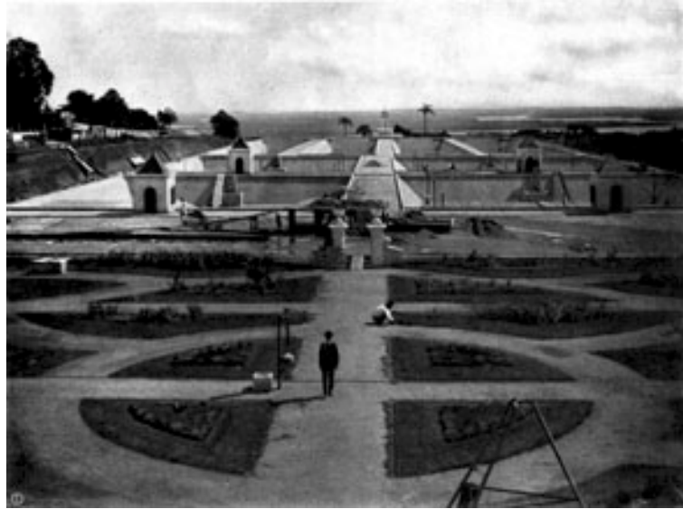
“Hidráulica Municipal” / Álbum de Porto Alegre POAF00844A

Se por um lado, a imagem de uma obra em construção poderia sugerir dinamismo e investimento no futuro justificando a opção da representação do sistema de abastecimento de água – uma importante realização do governo, concluída anos antes, o mesmo não foi aplicado à apresentação da Praça Marechal Deodoro que aparece na publicação com as características anteriores à reformulação. Estamos diante de uma escolha que explicita a opção por apresentar tanto a cidade que se anuncia quanto a que desaparece, como se o fotógrafo localizado em seu tempo mirasse para um antes e um depois. Estaríamos autorizados a pensar que esta manobra teria como resultado ou mesmo intencionalidade tanto a idéia de acentuar por contraste a mudança em curso na paisagem urbana quanto a necessidade de registrar como memória algo que já não existiria mais.