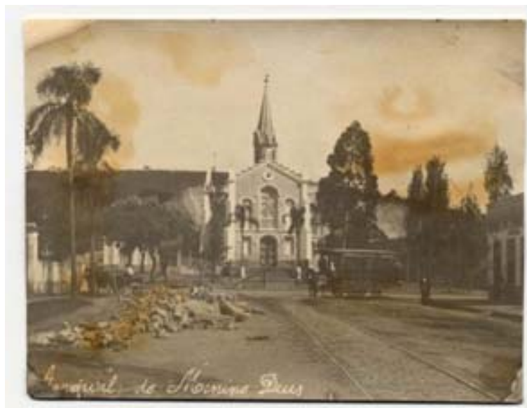
“Getúlio x José de Alencar. Vista da primeira igreja do Menino Deus com bonde puxado a burro”. Cartão postal

têm autoria atribuída e nenhuma apresenta datação especificada. Entretanto, seria possível supor uma cronologia a partir da situação da pavimentação do local e das características da igreja da localidade. Temos duas tomadas feitas a partir da Rua 13 de maio. A primeira tem um enquadramento mais aberto e dá maior destaque ao trilho, ambas tem o ponto de fuga 35 marcado pela presença da igreja. O trilho ajuda a marcar a profundidade do campo, mas aparece deslocado para a lateral. A igreja também é o elemento central em uma terceira tomada cuja composição traz, em primeiro plano, entulhos que bem poderiam ser restos de construção ou escombros. Ao fundo em frente à igreja um bonde de tração animal e uma carroça na lateral esquerda. Vale destacar que esta imagem foi utilizada em cartão-postal 36 que teria circulado em 1909, quando a igreja já era outra e o bonde já era elétrico.