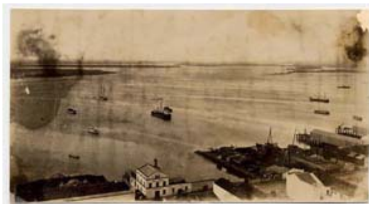
“Vista do cais – trapiche”

Foto 300