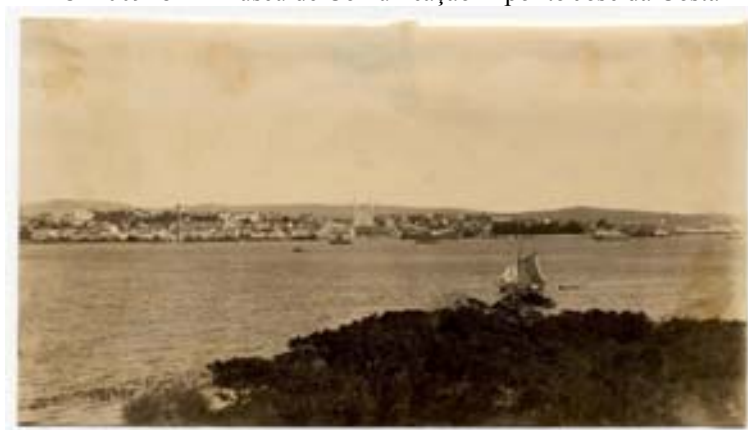
“Vista” – Ponta da Cadeira até Teatro São Pedro, Casa de Correção, Cia Fiat Lux, Palácio da Justiça (cerca de 1905)

Foto 156 – Acervo do Museu Joaquim Felizardo / Fototeca Sioma Breitman