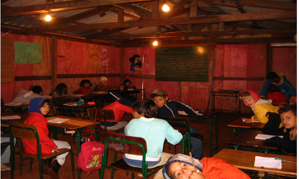
Ilustração 5: Sala de aula