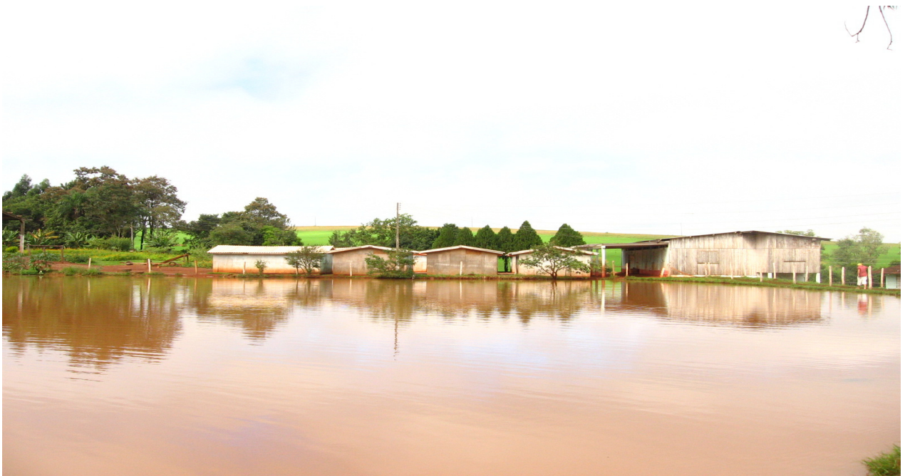
Ilustração 2: Escola Itinerante Sementes do Amanhã