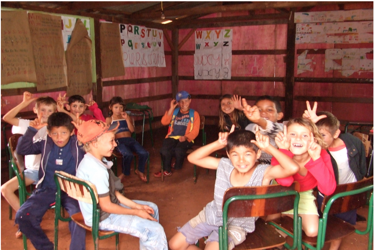
Ilustração 6: Crianças