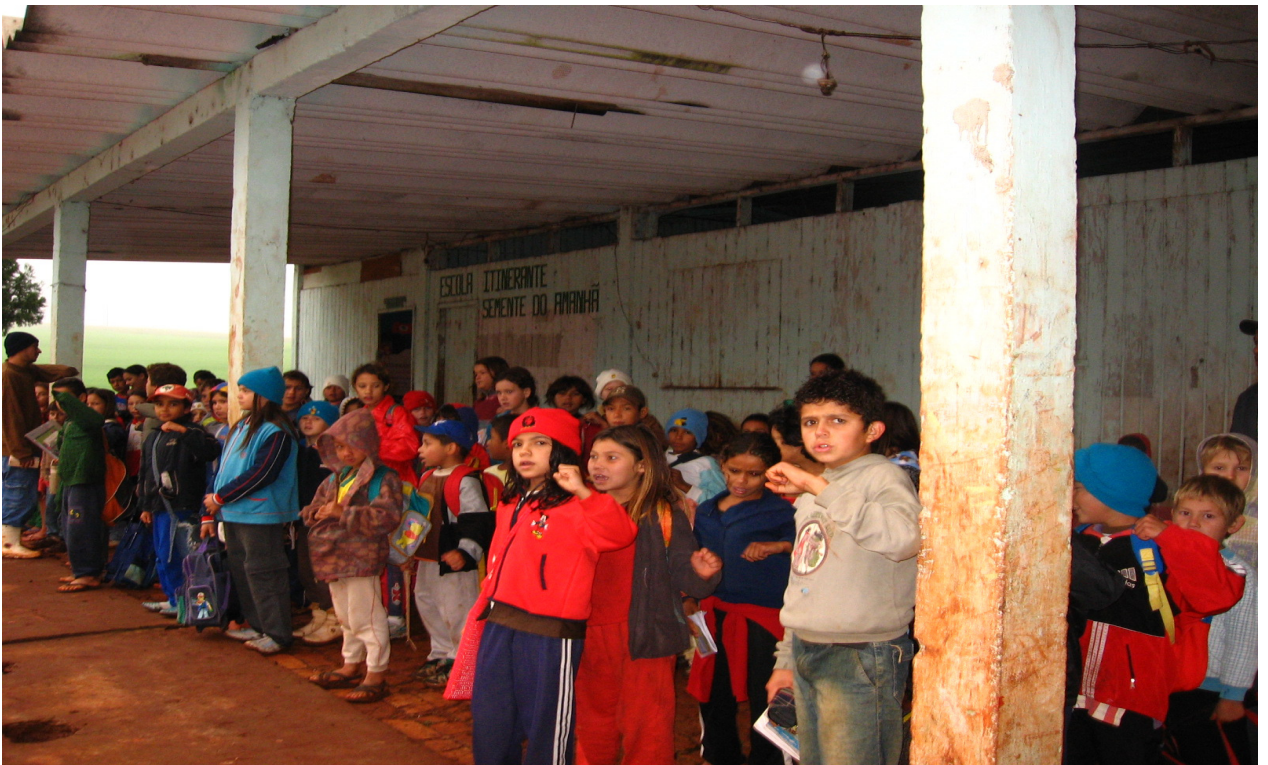
Ilustração 4: Tempo Formatura