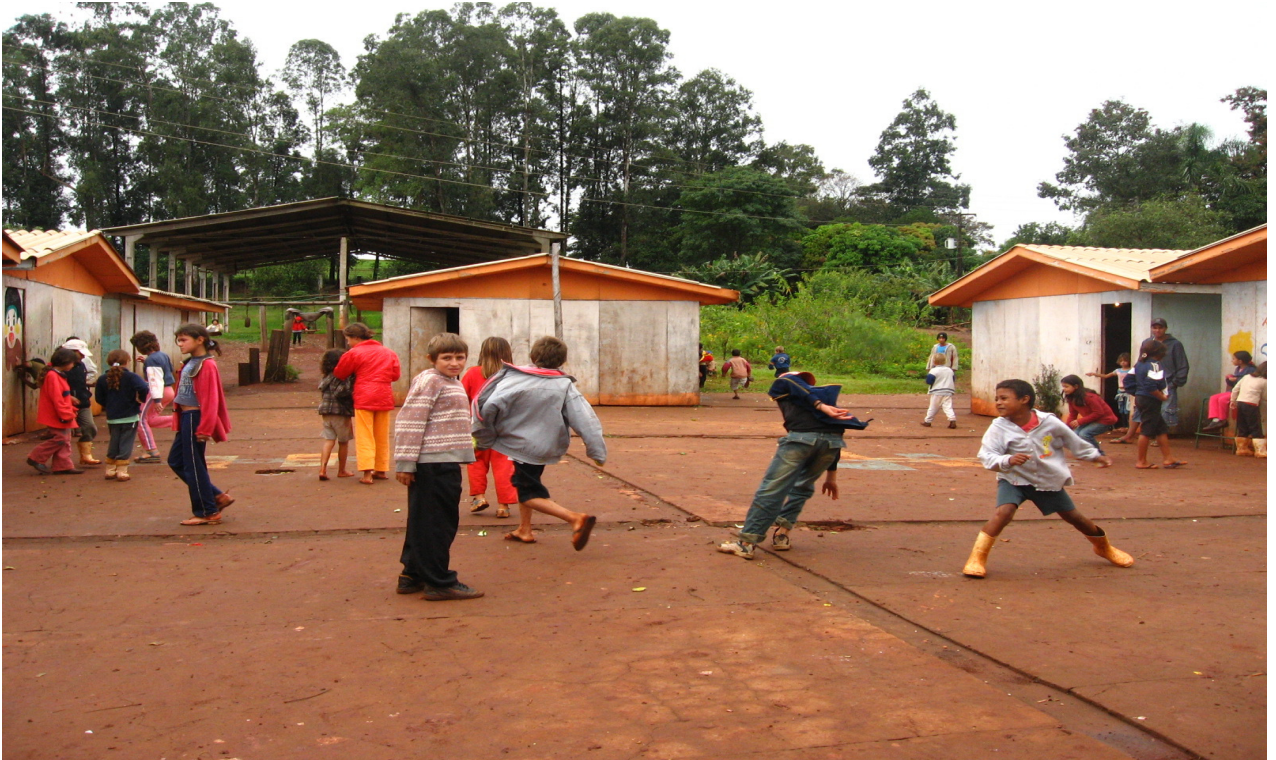
Ilustração 3: Tempo Recreio