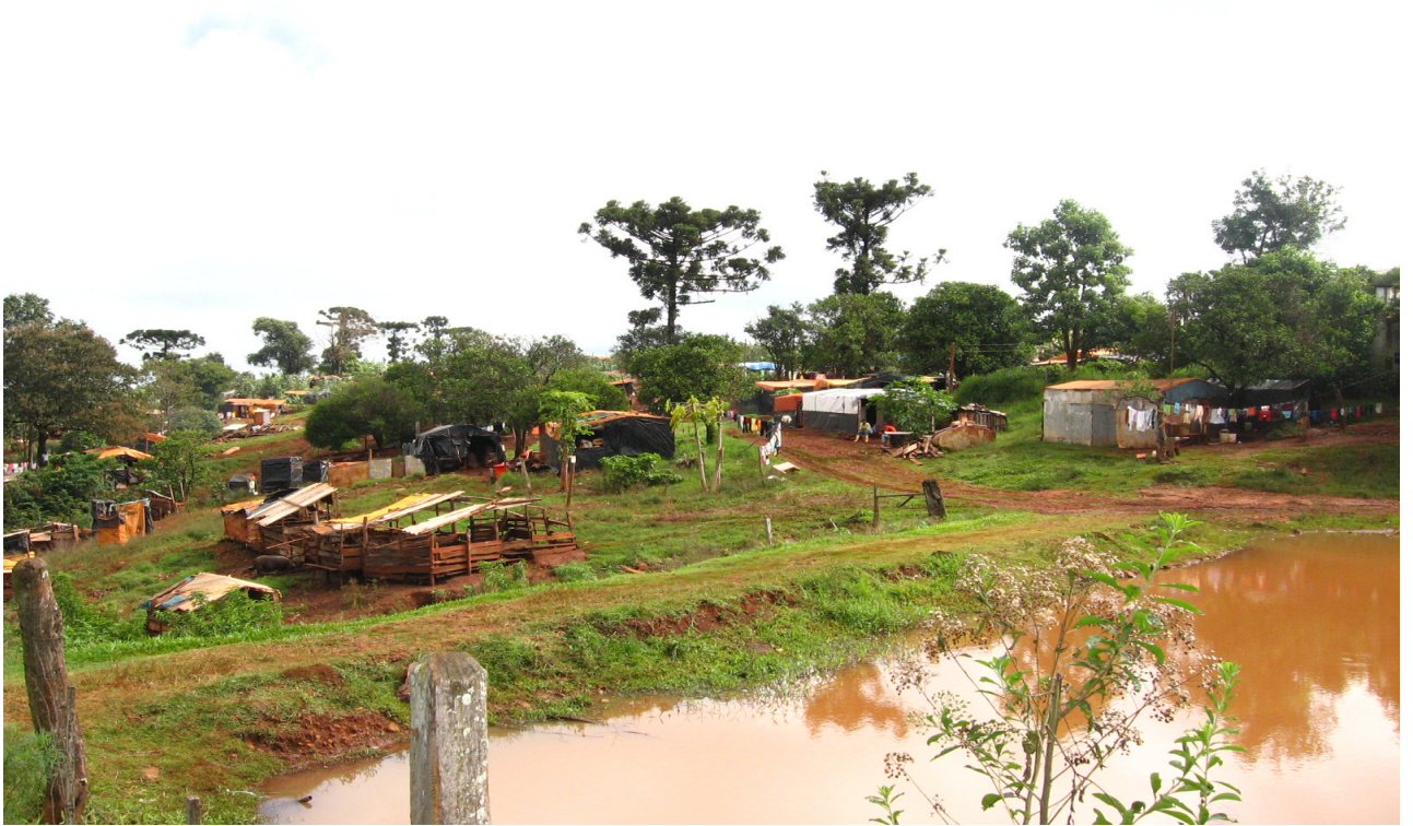
Ilustração 1: Acampamento Chico Mendes