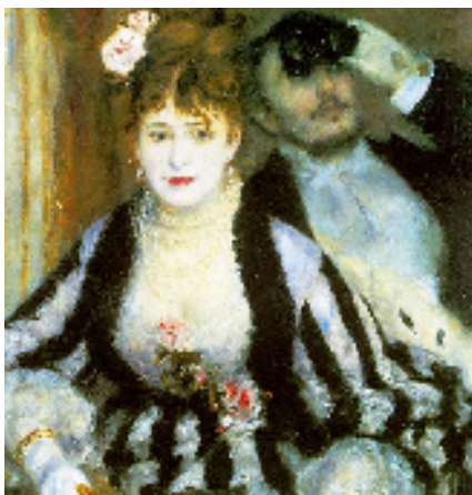
Figura 6 : “La Loge”, Renoir (1841 - 1919), 1874, Óleo s/tela, 80 x 63,5 cm.