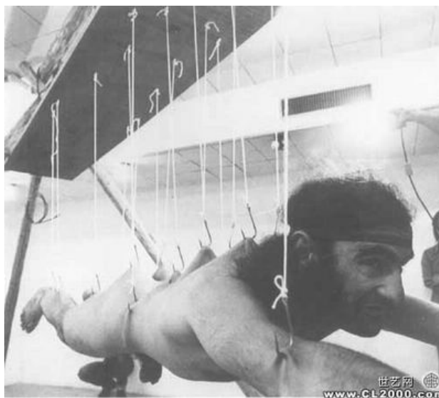
Figura 5 - Foto da Performance do artista Stelarc.

De todos os tipos masoquistas de autoflagelação e tortura esse eu acho o pior, me dá uma certa repulsa, repulsa de dor mesmo. Sei lá, o cara é louco. Pode até passar adiante isso aí. Parece que a pele vai rasgar (Eduardo, Licenciatura em Artes Cênicas, 26 anos).