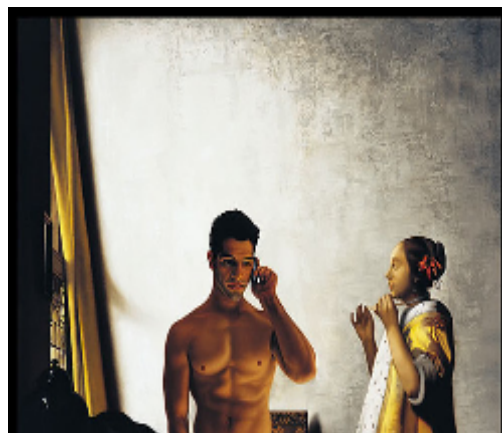
Figura 7: Ross Watson “s/título” (depois de Vermeer, 1664), 2001, 75 x 85 cm, óleo s/tela.

Assim, a experiência de oferecer a reprodução da obra de Ross Watson, para apreciação dos entrevistados, fez com que eu construísse uma análise que me levou a dois caminhos e a alguns entres , parafraseando Didi-Huberman. Um primeiro, que me fez pensar sobre as posições que ocupam homens e mulheres e como estes são representados pelos artistas em geral, e o que tais representações nos ajudam a pensar sobre tais posições. Para tal reflexão selecionei uma outra reprodução, de um outro artista que não estava dentro das treze imagens apresentados aos entrevistados. Trata-se da obra La Loge , de Pierre Auguste Renoir, artista que me ajudou a pensar ainda mais sobre o quadro de Watson e o que se esboçava ali. O segundo caminho me fez analisar aquilo que foi dito sobre a imagem de Watson, na seleção de algumas das respostas dos vinte entrevistados.