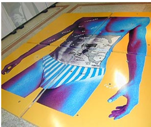
Figura 1: Série Body Builders , de Alex Flemming, 2001.

Portanto, as discussões nesta tese enredaram imagens de corpos masculinos nas artes plásticas e na mídia e o relato de jovens universitários ao observarem essas reproduções de arte. Nas suas falas, mesmo ao descreverem em profundidade somente algumas das imagens, obtive dados também sobre as suas masculinidades, como eles vêem seus corpos, padrões de beleza etc, presentes no cotidiano. Renan, por exemplo, ao observar a figura 3, nos diz: