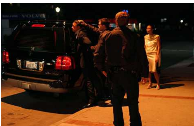
Figura 2: Cena do filme Crash, no limite , 2004.

o corpo de Christine em frente ao marido dela e do outro policial, de uma forma violenta, sem que haja qualquer reação do marido, muito menos do colega policial. Essa cena fala de mais de uma subordinação: a da mulher negra ao homem branco; a do homem negro aos outros dois homens brancos – o negro, mesmo ocupando uma posição econômica superior à do policial branco, encontra-se amedrontado pela situação.