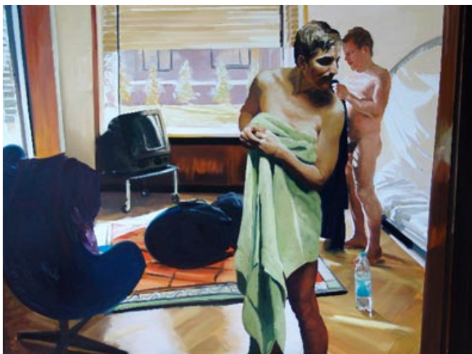
Figura 4: Eric Fischl, “Você deixa seu amante para responder ao telefone”. Óleo s/linho, 1983.

Por exemplo, ao observar a pintura de Eric Fischl durante as entrevistas gravadas, quatro dos vinte entrevistados afirmaram que a cena mostrava um casal do mesmo sexo, e três, que se tratava de um casal de homossexuais. Dois disseram que era um casal gay . Interessante ressaltar que, em uma das respostas, um estudante falou que o “ambiente dá o contexto”, ou seja, ele explica que se a cena fosse em um vestiário masculino, após um jogo de futebol, ele não pensaria em homossexualidade, mas como a cena acontece em um quarto, é o que imediatamente lhe remete. Somente quatro estudantes não fizeram referência ao fato de a cena ter uma temática sobre homossexualidade ou parceria entre dois homens; um deles disse que se tratava de “colegas de trabalho”. Já um outro afirmou que a cena lhe transmitia tranquilidade.