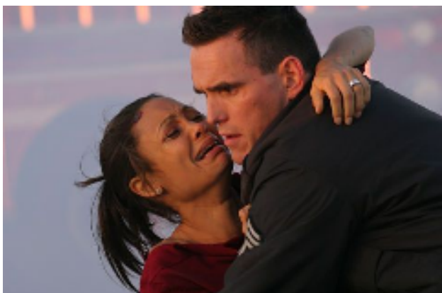
Figura 3: Cena do filme Crash, no limite , 2004.

situações. Não vemos profundas transformações dos personagens, exceto na cena em que o policial John se “redime” do abuso sexual, salvando Christine de um acidente de carro. A meu ver, isso poderia ser visto com um deslize do escritor, que parece tentar salvar a imagem do herói policial branco masculino, vivido por Dillon.