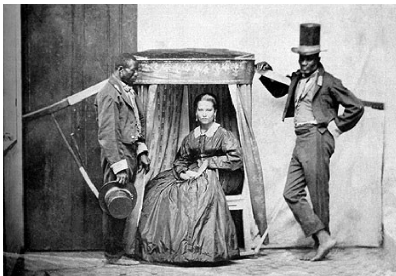
Ilustração 4 - Anônimo, Bahia, c. 1860: Escravos utilizados como meio de transporte. As cadeirinhas eram sempre carregadas por dois escravos uniformizados, escolhidos entre os de melhor figura da senzala. Dessa forma, a senhora expunha em público a sua condição social. Fonte: KOUTSOUKOS, Sandra Sofia Machado. No estúdio do fotógrafo: Um estudo da (auto-) representação de negros livres e escravos no Brasil da

Destarte, nessa sociedade alicerçada sobre os pilares do escravismo, as relações econômicas confundiam-se com relações pessoais de dependência ou de domínio, sendo a posse de terras e escravos, entendida como controle de bens e pessoas. Assim, em 1850, existiam escravos em todas as regiões da Província sergipana, não sendo estes um privilégio de indivíduos abastados, pois até mesmo a população livre mais pobre possuíam alguns braços responsáveis pelo desempenho de pequenas atividades, a maioria delas ligadas a prática da agricultura. Na ilustração 4 é possível visualizarmos escravos sendo utilizados como meio de transporte.