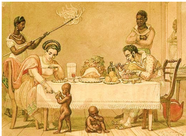
Ilustração 5 - Uma dama no interior de sua casa em atividades rotineiras, 1823. Autor: Jean Baptiste Debret.