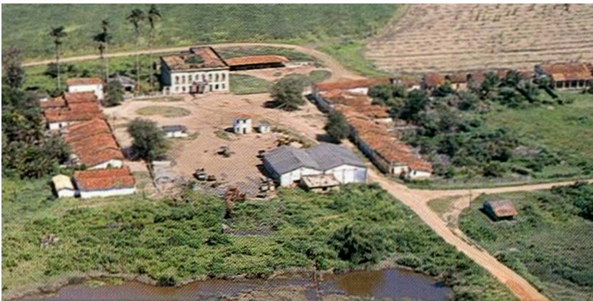
Ilustração 2 - Engenho Pedras: vista aérea da propriedade, no ano de 1999.