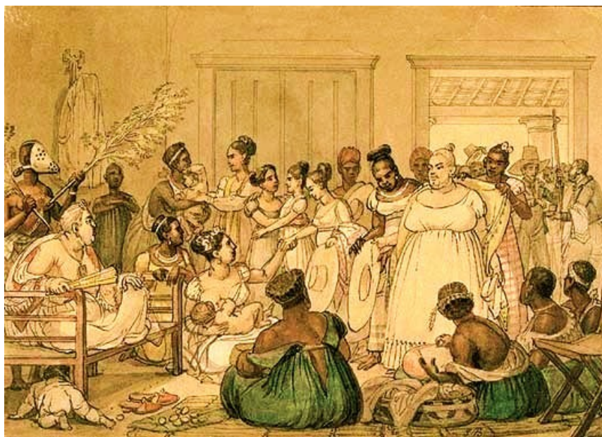
Ilustração 6 - Uma visita ao interior, 1820-1830. Autor: Jean Baptiste Debret.