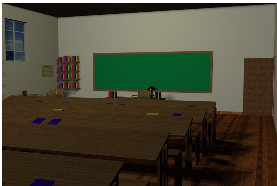
Ilustração 8 – Maquete eletrônica – simulando – uma sala de aula do ensino simultâneo. Autoria: Erley Resende da Silva.

Conforme pudemos verificar em Bastos (2005), a metodologia que sucedera o método lancasteriano – assim como ocorria com o ensino individual – tinha no professor seu agente de ensino, tendo este consistido em o docente instruir e dirigir simultaneamente – por isso a denominação: método simultâneo – todos os alunos, que realizam os mesmos trabalhos ao mesmo tempo. O ensino é coletivo e apresentado ao grupo de alunos reunidos em função da matéria a ser ensinada. Estes são divididos de maneira mais ou menos homogeneia, a depender do seu grau de instrução. Em suma, para cada grupo ou classe, um professor ensina e adota material igual para todos. 308