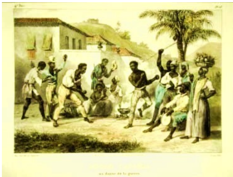
Ilustração 3 – Escravos na prática da capoeira. Pintura de autoria de Johann Moritz Rugendas.