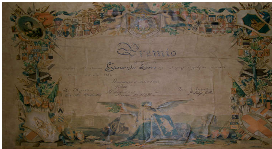
Figura 6- Prêmio concedido ao aluno Giocondo Sasso 102 .