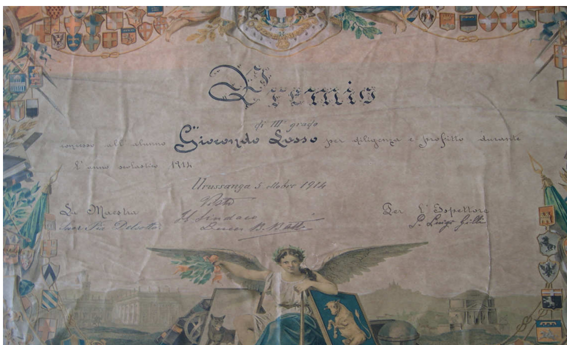
Figura 7- (Destaque) Prêmio concedido ao aluno Giocondo Sasso