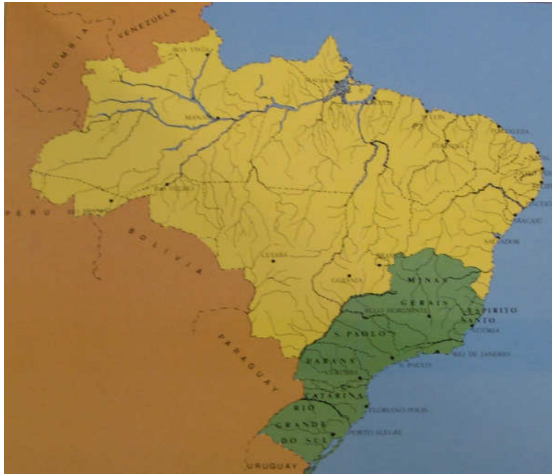
Figura 1- Mapa indicando a localização da colonização italiana no Brasil