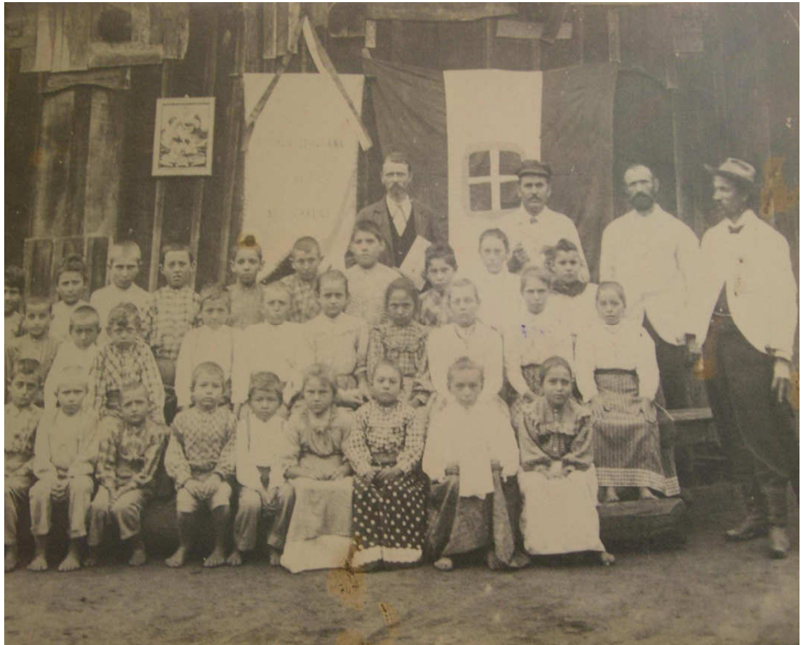
Figura 5 - Escola Italiana de Rio Carvão - Urussanga., início do século XX 49 .

em 1895, com a frequência muito escassa de 23 alunos no máximo (MACDONALD apud DALL'ALBA, 1983, p 173).