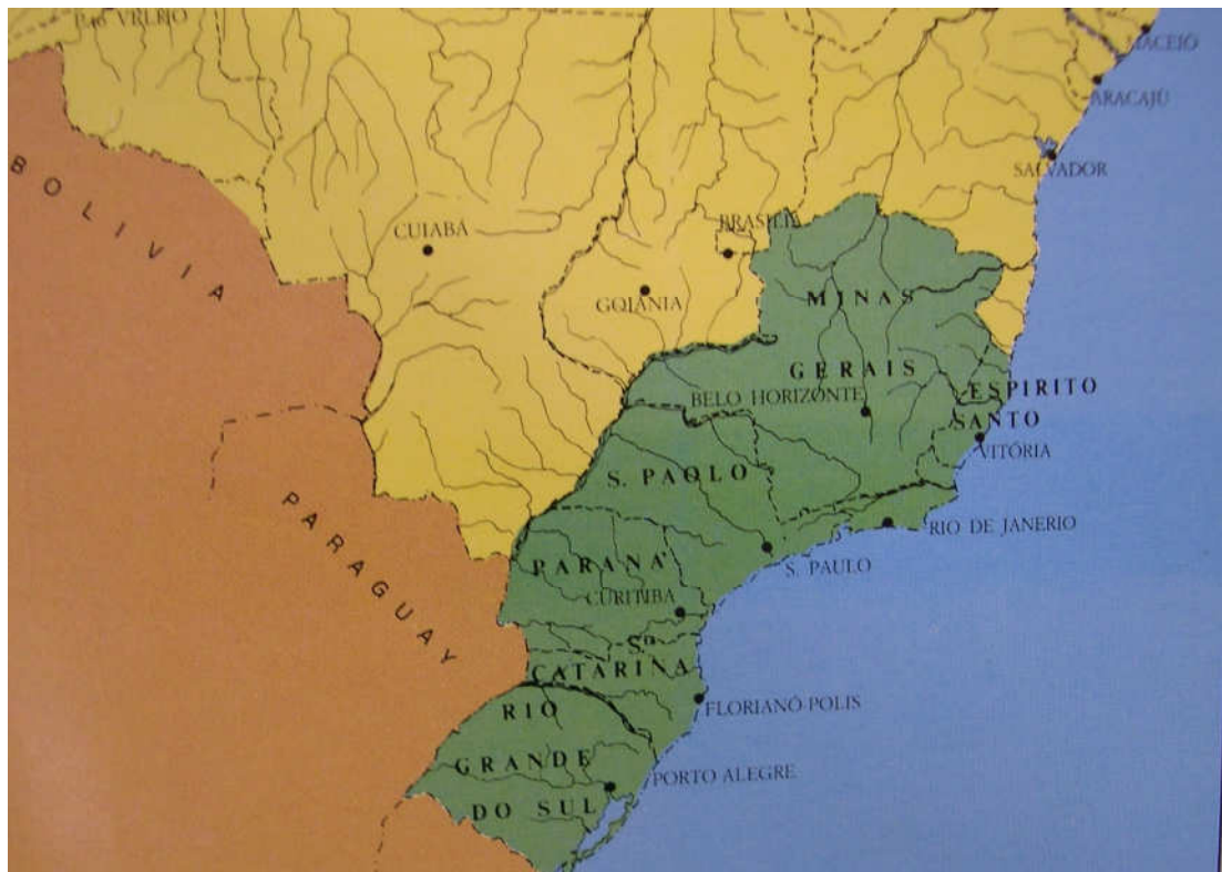
Figura 2- (Detalhe) Mapa indicando a localização da colonização italiana no Brasil