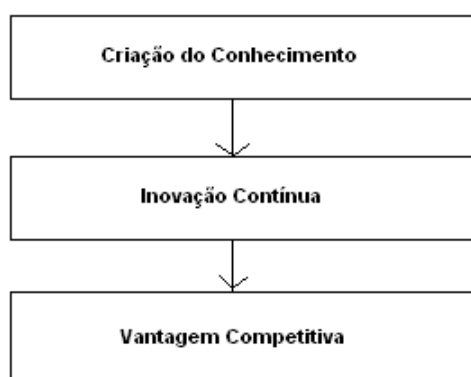
Figura 1 – Criação do Conhecimento

Apesar deste fato é importante a sua utilização, pois este tipo de abordagem permite a criação do conhecimento que segundo Nonaka e Takeuchi(1997) permitem a inovação contínua e a geração de uma vantagem competitiva para as Instituições de Ensino Superior que se utilizam deste tipo de abordagem, conforme sugere a figura 1: