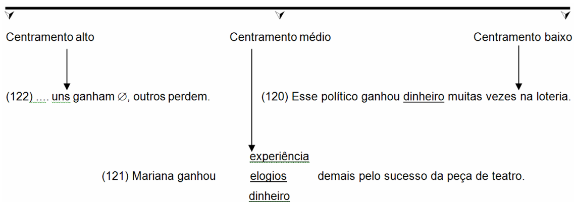
Fig. 2: contínuo de centrimento do verbo ganhar .

Percebemos, portanto, que, seja com formas verbais distintas, participantes de um mesmo acontecimento enunciativo - como pôde ser observado em (41) - seja com verbos idênticos, integrantes de enunciações diferentes - como exposto em (120), (121) e (122) - é possível que tenhamos predicacões com níveis de centrimento diversificados e esse nivelamento é sustentado discursivamente pela maior ou menor amplitude do domínio de referência que sustenta a ocupação material (orgânica) do lugar de objeto.