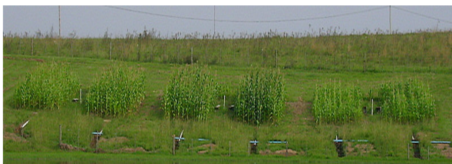
FIGURA 4. Vista geral dos tratamentos na área experimental, transcorridos 75 dias da sua implantação, antes da aplicação da segunda chuva simulada (Obs: da esquerda para a direita, são os seguintes os tratamentos em visualização: semeadura direta, adubação orgânica; escarificação, adubação orgânica; semeadura direta, adubação mineral; escarificação, adubação mineral; semeadura direta, sem adubação – tratamento testemunha 2 - e escarificação, adubação – tratamento testemunha 1).

os valores da variável em questão no que diz respeito à quantidade de massa de, unicamente, raízes de milho, fazendo com que os mesmos, de certa forma, resultassem discrepantes e desuniformes na referida camada (0 a 10 cm), de modo geral em todos os tratamentos. Na segunda camada avaliada do solo (10 a 20 cm), entretanto, onde a influência das raízes (mortas) da pastagem nativa (dessecada) foi menor, verifica-se que, exceto os tratamentos testemunhas (sem adubação), os quais apresentaram valores próximos ou, mesmo, superiores aos tratamentos com adubação, a biomassa da parte subterrânea do milho apresentou o mesmo comportamento do da altura média de planta e do da biomassa da parte aérea, com a maior quantidade de raízes estando associada aos tratamentos com escarificação e com adubação mineral, comparada à observada nos tratamentos com semeadura direta e com adubação orgânica. Este comportamento também pode ser justificado pelas razões utilizadas na explicação das diferenças na altura média de planta. A exceção feita em relação aos tratamentos testemunhas, no início da última sentença, pode ser explicada em termos de disponibilidade hídrica no solo, a qual, quando é baixa, obriga o maior desenvolvimento das raízes das plantas, para explorar um maior volume de solo (Raven et al., 2001).