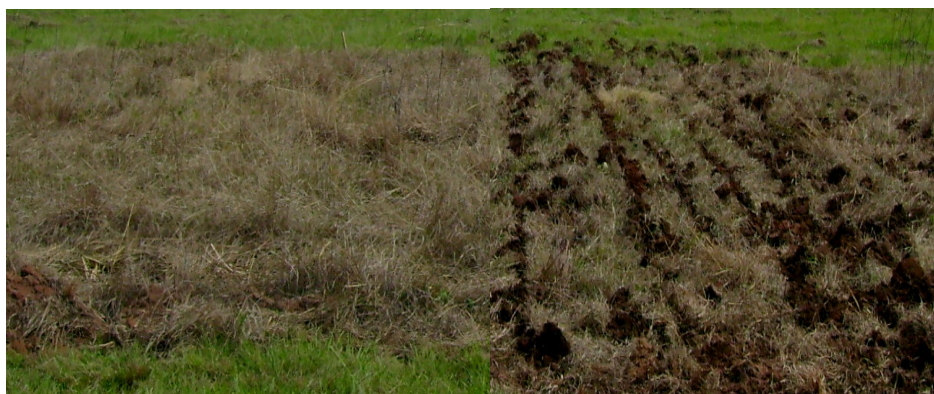
FIGURA 3. Vista detalhada das condições físicas externas ou de superfície do solo em dois tratamentos, logo após sua implantação, antes da aplicação da primeira chuva simulada (Obs: imagem da esquerda: semeadura direta; imagem da direita: escarificação).

1 Constituída do resíduo cultural (dessecado) da pastagem nativa. 2 Avaliados qualitativamente.