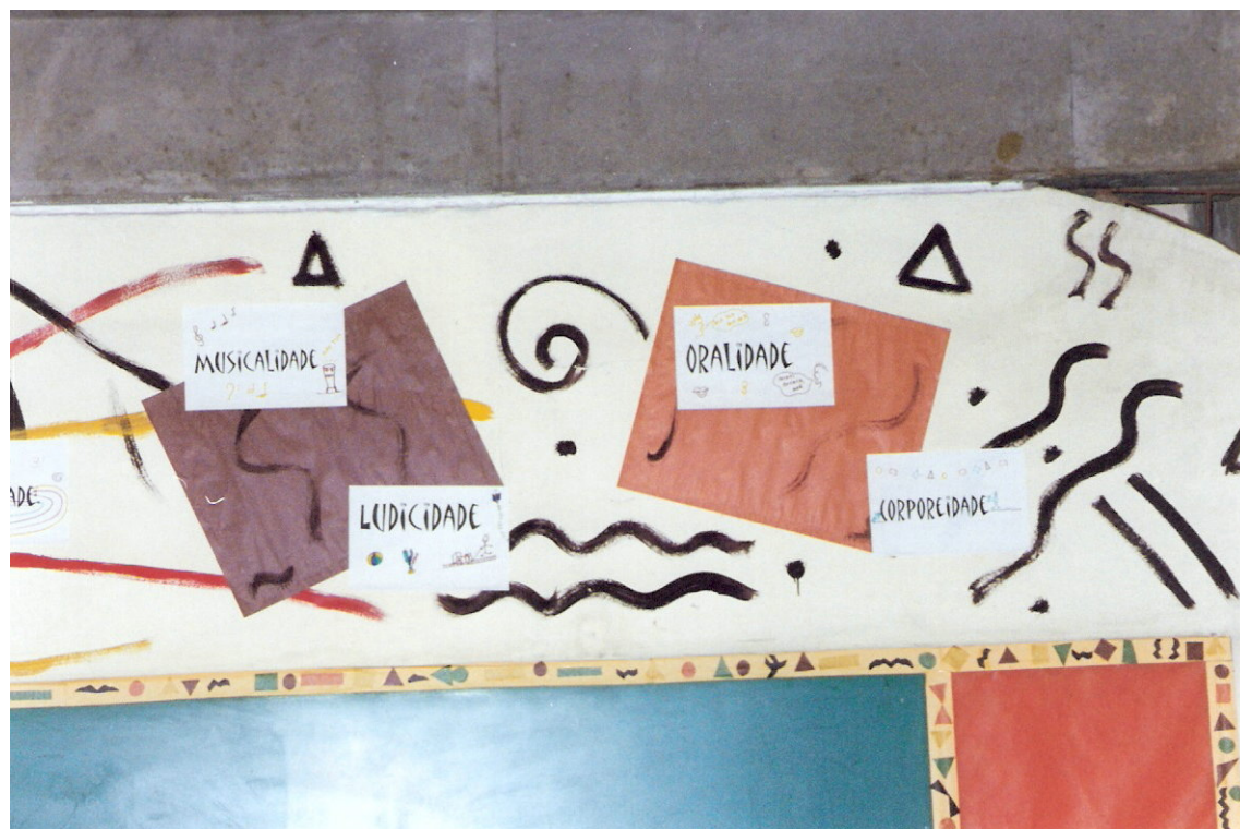
Fig. 11. Outros valores civilizatórios afro-brasileiros – Sala A Cor da Cultura