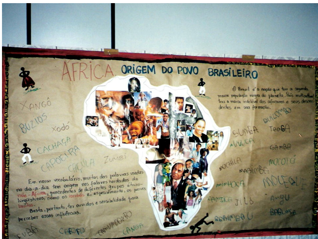
Fig. 3. Cartaz afixado em corredor que dá acesso às salas de aula