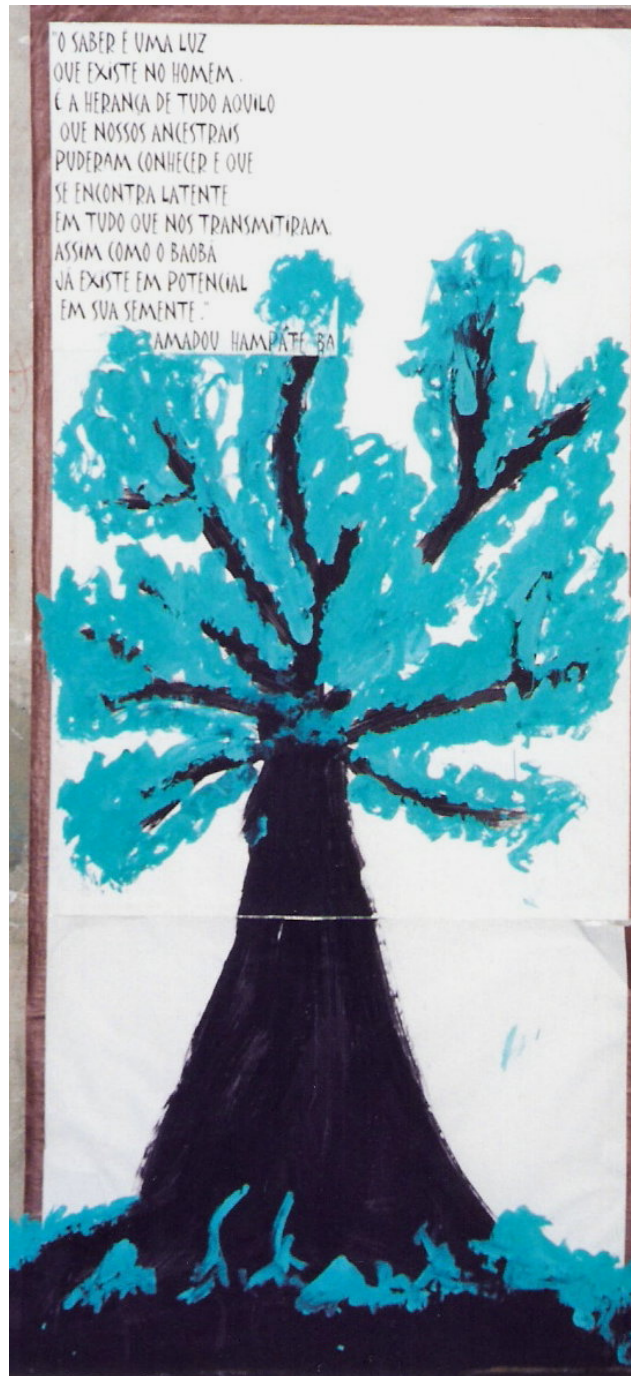
Fig. 5. Desenho de árvore Baobá pintado na parede – Sala A Cor da Cultura