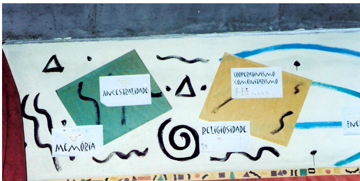
Fig. 9. Valores civilizatórios afro-brasileiros – Sala A Cor da Cultura