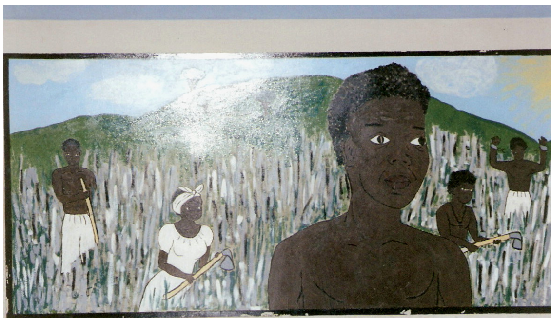
Fig. 2. Painel pintado na parede do corredor que dá acesso à rampa de subida