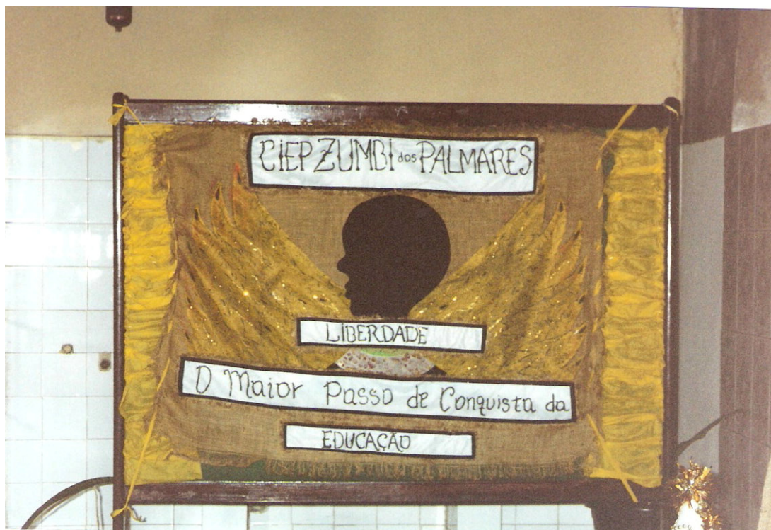
Fig. 1. Painel situado próximo à sala da direção geral