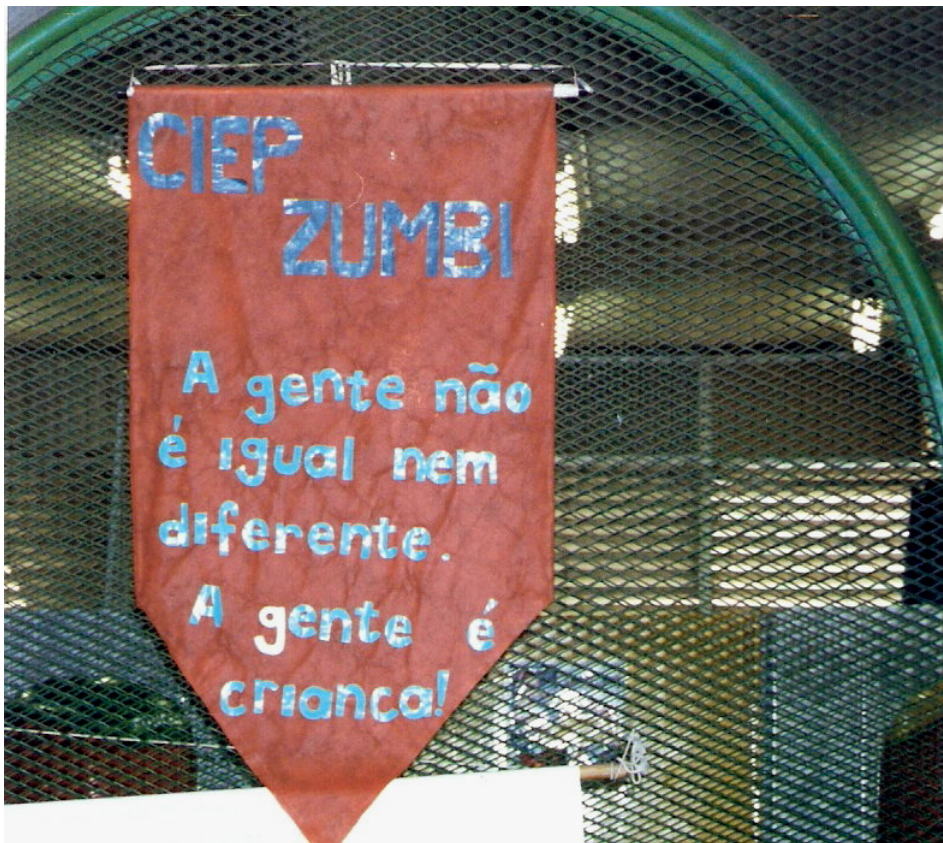
Fig. 12. Banner situado em um dos pavilhões que dá acesso às salas das direções e da coordenação pedagógica