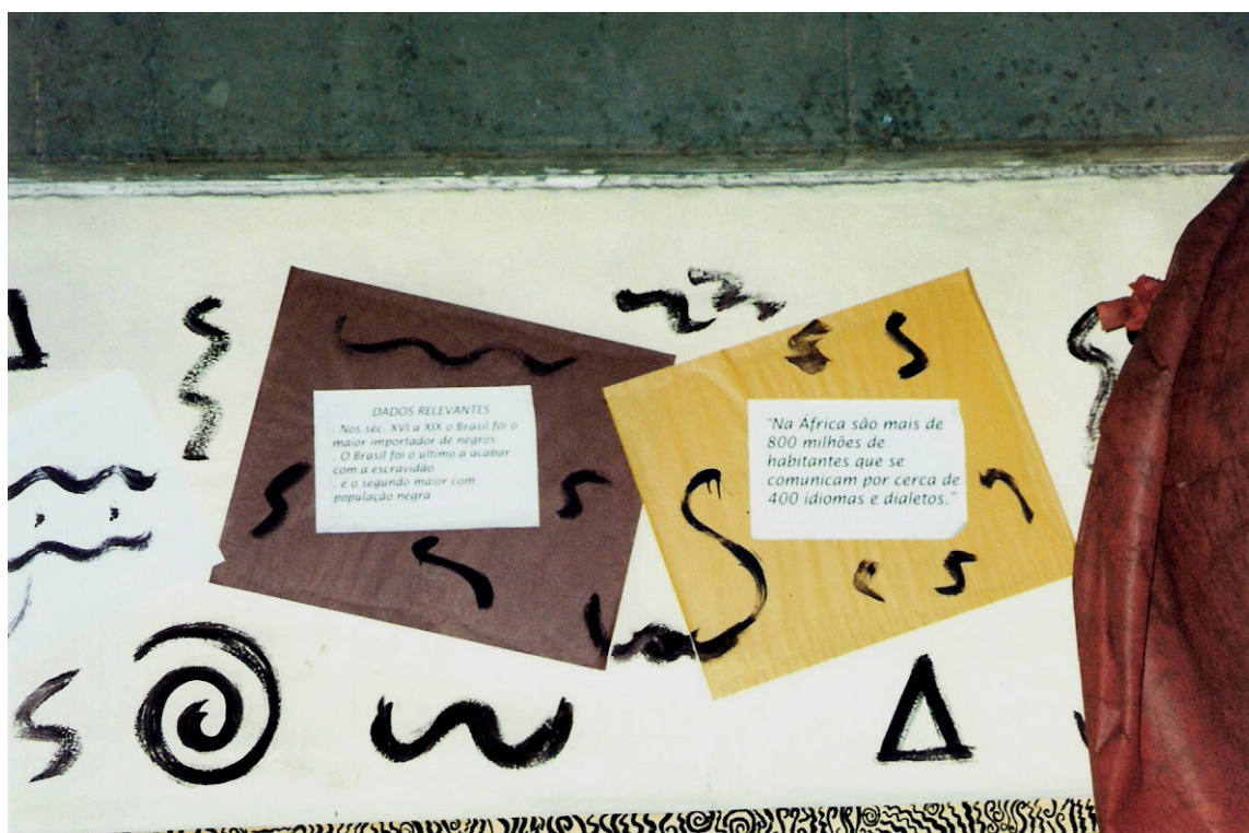
Fig. 7. Informações sobre a escravidão no Brasil e sobre a África – Sala A Cor da Cultura