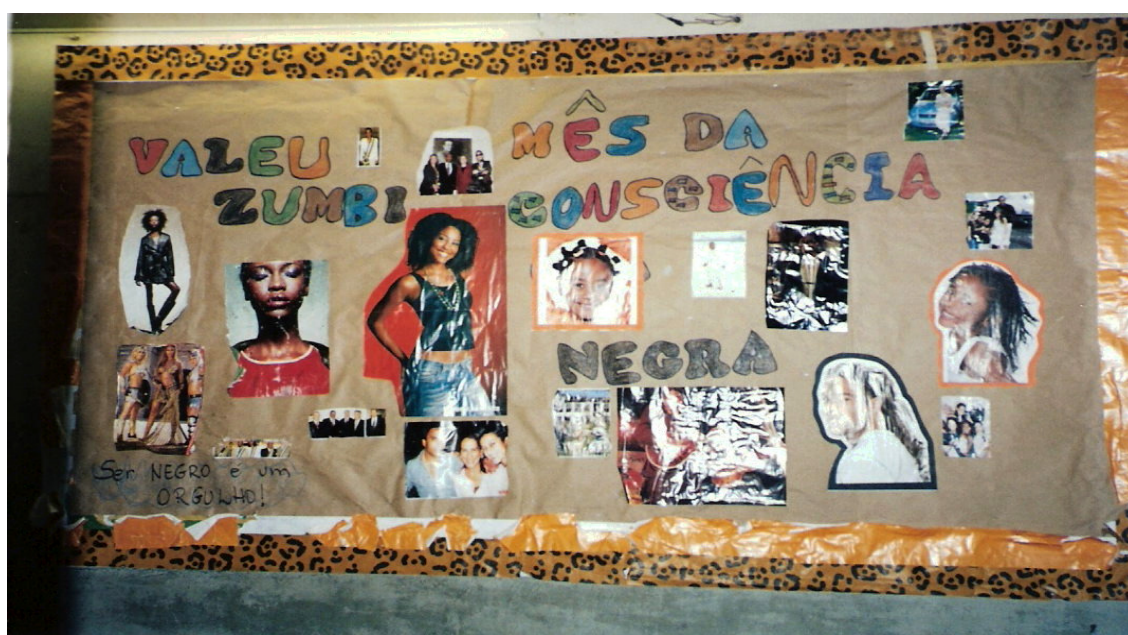
Fig. 4. Cartaz comemorativo do Dia Nacional da Consciência Negra