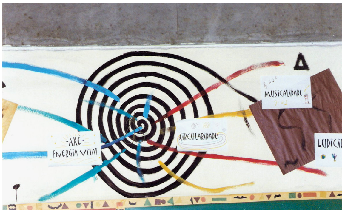
Fig. 10. Mais valores civilizatórios afro-brasileiros – Sala A Cor da Cultura