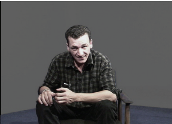
Brèd e[k/t] chocolat (2006), de Rosângela Rennó: encenação de duelo verbal entre colonizador e colonizado