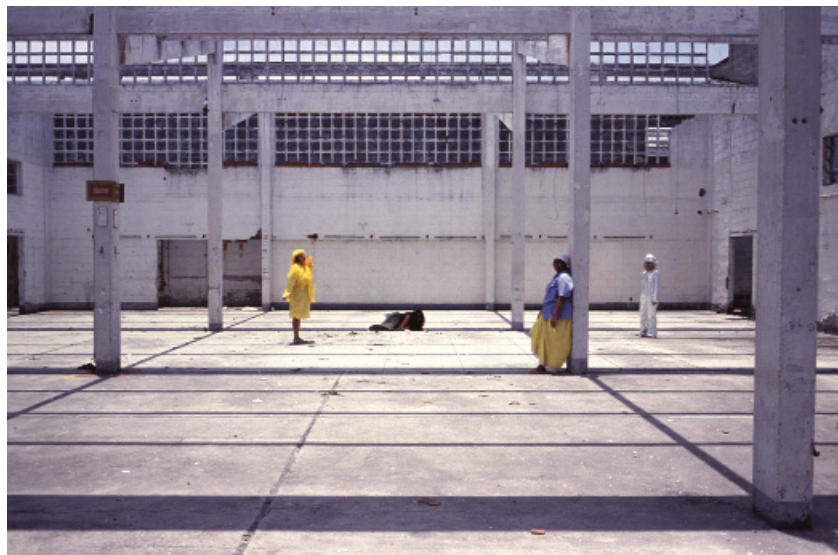
As camaleões (2002), de Janaina Tschäpe: a fabulação como dispositivo de documentação da realidade de quatro moradoras da favela do Jacarezinho, no Rio de Janeiro