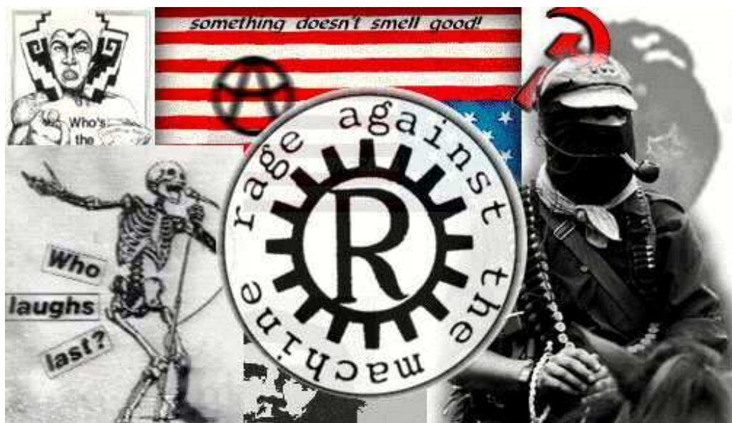
Imagem retirada do site da banda Rage Against the machine

Com esta capacidade de difusão, os movimentos que lograram se utilizar da mídia conseguirão divulgação maior e apoio as suas causas. Um exemplo disso foi o apoio dado pelo grupo musical norte-americano Rage Against the Machine 2 ao EZLN. Suas músicas, recheadas com letras de protestos chegaram às casas de jovens e adultos, entre eles, eu, que ouviram sua música. A postura de protesto diferentemente da visão construída da juventude “rebelde” ao estilo Sex Pistols, utilizava-se das letras para levar informações para os fãs, e dentre estas informações, declaravam apoio a um grupo guerrilheiro chamado Exército Zapatista de Libertação Nacional, ou mais popularmente, EZLN. A partir daí, uma questão se colocou, o que levaria um grupo de jovens norte-americanos a se preocuparem e se interessarem por um pequeno grupo guerrilheiro com atuação no sudeste do México, mais precisamente no estado de Chiapas, o mais pobre da nação? Outro grupo, chamado Brujeria 3 , conseguiu seu espaço no cenário trash-metal internacional cantando letras de protestos, seja a favor dos zapatistas ou contra a figura emblemática de Fidel Castro. Este grupo mexicano percorreu o mundo, assim como o Rage Against the Machine, levando mensagens a diversos jovens ao redor do mundo, onde muitos (assim como eu) se interessaram pela história e pela postura deste grupo guerrilheiro pouco tradicional.