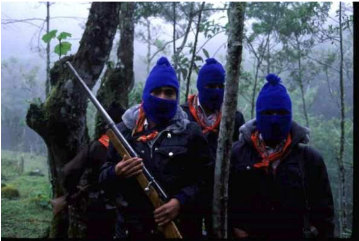
Zapatistas usando o tradicional passa-montanhas para encobrir os rostos.

A motivação da "dignidade" constitui uma base moral da luta zapatista que corresponde, no México, ao que foi a prática político-moral de Martí em Cuba. É difícil alcançar os mexicanos com razões "morais"; em sua cultura, a "dignidade" tem a capacidade de desatar uma dinâmica muito mais poderosa. A política de mediação, ou de meios e caminhos para conseguir objetivos é muito original. Nas propostas dos zapatistas, objetivos e meios aparentam se apresentar como intercambiáveis. De um lado, os zapatistas se somam à mais popular e reclamada das lutas atuais do povo mexicano e de outros povos do mundo. Ao mesmo tempo, programam uma democracia nova entre os revolucionários; uma democracia na qual se apresentam como plural em relação às ideologias, às religiões e às opções políticas, que não é necessariamente o caminho para o socialismo, e em que não se aceita que a democracia "formal" seja somente "mediatização", em que inclusive se exige aplicá-la efetiva e honestamente. Porém, longe de se deter ali, os zapatistas pedem democracia com justiça, liberdade para os indivíduos e não somente para os povos. Ou vice-versa. Fazem sua a idéia de um regime que não seja presidencialista e de uma federação que seja real, em que haja um certo equilíbrio de poderes soberanos. Colocam o problema da justiça para os "homens