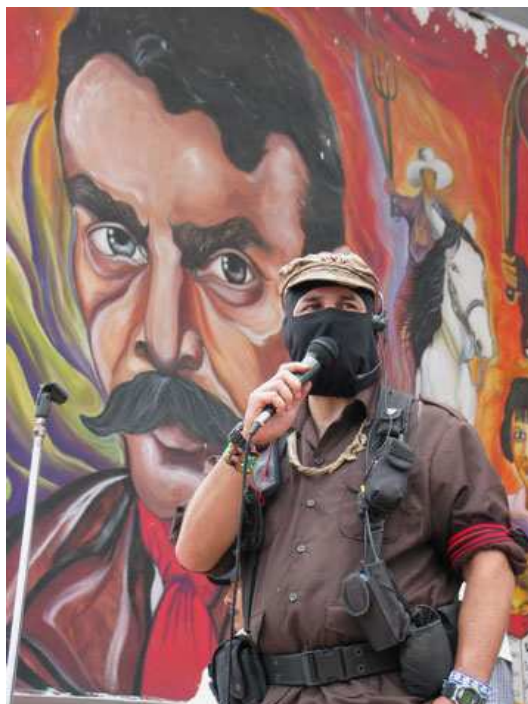
Subcomandante Marcos em discurso para jovens universitários da UNAM

O zapatismo do final do século XX surpreendeu por muitas razões, pela vestimenta dos combatentes, pela composição étnica de seus aderentes, pela atualização de imagens, nomes e pessoas a ponto de dar ouvidos ao passado histórico mexicano. Mas também surpreendeu porque demonstrou que a política não é inexoravelmente o terreno intocável pela grande população. De resto, a sociedade mexicana tomou mais a sério quem falava de política de forma irreverente e com humor, diferentemente de quem a propõe através de formatos sérios e se vestem formalmente para falar uma linguagem política que poucos escutam e muitos duvidam. O discurso político revolucionário apela para a poesia e para a anedota, para o jogo de palavras e a metáfora. Frente a isso, a classe política “profissional” se encontra desarmada. Talvez alguns membros desta classe compreendam que sua aprendizagem formal ou informal não os capacitou para dialogar com a sociedade, e sim entre eles mesmos em um código indecifrável para os “não-iniciados”.