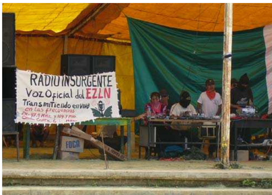
Instalações da Rádio Insurgente.

Entretanto, uma das coisas mais interessantes são as presenças de encartes de CDs musicais das bandas zapatistas. Através da rádio, pode-se ter acesso a essas músicas e comprar os discos. Isso soa estranho se pararmos para pensar que estamos falando de um grupo guerrilheiro. Entretanto falamos de um grupo que usa das armas de divulgação dentro de um meio capitalista como forma de extravasar sua voz.