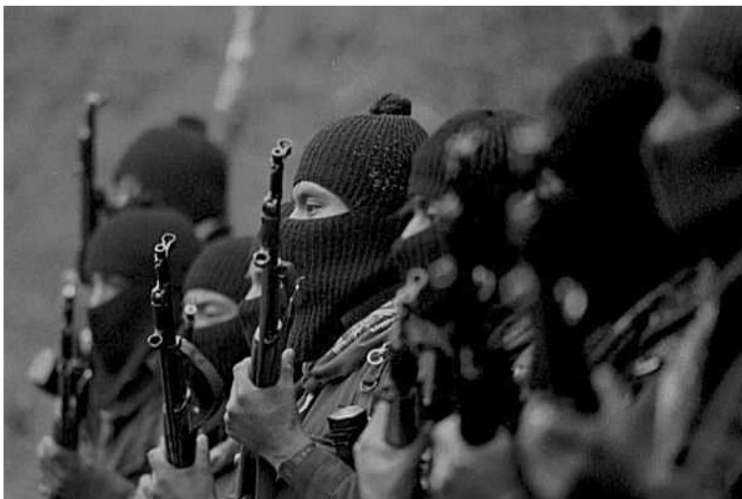
Grupo Zapatista Armado durante o período de confrontos com as tropas governamentais. Imagens retiradas do site oficial do EZLN

Para vencê-la, propõe-se uma luta defensiva-democrática, uma revolução defensiva-democrática cuja única possibilidade de vitória é que ela se transforme em uma grande luta política e social, capaz de modificar as correlações do poder e o mercado no sentido de um projeto local, nacional e eventualmente global. No que diz respeito a essa luta democrática, não se conhecem suficientemente as variantes e as tendências e se carece ainda de uma teoria geral. Somente se sabe que, sem uma luta democrática com dignidade e autonomia dos que se encontram na parte de baixo da estrutura social, não haverá vitória social segura nem negociação que permita ao povo acumular forças para enfrentar a opressão e a exploração do PRI, dos caciques , do governo, do sistema.