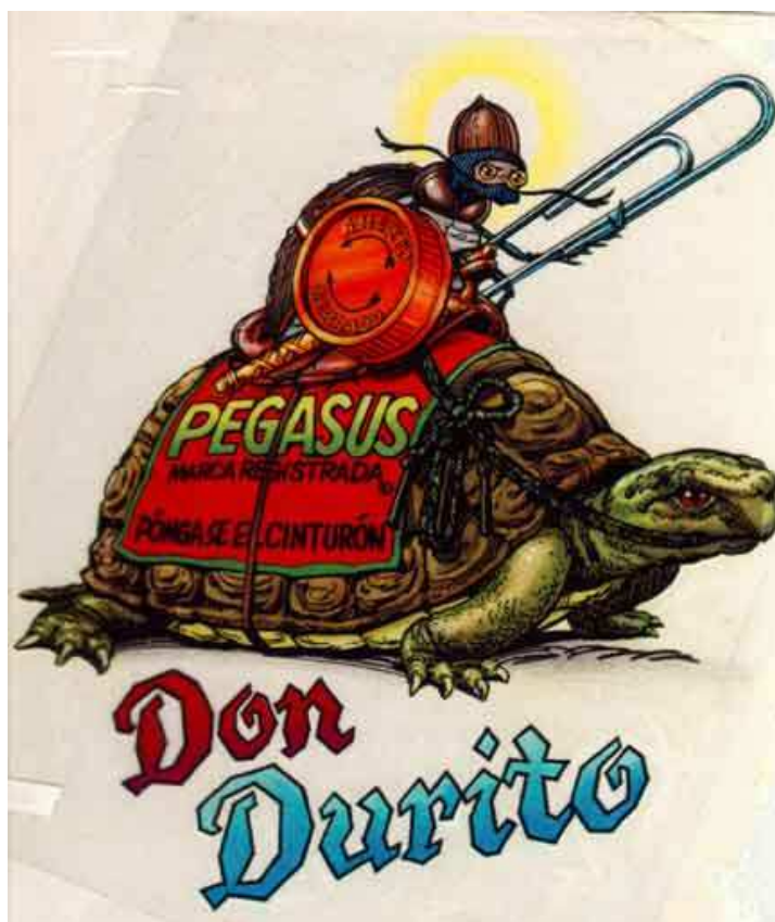
Ilustração representando a figura de Don Durito de Lacandona montado em sua montaria Pegasus.

mesmo os “estrelismos” dos seres humanos. E, ainda por cima, é um revolucionário mexicano, anti-neoliberal por excelência e herdeiro de uma tradição revolucionaria como sabe bem ser os mexicanos”. 107