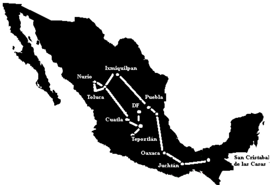
Imagem retirada do livro Votán-Zapata .

Entre os meses de fevereiro e março de 2001 o EZLN realizou a Caravana Zapatista ou o Zapatour, sem dúvida a maior mobilização nacional da história da sociedade civil mexicana. Depois de passar por diversos estados, levando sua palavra e cultura, os zapatistas conseguiram reunir na região da Cidade do México conhecida como El Zócalo , mais de trezentos mil participantes que ouviram em silêncio o discurso do subcomandante Marcos. A caravana foi liderada pelo conselho de 24 comandantes zapatistas, em uniforme completo e máscaras (embora sem armas), inclusive o próprio subcomandante Marcos. Como nunca se ouviu falar do comando zapatista viajando para fora de Chiapas (e há vigilantes que ameaçam duelos mortais com Marcos em todo o caminho), o “ZAPATOUR” precisava de segurança estrita. A Cruz Vermelha recusou a tarefa, que começou a ser providenciada por várias centenas de ativistas italianos do ¡Ya Basta! . (No fim, a segurança foi garantida por grupos locais.) Centenas de estudantes, pequenos agricultores e militantes se uniram ao espetáculo itinerante, e milhares foram se juntando a eles pelo caminho. Estes ajudantes escoltavam a caravana e se alto denominavam zapatistas, alguns chegavam a afirmar ser o próprio Marcos. Diziam, para grande confusão dos jornalistas, “Todos nós somos Marcos”.