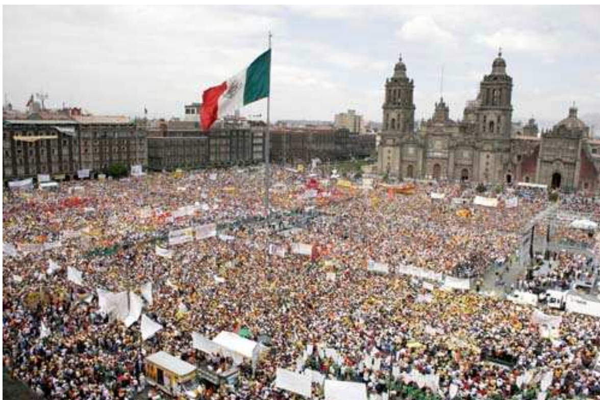
Encontro final da marcha zapatista na Cidade do México após viajar por diversos estados da nação.