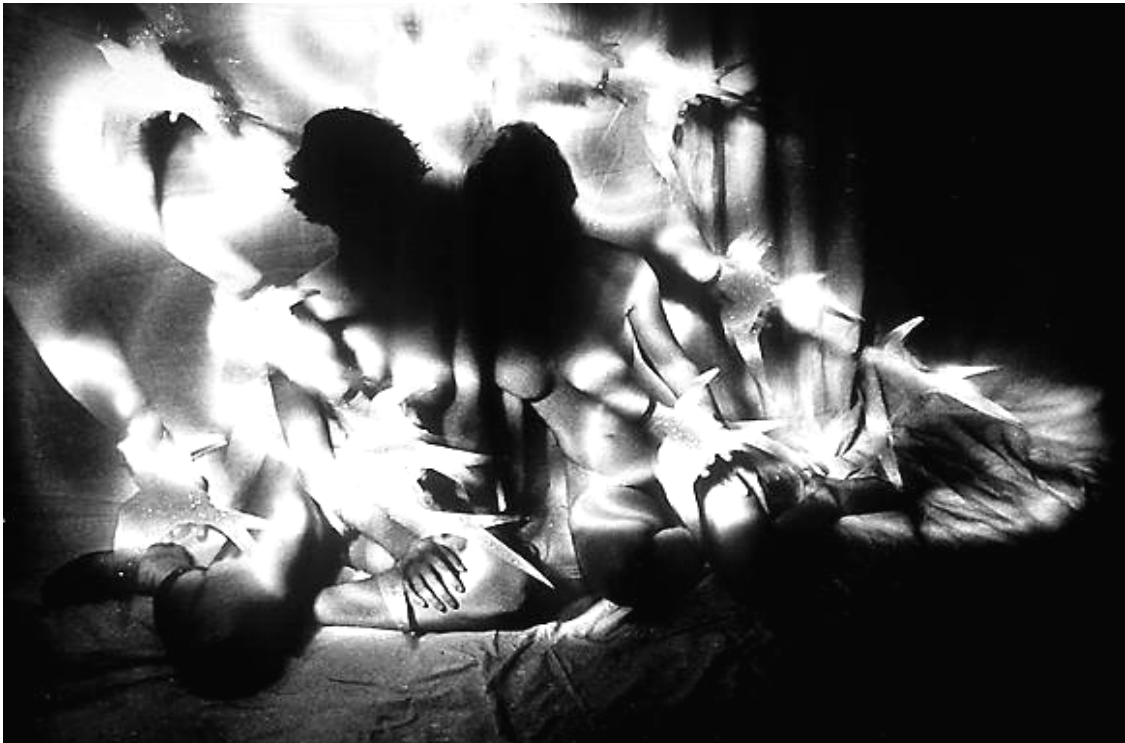
Figura 4: Evgen Bavcar – Desnudos