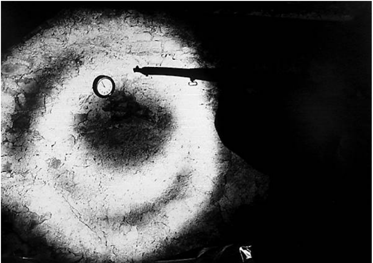
Figura 2: Evgen Bavcar – Disparo Contra o Tempo

Portanto o passado não é passado, nem o futuro é futuro. Eles só existem quando uma subjetividade vem romper a plenitude do ser em si, desenhar ali uma perspectiva, ali introduzir o não-ser. Um passado e um porvir brotam quando eu me estendo em direção a eles. Para mim mesmo, eu não estou no instante atual, estou também na manhã deste dia ou na noite que virá, e meu presente, se se quiser, é este instante, mas também este dia, este ano, minha vida inteira.