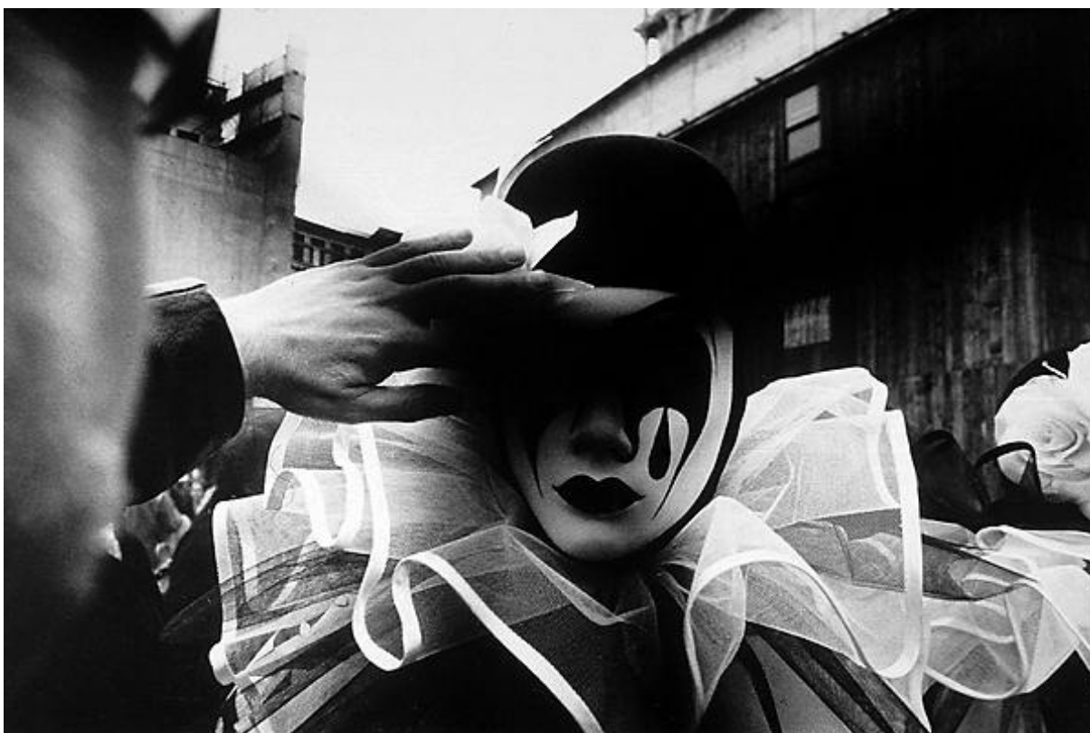
Figura 5: Evgen Bavcar – Máscaras em Veneza

A unidade e a solidariedade entre a humanidade não pode consistir num acordo universal sobre uma única religião, ou uma única filosofia, ou uma única forma de governo, mas na fé de que o múltiplo aponta para um Uno, simultaneamente oculto e revelado pela diversidade.