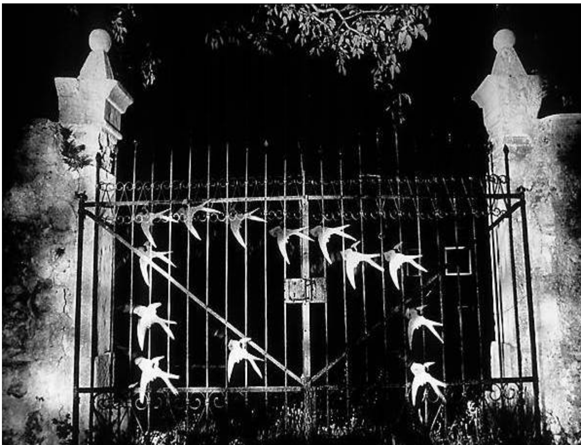
Figura 1: Evgen Bavcar – A Porta