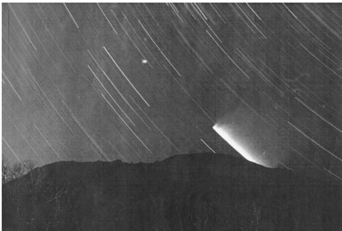
Figura 3: Evgen Bavcar – 1997