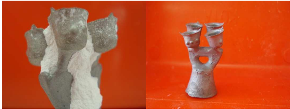
Figura 6 e 7. Fundição e usinagem das coroas metálicas.