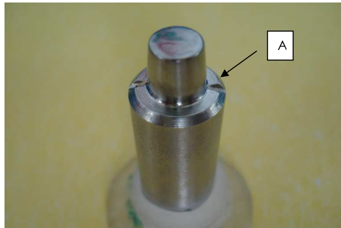
Figura 1. Troquel mestre metálico.

axio-cervical uma canaleta de secção triangular (conforme indicação A na figura 1), com a finalidade de guiar a inserção das ceroplastias e as posteriores fundições.