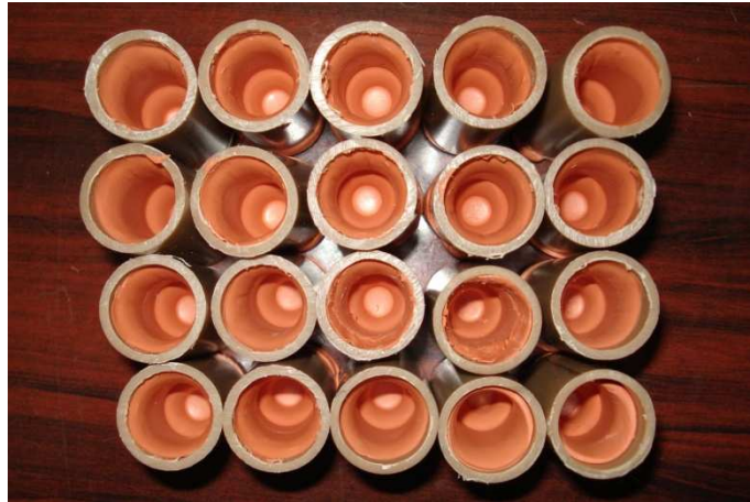
Figura 4. Moldeiras individuais com silicona de adição de alta viscosidade.

Após a polimerização do material, a moldagem foi separada do troquel e removida a matriz de polipropileno. Nesta etapa, cinco moldagens com silicona de adição de baixa viscosidade (Express, 3M/ESPE) foram executadas para cada grupo, inicialmente o grupo 4, sem espaçador, e, posteriormente os demais grupos sucessivamente após a aplicação de uma, duas e três camadas de espaçador.