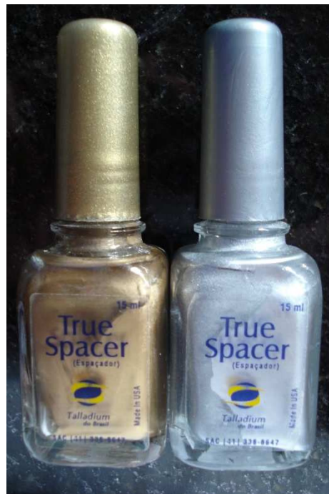
Figura 2. Espaçadores para troquel.

O processo de pintura do troquel mestre foi realizado aplicando uma camada de espaçador em todas as paredes axiais e oclusal, tendo como o limite o ângulo formado pela parede axial com o ombro de 90° do troquel.