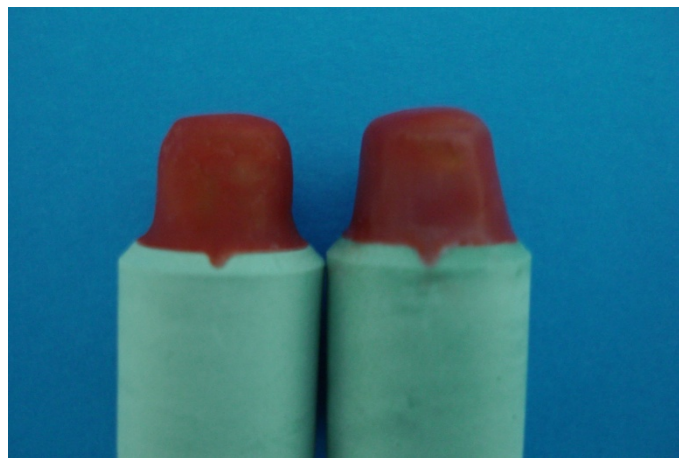
Figura 5. Troquéis em gesso com as ceroplastias.

O enceramento dos padrões para fundição foi realizado diretamente sobre os troquéis de gesso (Figura 5), através da imersão destes em cera (Plastodont Art Line, Degussa) fundida. O excesso de cera foi removido com uma espátula Le Cron (Duflex, SS White) finalizando na região cervical do troquel para verificar a adaptação da ceroplastia.