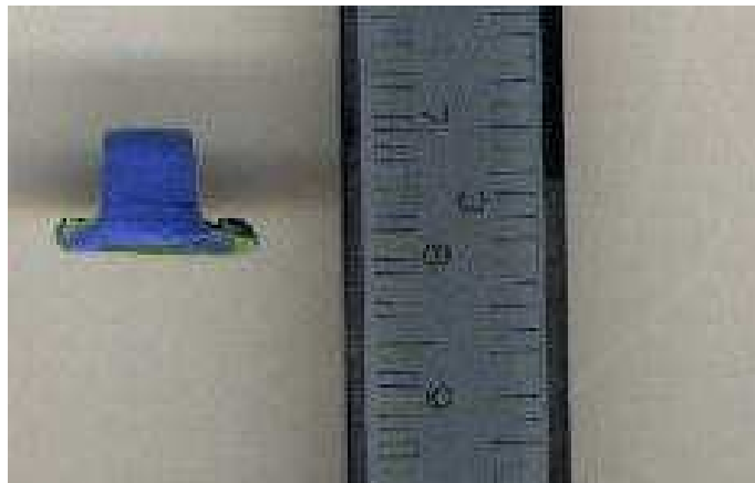
Figura 9. Secção transversal da silicona para medição, com o paquímetro milimetrado para conversão em micrometros e escaneamento.

Os valores obtidos em \mu\text{m} foram transformados em médias dentro de cada grupo e cada localização (parede axial e parede oclusal) e submetidos a análise estatística.