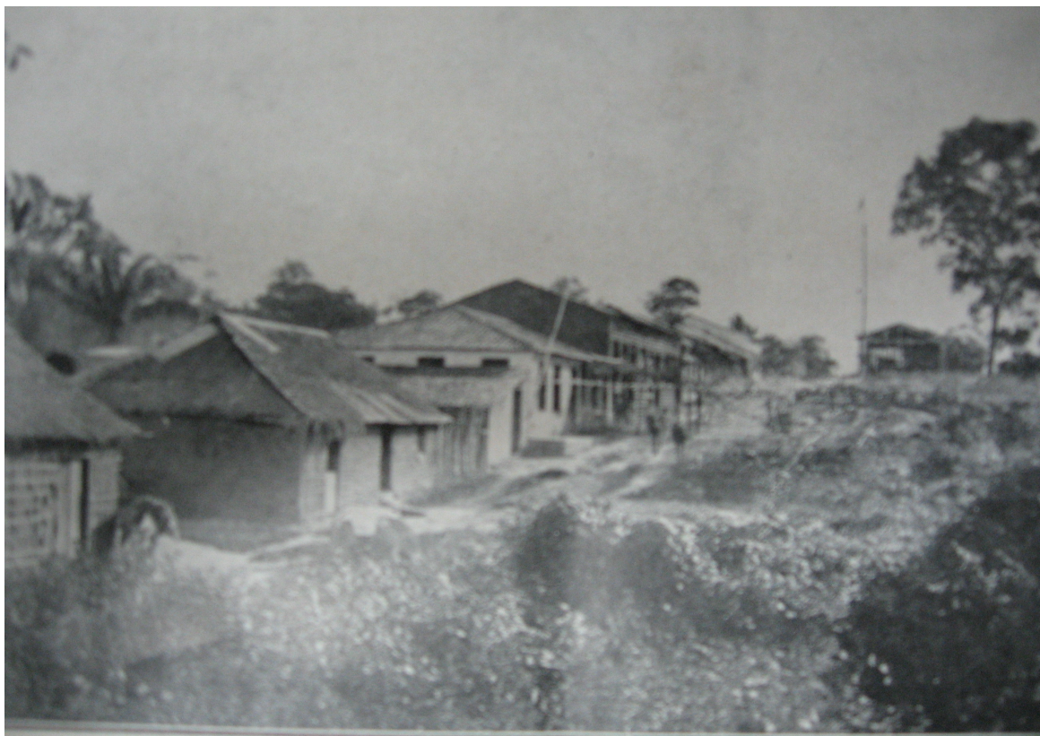
Rua de Santo Antonio do Madeira