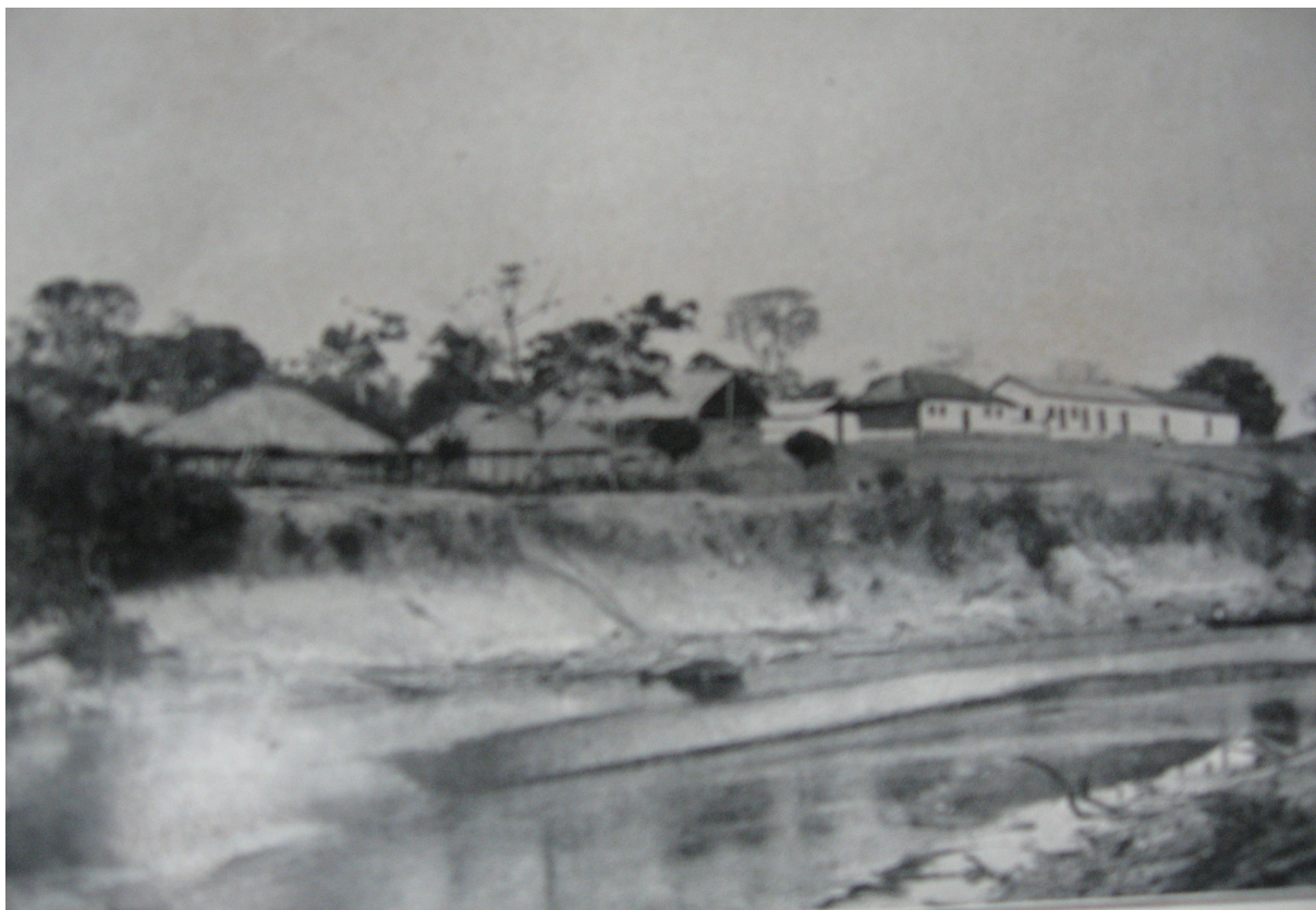
Barracão Bom Futuro – Alto Madeira - Jamary