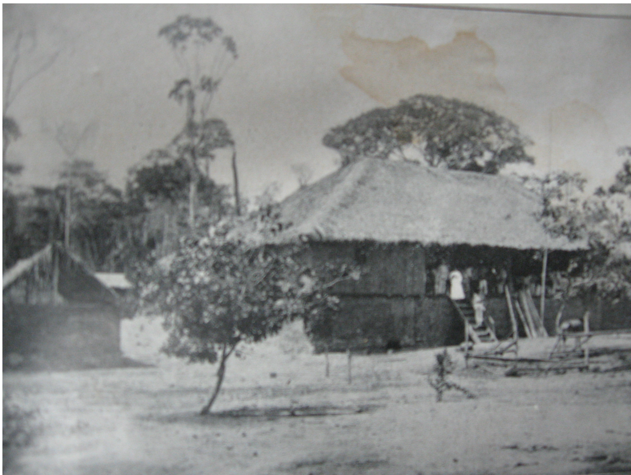
Barraca Jatuarana no Rio Juary