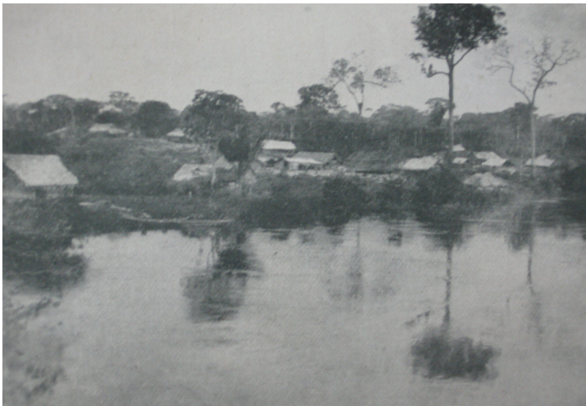
Barracão do Rio Jamary