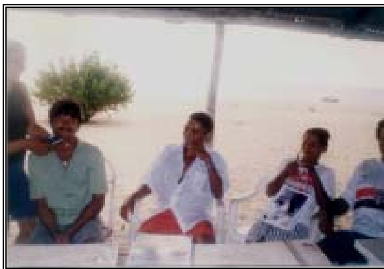
Foto N º 3 – Espaço Raízes da Fé/Praia da Saudade – Ilha de Cotijuba

Optamos por trazer relatos e fragmentos das práticas pedagógicas realizadas nas ilhas, por uma exigência daqueles e daquelas que moram e trabalham nas mesmas. Há uma fala recorrente entre educadores e educadoras que trabalham nessas áreas, acerca do tratamento a eles dispensado, o que tem sido dado em forma de “nota de rodapé”.