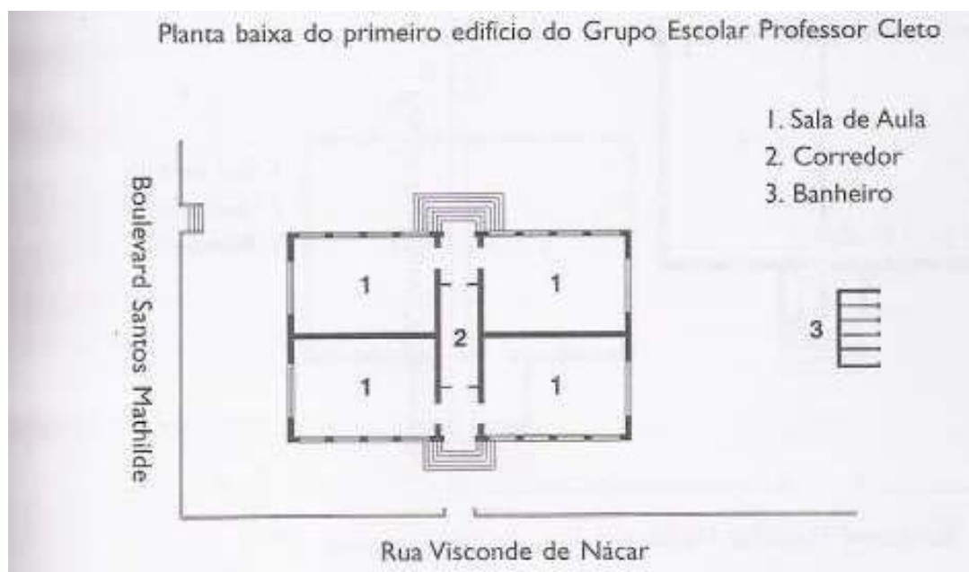
Figura 2 54

Essa política, embora já viesse orientando a construção dos novos grupos escolares, foi assumida explicitamente e passou a fazer parte do corpo normativo-legal a partir do Código do Ensino em 1915. O seu capítulo IX, que tratava dos “Prédios e moveis escolares: higiene escolar”, estabelecia que “cada prédio escolar do Estado” deveria, além de ter “todas as condições recommendaveis pela pedagogia e pela hygiene”, também “ter a casa no centro do terreno a ella destinado, o qual, limitado por muro ou gradil, terá área sufficiente para conter os pateos de gymnastica e recreio, lavabos, privadas, jardins, etc.” 55 .