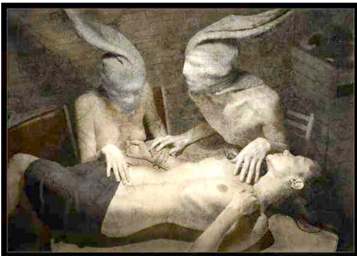
FIGURA 1 – Eugene Kozhevnikov – Fotografia – Prisoners of Desire (2006)

Pandora (in memorian) – por mais que o tempo passe, jamais vou esquecer o momento em que nossos olhos se cruzaram, e mesmo no silêncio realizamos um agradecimento mútuo por estarmos juntas em uma situação tão singular, que somente nós duas vivenciamos.