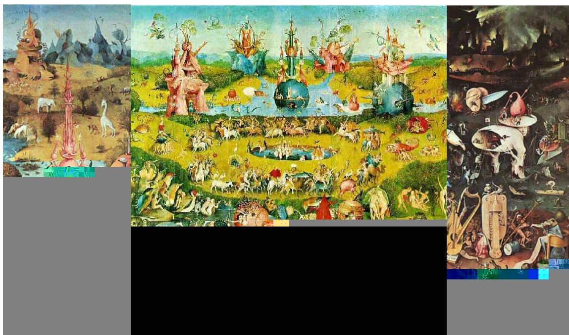
FIGURA 06 – O Jardim das Delícias Terrenas. Hieronymus Bosch (1450-1516)

enquanto o terceiro é uma referência ao Jardim das Delícias (painel central). O todo do painel nos mostra o ideal de conduta, a fragilidade humana, e o inferno a quem ceder os desejos da “carne”, por isso a tela retrata situações de luxúria que envolvem cavalheiros, clero, mendigos, penitentes, masturbadores, homossexuais, estropadores, santos e demônios, tudo envolto em figuras grotescas e exóticas.