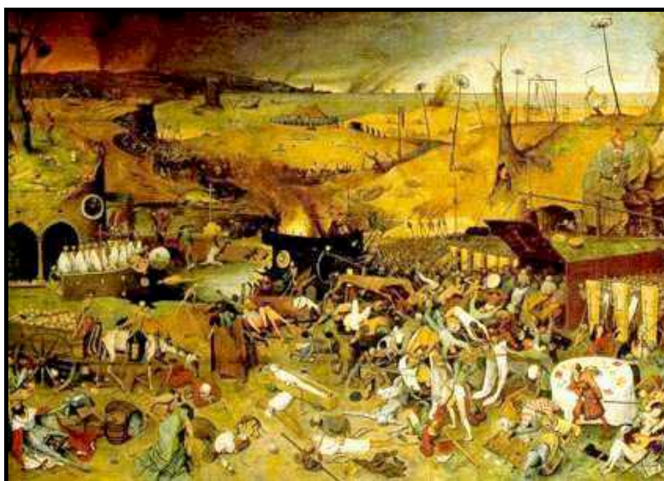
FIGURA 02 – Pintor Belga Peter Bruegel – Triunfo da Morte (1562)