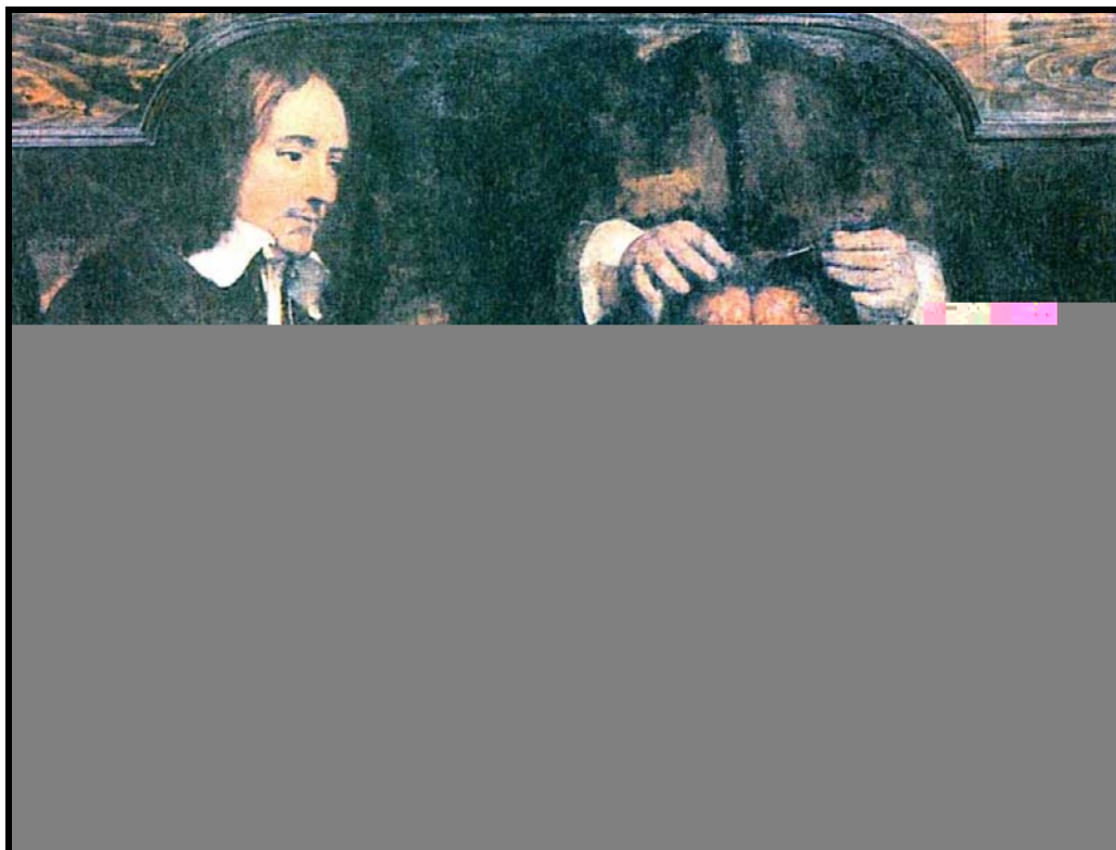
FIGURA 03 - Rembrandt – Aula de Anatomia do Dr. Deyman (1656)

O quadro retrata claramente: quem o realiza ainda corria o risco de ser execrado por ter esse ofício. Nesse momento da história do estudo do corpo, esse ofício estava parcialmente aceito; nem sempre foi assim, e talvez a imagem parcial mostre reminiscências de temores advindos do clero devido a editos de proibições nessa área do conhecimento. Essas proibições ficam estabelecidas quando o Papa Bonifácio I (século XIV), através do edito, proíbe as dissecações de cadáveres em nome da “dignidade humana”, mas poderia ocorrer a autópsia, o embalsamento e a vivissecação de animais – mas furtivamente para estudos e correndo riscos exumava-se cadáveres roubados de cemitérios ou os corpos condenados à forca que, descidos do cadafalso, eram direcionados para a mesa de estudos. Ocorrem inclusive registros de casos de vivissecação de condenados à morte: era o poder do saber sobre o corpo vivo, tanto no poder médico como no poder do clero, que não descuidava do governo da alma, do poder sobre os corpos.