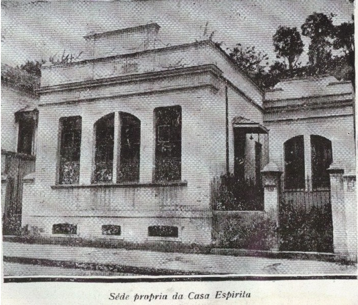
(Sede da Casa Espírita)