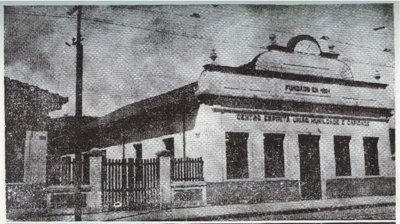
Séde propria do Centro Espírita União, Humildade e Caridade

(Sede do Primeiro Centro da cidade de Juiz de Fora, fundado em 1905: Centro Espírita União, Humildade e Caridade)