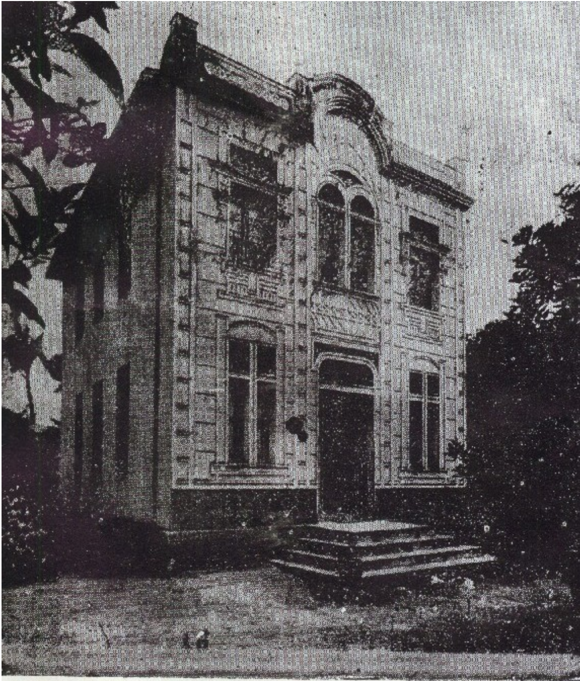
Séde própria do Instituto Eugenia Braga

(Sede do Instituto Eugênia Braga, administrada pela Casa Espírita)