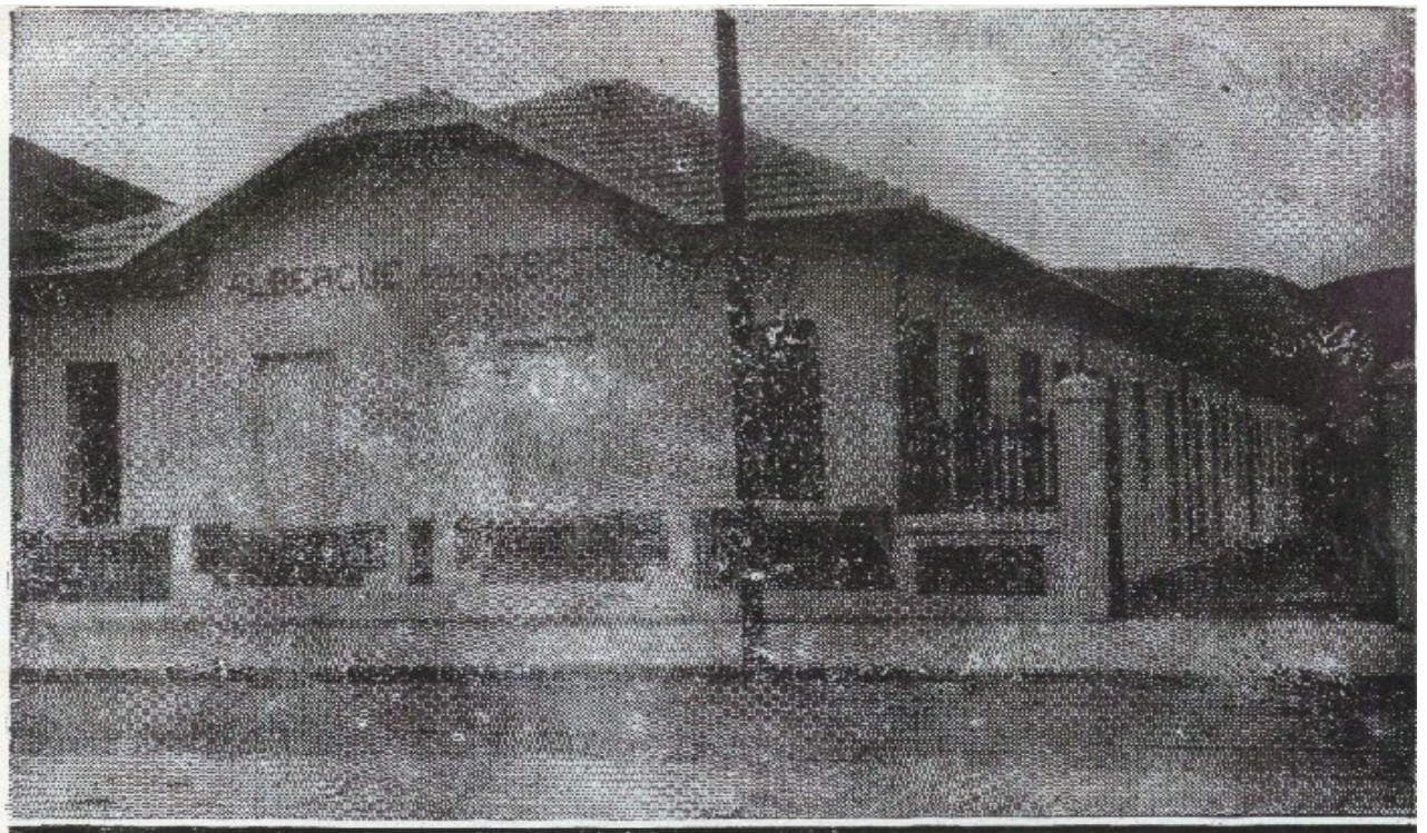
Séde propria do Albergue dos Pobres

(Sede do Primeiro Centro da cidade de Juiz de Fora, fundado em 1905: Centro Espírita União, Humildade e Caridade)