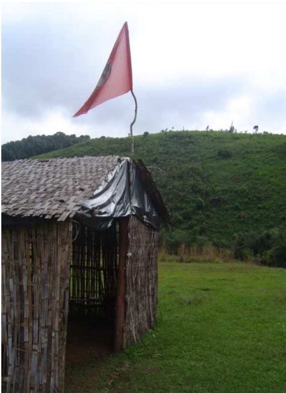
Figura 2: Acampamento Índio Galdino II, situado no município de Curitibaanos