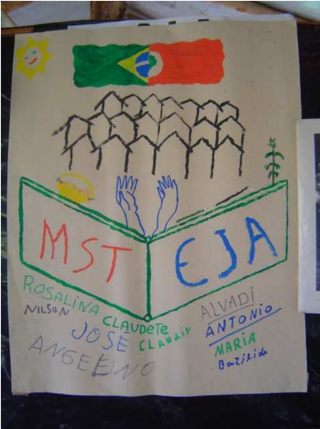
Figura 4: Acampamento Índio Galdino, situado no município de Frei Rogério; Crédito: Rodrigo José Antônio Beltrame;