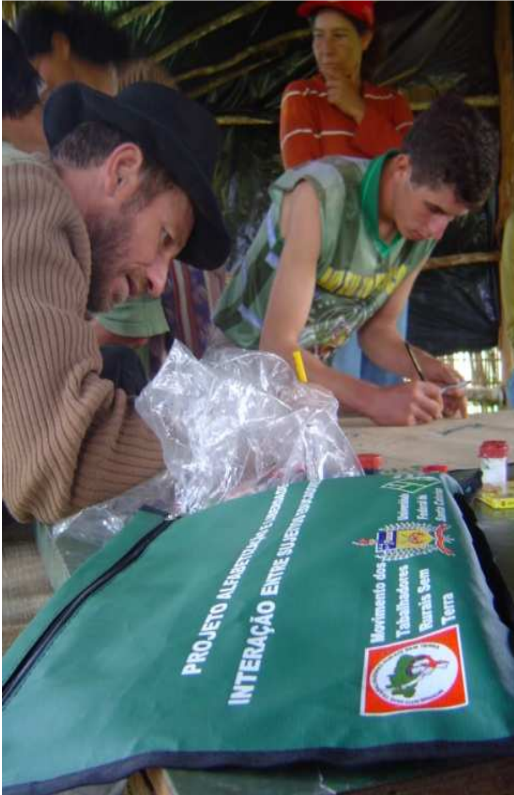
Figura 1: Acampamento Índio Galdino II, situado no município de Curitibaanos