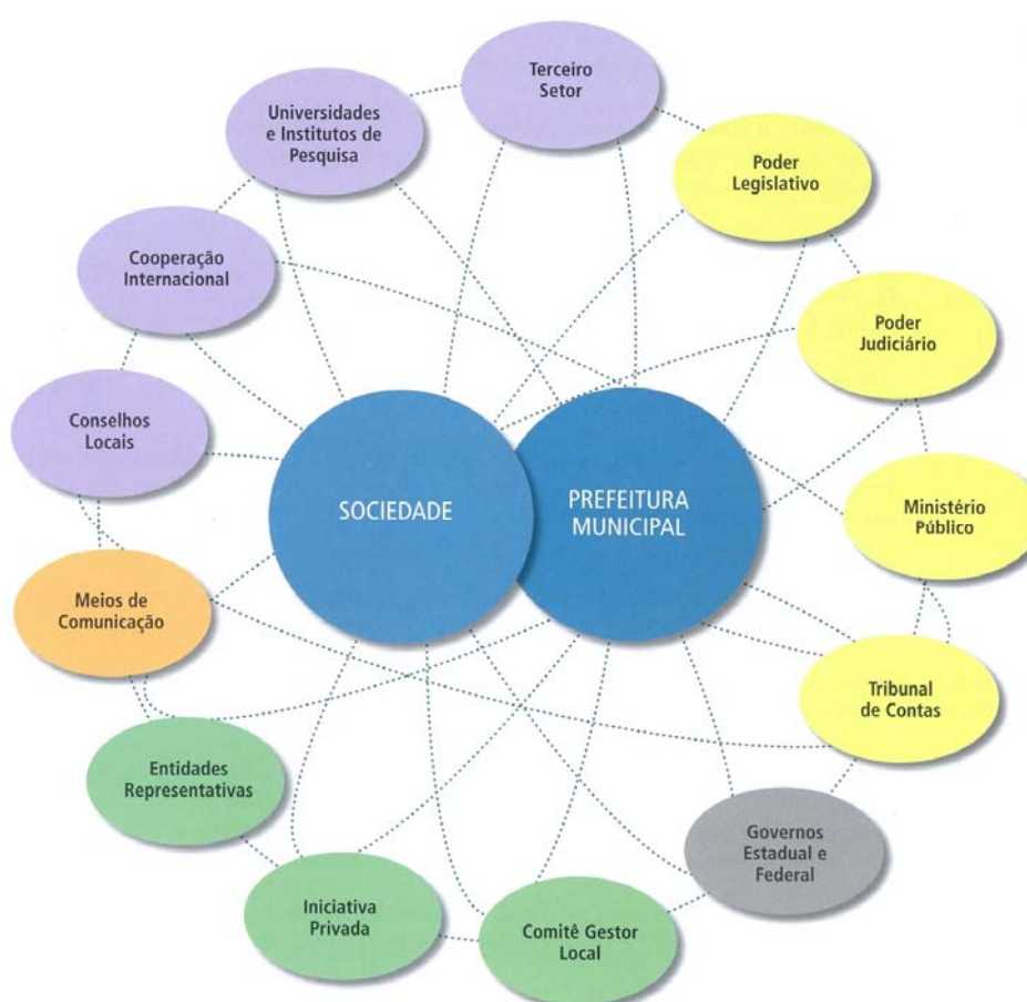
FIGURA 2: PARCEIROS ESTRATÉGICOS DO MODELO DE GESTÃO DA PMPA

criando “esferas de relacionamento” entre os “públicos de interesse” para a execução das estratégias do governo (figura 2).