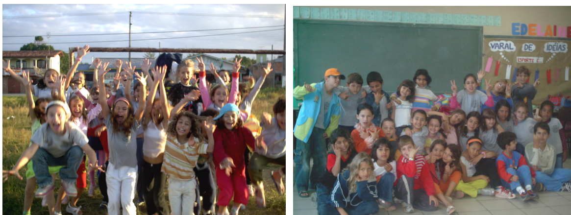
Foto 2 e 3: Crianças/sujeitos da pesquisa em março e setembro de 2006

A partir de dados obtidos junto aos alunos e seus respectivos responsáveis (através de questionário 16 ), podemos traçar algumas características deste grupo composto por 29 alunos, sendo 18 meninas e 11 meninos, com idades entre 7 e 9 anos (média: 8 anos de idade).