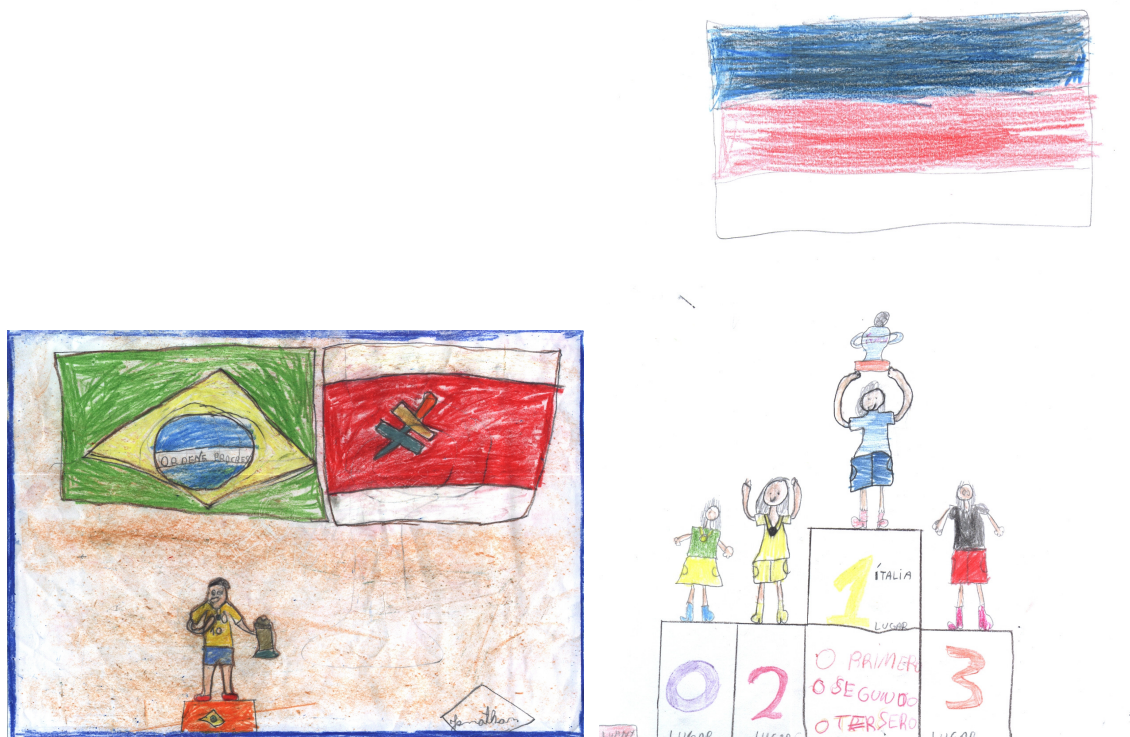
Desenhos 3 e 4: Competitividade (vitória/derrota) – antes e depois da Copa.

mesmo que a qualquer preço, e a frustração da derrota injustificável, sinalizam questões importantes que o esporte propaga e que precisam ser refletidas no âmbito da Educação Física escolar. Assim, julga-se o evento a partir do resultado que ele teve para a seleção brasileira, como escreveu uma aluna junto a um desenho de boneco chorando com a bandeira do Brasil: “ Buá, o Brasil perdeu não gostei desta Copa ”. Junto com esta perspectiva os alunos trazem informações sobre seus adversários que, em clima de rivalidade, são expressadas antes do evento, sendo a rivalidade com os anfitriões Alemães a mais presente.