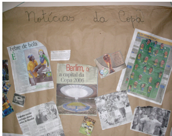
Foto 7: Painel da turma investigada feito pela professora de sala com os alunos.

Um fato que nos chamou atenção foi que, em meio às conversas espontâneas dos alunos, a preocupação/expectativa com a Festa Junina da escola, e o ensaio da Quadrilha da turma, tomava também grande destaque e interesse dos mesmos naquele momento. Momento este, como bem demonstrou a escola ao pendurar bandeirinhas juninas em verde e amarelo, era palco de uma hibridização simbólica que expressava dois momentos comemorativos da nossa cultura: Festa Junina e Copa do Mundo de Futebol.