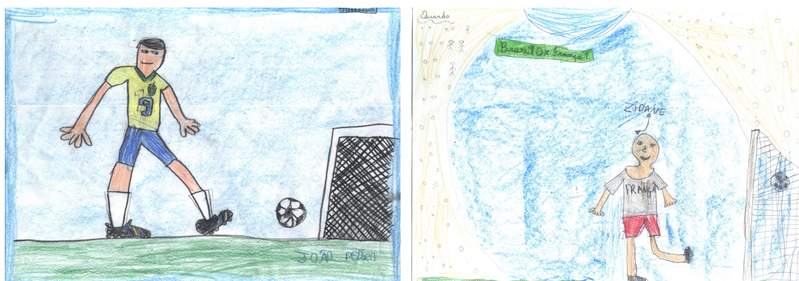
Desenhos 5 e 6: Exaltação do Ídolo (individualismo) – antes e depois da Copa

a mensagem subrepticamente veiculada neste discurso funciona como confirmação do modelo social hegemônico, apresentando como justo e aberto à mobilidade no interior de suas classes para quem tem competência para tanto, servindo também para promover o conformismo enquanto falso parâmetro para aqueles que não conseguem.” (p. 64)