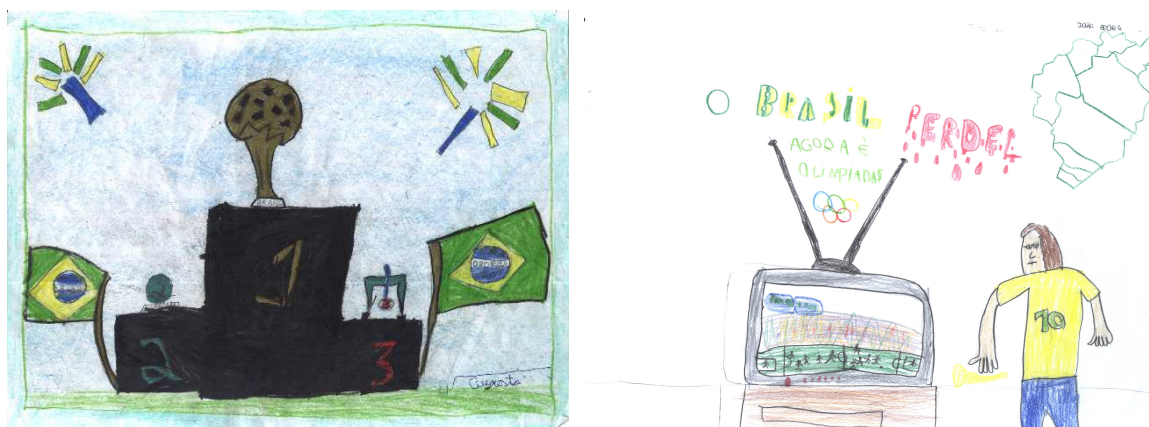
Desenhos 1 e 2: Nacionalismo/Patriotismo – antes e depois da Copa.

Celebração do nacionalismo/patriotismo = Ao observarmos o conjunto dos desenhos podemos perceber que o sentimento de patriotismo/nacionalismo é o elemento mais presente através de alguns suportes e expressões simbólicas como, a bandeira, a camisa da seleção, e as cores verde e amarelo. Um elemento importante dentro das discussões sobre nação e pátria está no plano da identidade nacional, que conjuntamente com outras identidades culturais fazem parte do processo dialético de socialização/subjetivação do ser humano. Nos dias de hoje não podemos pensar que a identidade nacional se sobressai frente às outras, porém existem momentos, como os grandes eventos esportivos, em que observamos que a atribuição de significados à símbolos e suportes de celebração do nacionalismo ganham destaque diferenciado que nos remetem ao sentimento de pertencer a nação/pátria. Neste sentido podemos verificar que a Copa do Mundo de Futebol representa um momento das crianças/alunos exercerem a sua identidade nacional, congregando todos, até mesmo àqueles que não gostam de esportes/futebol, em uma unidade representativa que se identifica e assiste o evento em questão. Cabe ainda destacar que, mesmo após a derrota da seleção Brasileira na Copa, os desenhos traziam (em menor proporção) a celebração deste nacionalismo/patriotismo, que em um caso já projetava expectativas para as Olimpíadas através do símbolo dos anéis e a frase: “O Brasil perdeu. Agora é Olimpíadas”