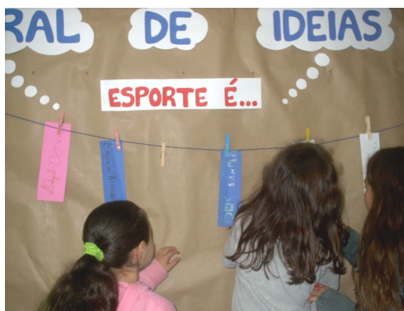
Foto 14 e 15: Estratégia Didática - Varal de Idéias: esporte é...

Na conversa com os alunos podemos perceber que a grande maioria concordou com o conjunto de respostas da turma e identifica no esporte as idéias constituintes do varal. Todos afirmaram gostar muito de esporte e achá-lo legal/divertido, pois estabelecem com ele uma relação de brincadeira, ou seja, as crianças brincam de esportes. Ainda perceberam que nem sempre esporte é uma brincadeira, podendo ser uma profissão ou “ algo sério ”