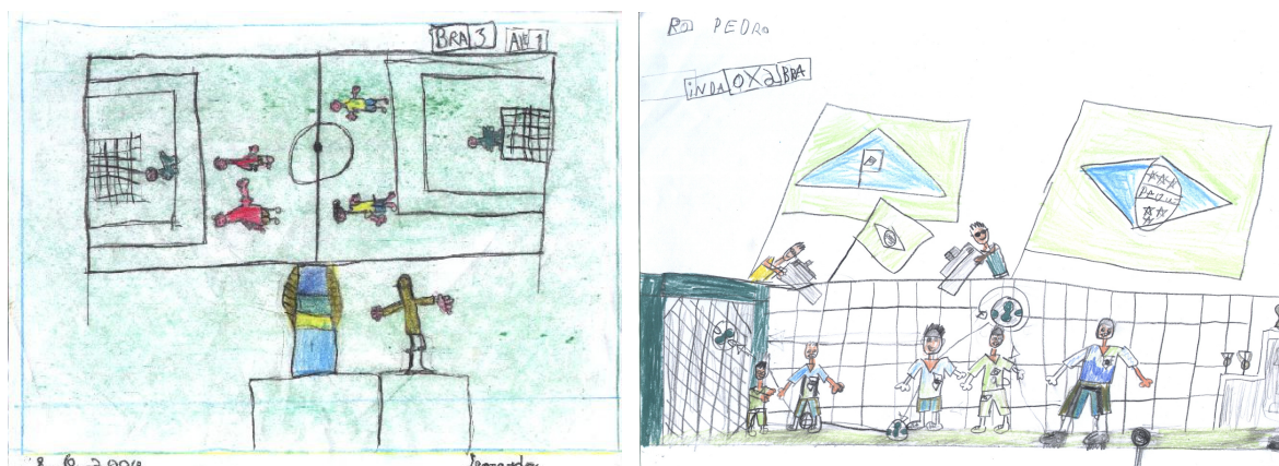
Desenhos 7 e 8: Espectacularização Esportiva – antes e depois da Copa.

um grande evento esportivo, em que alguns elementos compõem esta criação, como: a mediação efetuada pela TV, ou seja, a Copa chega até nós através deste meio de comunicação; o cenário é construído em estádios com muitos torcedores e arquibancadas; os ídolos fazem belas jogadas que culminam com o gol; e para finalizar existe a premiação aos vencedores, podendo ser o troféu o Oscar. Sobre este fato, de em alguns desenhos o troféu ser representado pela estatueta do Oscar americano, acreditamos que isso pode ser em virtude da Copa representar no imaginário infantil um espetáculo em que “celebridades” serão premiadas, e ainda devido ao fato de que aspectos da cultura norte-americana foram mundializados pela mídia, e fazem parte de muitos desenhos infantis assistido pelas crianças.