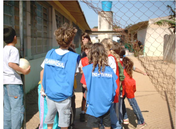
Foto 22 e 23: Bastidores da Copa da Turma - Câmera e preparação para entrar na quadra.