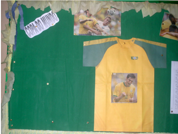
Foto 4: Mural de entrada da escola, organizado pelas auxiliares de ensino.