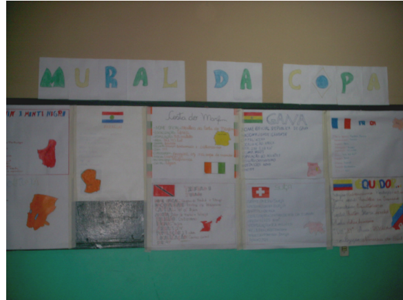
Foto 5: Trabalhos sobre a Copa, de outras turmas, expostos no pátio.