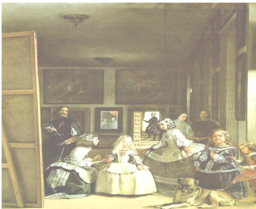
Figura 2 - Pintura barroca de 1656 - Las Meninas de Velázquez - óleo sobre tela 3.18 x 2.76 m – Diego Velázquez 18 – 1599-1660 – Museu do Prado – Madri.

Fonte: Disponível em: < www.camilomarcelino.com/personagens/asmeninas- >. Acesso em: 20/04/2007.