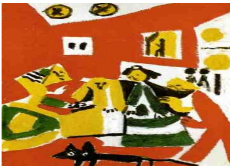
Figura 3 - Releitura de Las Meninas de Velázquez , de Plabo Picasso.