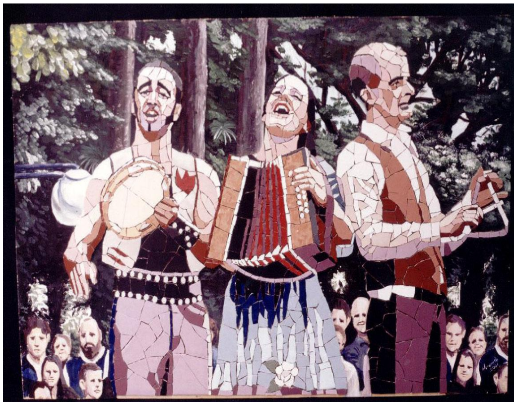
Figura 6 – Os enganadores da morte.