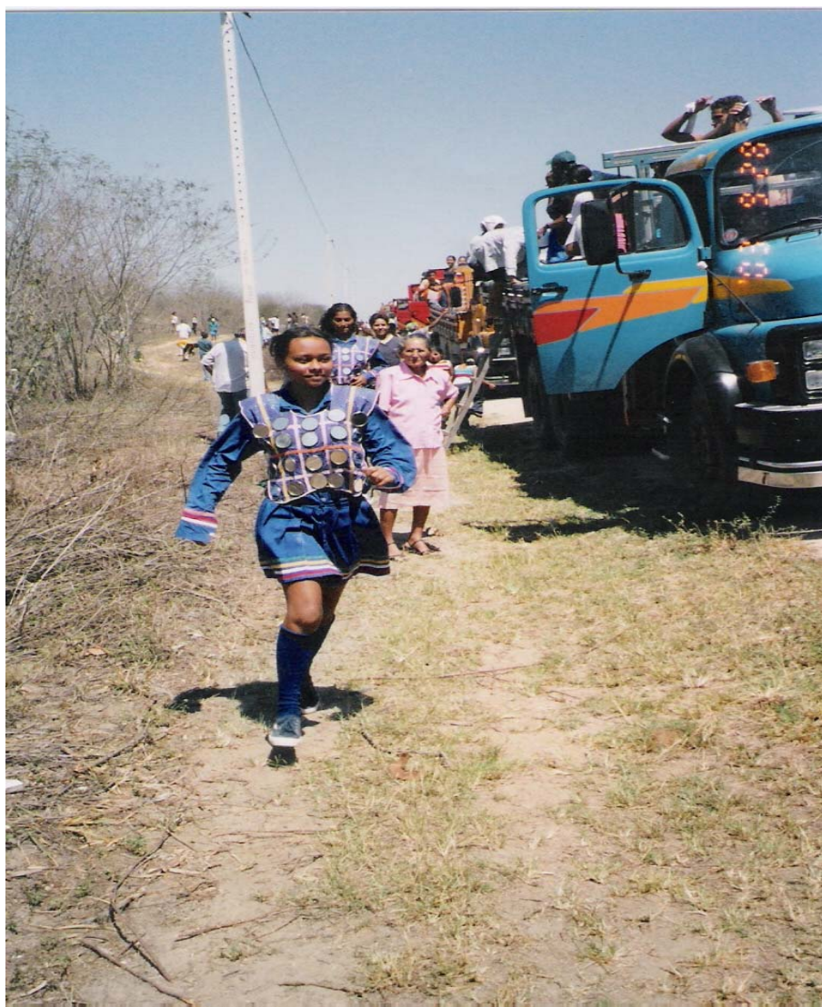
Figura 10 – Durante parada da carreta na estrada, dançarina corre para retornar ao seu lugar no caminhão

Eu acho que ele ficava triste, mas mais triste ia ficar eu, por causa que eu considero muito a família deles, eu vou mais em consideração a ele, porque eu tenho muita consideração por ele, aí eu vou. Faço tudo que ele pedir, sendo nessa festa, o que ele pedir eu faço, tenho todo o prazer de organizar o meu Reisado e acompanhar a carreta dele. (Depoimento concedido à pesquisadora em setembro 2003).