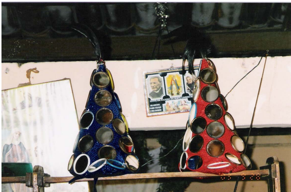
Figura 3 – Chapéus dos mateus expostos na estante da casa do mestre

igreja. Esses últimos, por não deterem adequada organização interna e incentivo da prefeitura, têm mais dificuldades para se apresentar do que o Reisado Senhor do Bonfim, e em algumas situações já aconteceram desentendimentos entre eles.