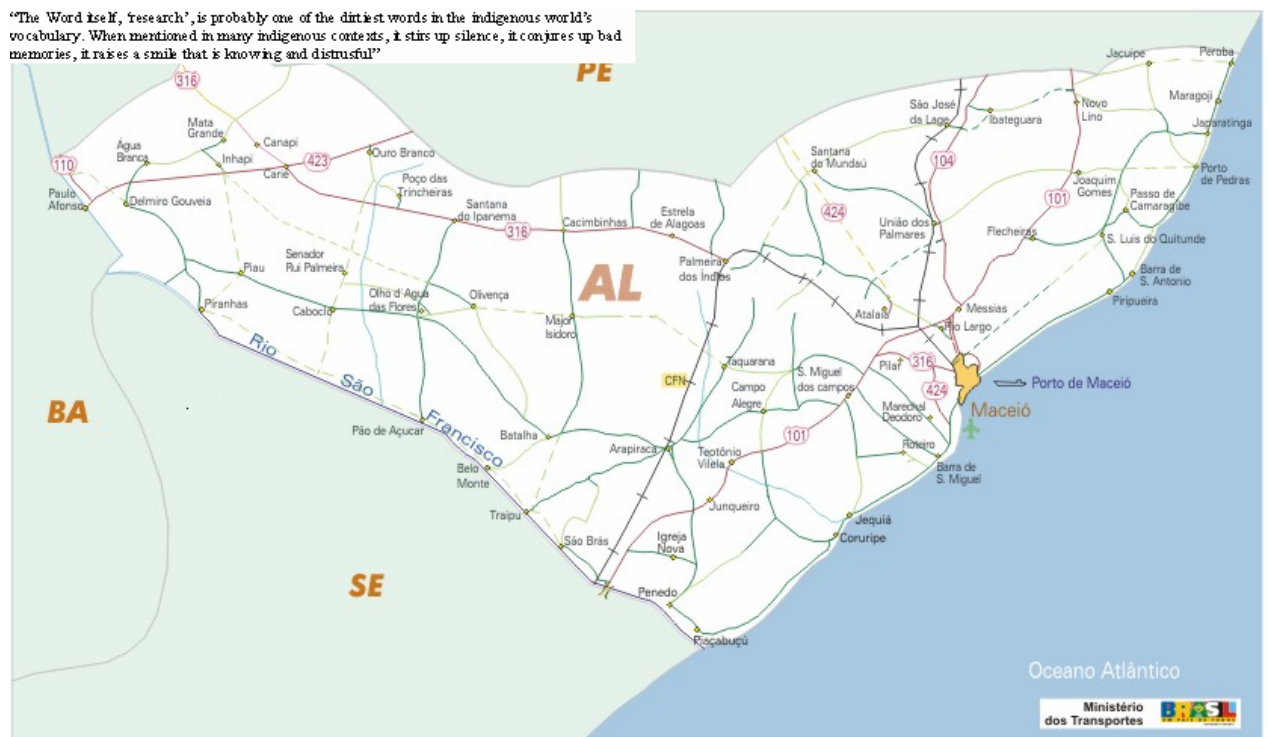
Figura 4 – Mapa do estado de Alagoas

A seguir, estão exibidos dois diferentes mapas do estado de Alagoas, numa tentativa de dimensionar o espaço geográfico que diz respeito ao lócus da pesquisa.