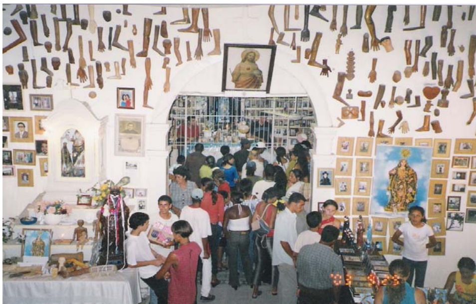
Figura 11 – Panorâmica do interior da casa sagrada, em Frencheiras