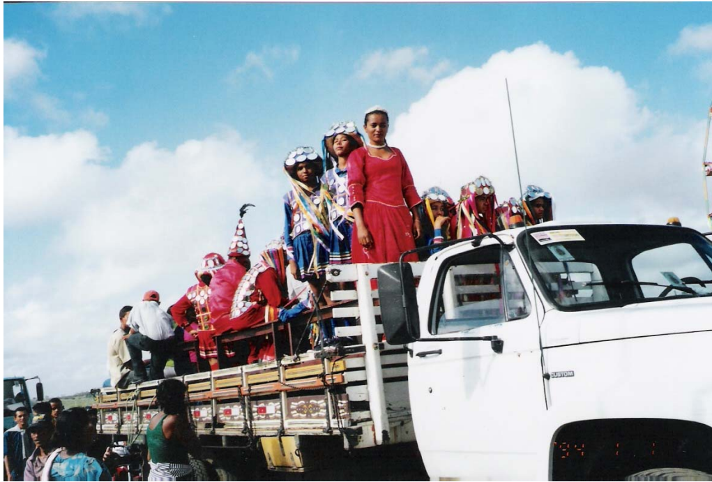
Figura 8 – Reiseiros e dançarinas na carroceria do caminhão rumo a Frencheiras