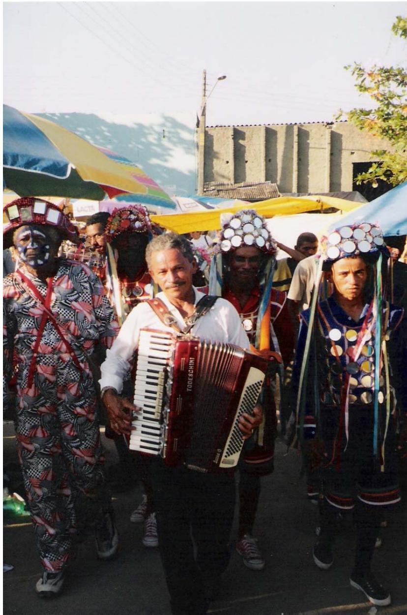
Figura 13 – Ala da frente abre caminho para os reiseiros e dançarinas em Frencheiras