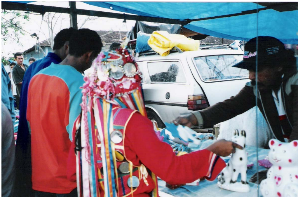
Figura 9 – Dançarina compra artigos na feira popular de Frencheiras