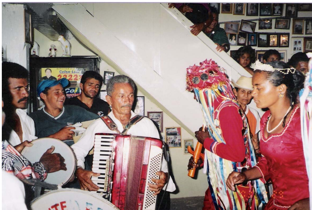
Figura 2 – Tambor, pandeiro e sanfona, nas mãos dos tocadores, dão o tom musical ao grupo, que se apresenta no interior da casa sagrada em Frencheiras