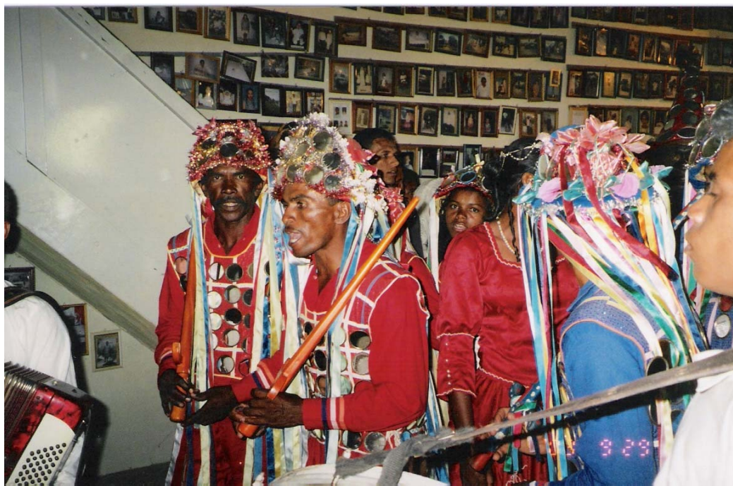
Figura 1 – Reisado Senhor do Bonfim sob o comando do mestre