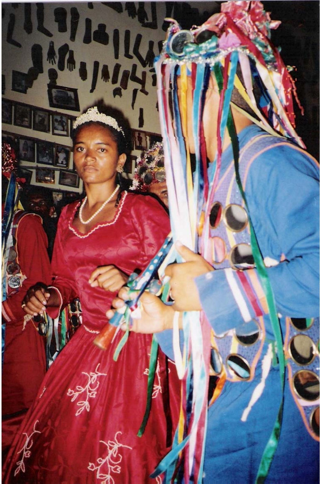
Figura 12 – Rainha e embaixador durante apresentação na casa sagrada em Frencheiras