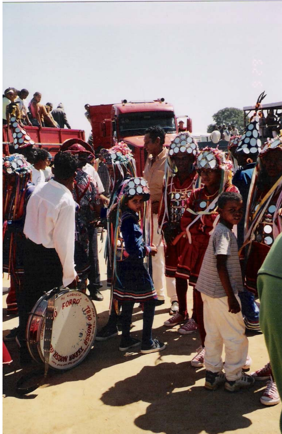
Figura 6 – Reisado Senhor do Bonfim desembarca em Frencheiras