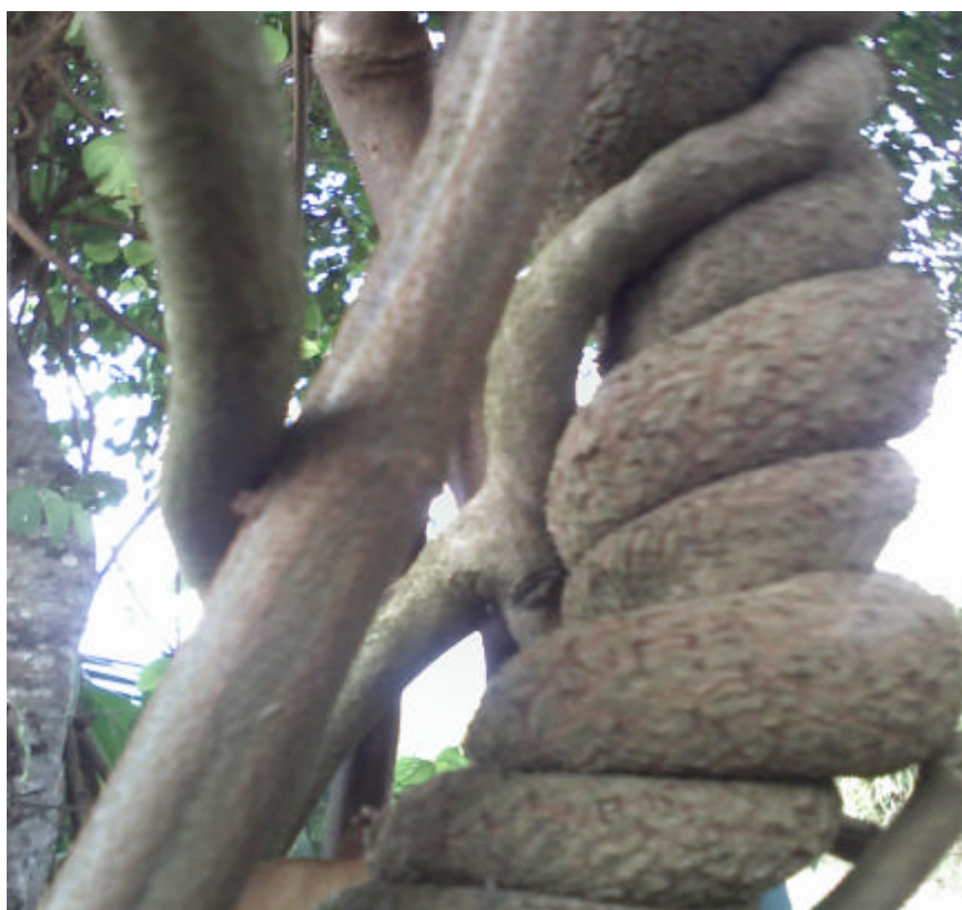
Marirí (Denominado Tucunacá pelos adeptos da UDV).