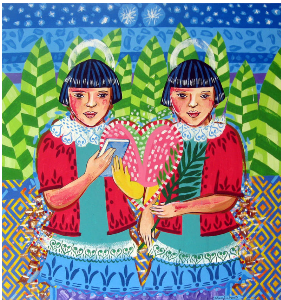
Cosme e Damião. Tela do artista plástico Chico Liberato.