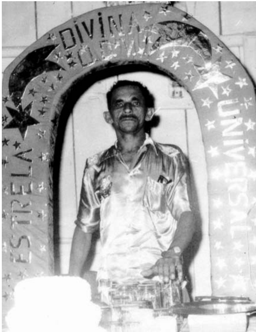
Mestre Gabriel no arco. Foto utilizada nos templos da União do Vegetal.

Existe um lugar destinado ao som e ao operador, que pode ser qualquer discípulo. O local onde acontecem as sessões é bem iluminado. Durante todo o ritual as luzes permanecem acesas. Próximo ao local das sessões existe uma mesa menor, com um recipiente com água potável ou mineral, e copos que podem ser de vidro, alumínio, inox ou plástico. Uma vasilha com (“tira gosto”) frutas: caju, laranja e maçã são as mais comuns, ou chicletes e balas. Essa disposição da arrumação varia de acordo com as unidades administrativas. Em alguns locais não existem vasilhas com “tira gosto”. O material dos copos também pode variar.