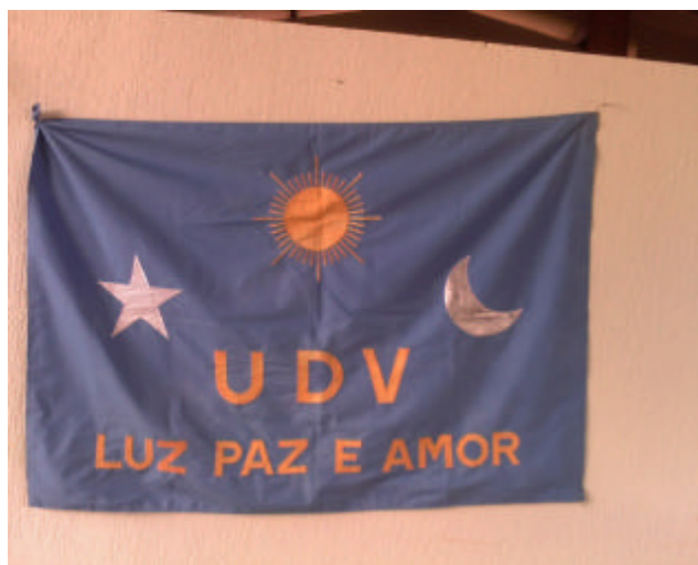
Bandeira da União do Vegetal.

outros reafirmando em comum seus sentimentos comuns. Os rituais são formas de expressão onde os sentimentos coletivos são revividos e solidificados no interior dos indivíduos e essa interação se dá principalmente através dos símbolos. Os símbolos exprimem a unidade social sobre uma forma material. Um exemplo disso é o uso de uniforme pelos adeptos da UDV. Usar o uniforme transmite para os sócios um sentimento de pertença, de solidariedade grupal, uma forma de se sentir como parte de uma unidade social. Os símbolos presente nos rituais da sessão da UDV como a foto do M. Gabriel, as chamadas, as músicas, o uniforme, a bandeira 18 , (com o símbolo da lua, estrela e o sol) e o hino da UDV reportam á idéias centrais da religião.