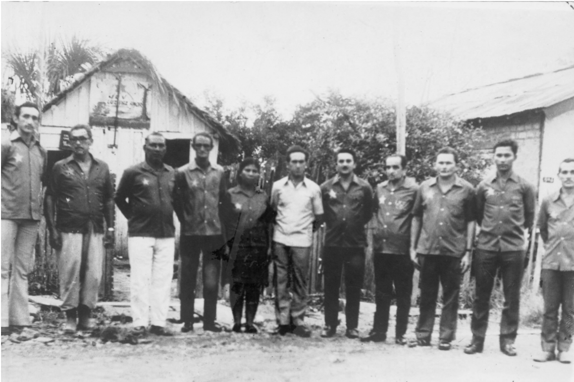
Quadro de mestres em frente à antiga sede. Década de sessenta, em Porto Velho (RO). Direito de imagens cedido pelo Departamento de Memória do CEBUDV. Foto: Cícero Lopes.