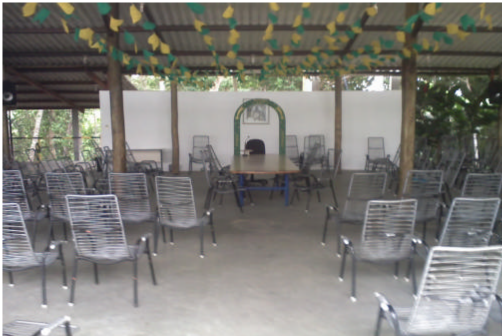
Núcleo Estrela da Manhã.