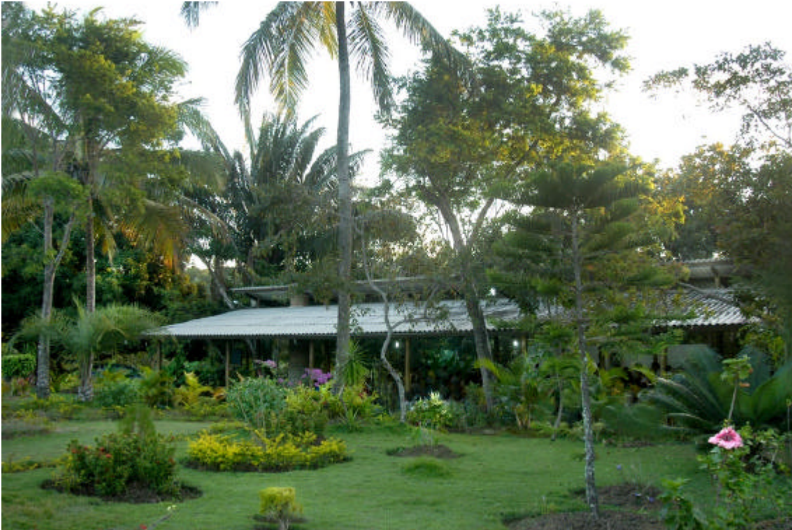
Núcleo Estrela da Manhã.