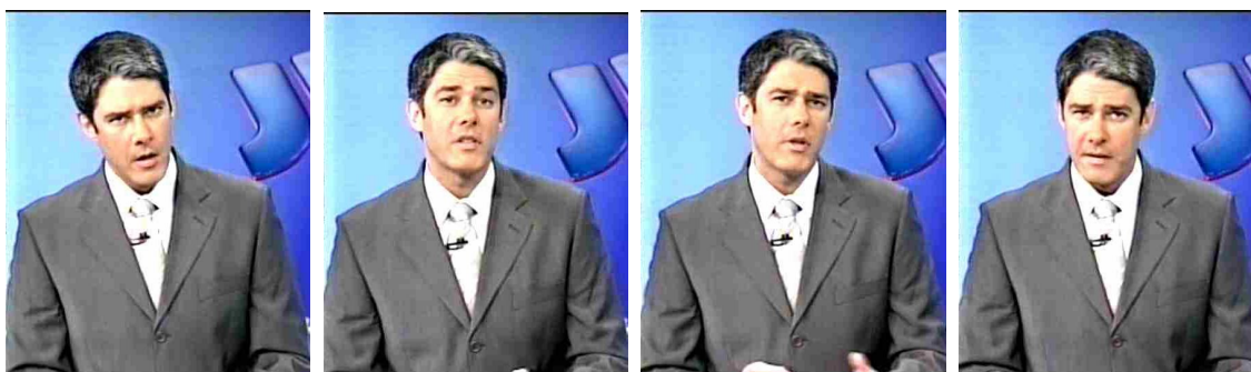
Figura 26: Hardnews : editoria mais freqüente entre as notas de locutor

Um dado, porém, a fez integrar esse tópico do trabalho, relacionado aos produtos com destacado tratamento subjetivo das informações: na construção deste texto audiovisual, apesar dos dados verbais apoiados em empirismos, as expressões faciais e entonações feitas nas falas emitidas pela personagem do apresentador dão pistas sobre o tom da construção discursiva a partir dos dados. E pelo contrato estabelecido a partir do dispositivo que instaura, além das práticas enunciativas, também as de leitura, observamos o condicionamento da interpretação, de modo a movimentar os valores relacionados à raiva e indignação, ao mesmo tempo em que é incitado o sentimento de pena: