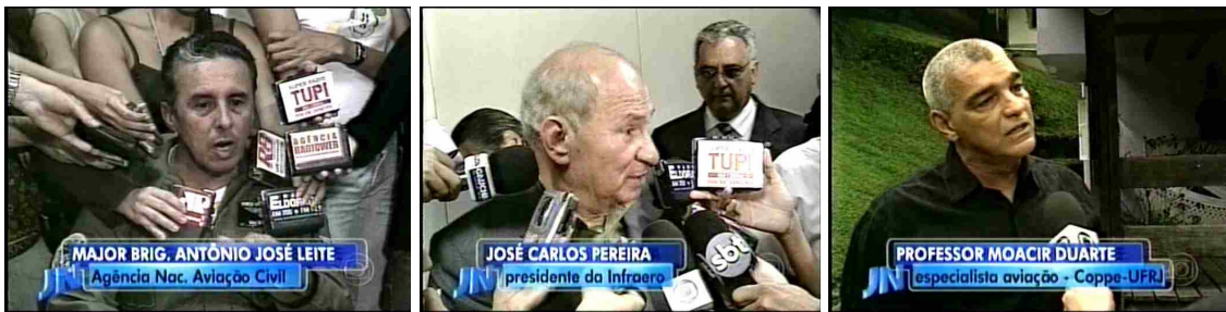
Figura 21: Fontes oficiais colaborando para a o efeito de afastamento nos âmbitos verbal e icônico

Nessa extensa cobertura do acidente com o avião da Gol, destaca-se ainda o uso exaustivo de fontes, que – além de citadas – são codificadas também na linguagem visual. Nessa atribuição de dados a terceiros, cruzam-se diversos campos do saber humano, desde a fonte oficial, representante técnica ou burocrática dos órgãos envolvidos na trama, passando pelo especialista na área de aviação (fig. 21 , logo a seguir), até aquela fonte que simplesmente viu o ocorrido relatado na narrativa, aquela voz que acaba não acrescentando qualquer dado informativo à história, ou mesmo aquelas fontes que sequer manifestam-se verbalmente, mas entram como dado ilustrativo e justificativa, no contexto da edição, para a superexploração do tema em Jornal Nacional (como vemos na fig. 22, adiante).