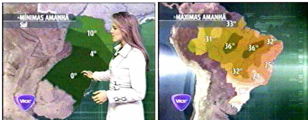
Figura 14 (cont.): Previsão do tempo: o mais freqüente entre os indicadores em Jornal da Band

Mariana Ferrão: (...) aqui, entre o sudeste, o centro-oeste e o sul do País, são áreas de instabilidade que mantêm o tempo encoberto. E no norte, a chamada zona de convergência intertropical também gera nuvens carregadas, por isso essa noite será molhada em boa parte do Brasil. Vai chover e ventar mais forte ao sul da Bahia, região de Porto Seguro. No sudeste, a previsão de chuva é para as capitais paulista e fluminense, e pancadas de chuva também vão atingir Boa Vista, capital de Roraima. No sul, a massa de ar polar deixa as temperaturas lá embaixo. Vai fazer zero grau em boa parte do Rio Grande do Sul e há previsão de geadas. Durante a tarde, o sol até aparece nas áreas claras, mas mesmo assim, a máxima não passa dos 17 graus na região sul. Nos próximos dias, há previsão de bastante chuva entre o litoral do Paraná e o litoral sul de São Paulo. No Rio, a agitação marítima começa a diminuir, mas ainda há risco de ressaca no litoral sul do estado, com ondas de até três metros de altura. Nas capitais fluminense e capixaba vai fazer calor amanhã. Máximas entre 28 e 29 graus. Já na Mineira, a temperatura não passa dos 26, e na paulista, dos 20. No sul da Bahia continua chovendo e fica mais friozinho. Máxima de 25 graus em Salvador. No interior do Piauí, do Maranhão e na maior parte do norte do País, o calorão continua. Nas áreas avermelhadas do mapa, as temperaturas chegam a 36 graus (...)