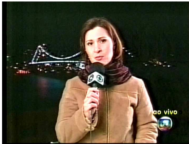
Figura 2: o ao vivo e a ilusão de co-temporalidade

Além da insistente ênfase dada ao efeito de transmissão “em direto”, por meio de referências verbais como “ao vivo” – acompanhada da logomarca da Rede Globo sobrescrita da versão iconográfica de “ao vivo” – torna-se evidente o recurso a marcadores de tempo presente, tais como “voltamos a falar”, “hoje”, “vamos agora”, “boa noite”. Este último elemento, junto à representação do céu escurecido em plano aberto ao fundo, alcança o objetivo discursivo de significar a situação “noite”, ou seja o tempo concomitante com a transmissão do referido telejornal, que se dá à noite costumeiramente.