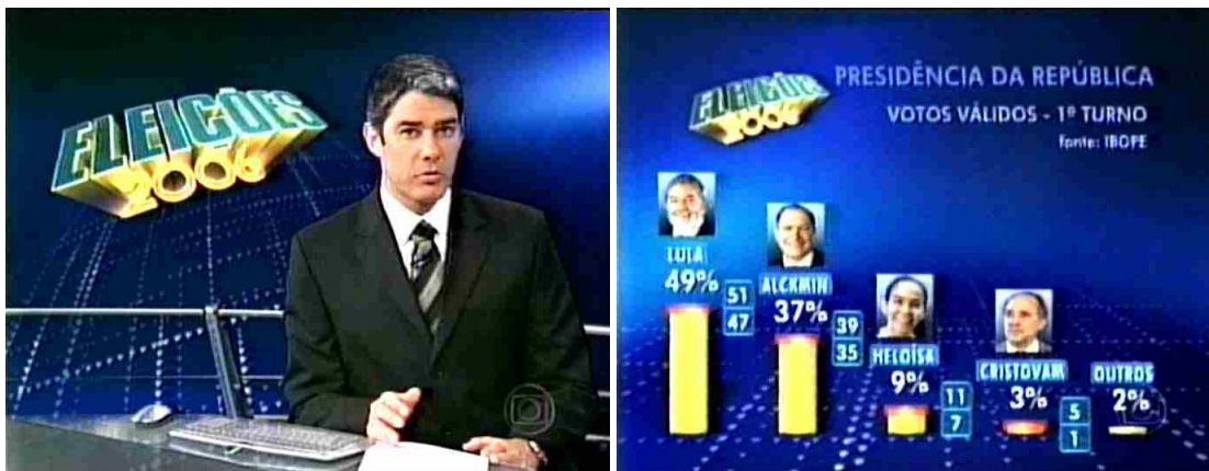
Figura 18: Editoria de política concentra os indicadores mais frequentes em Jornal Nacional