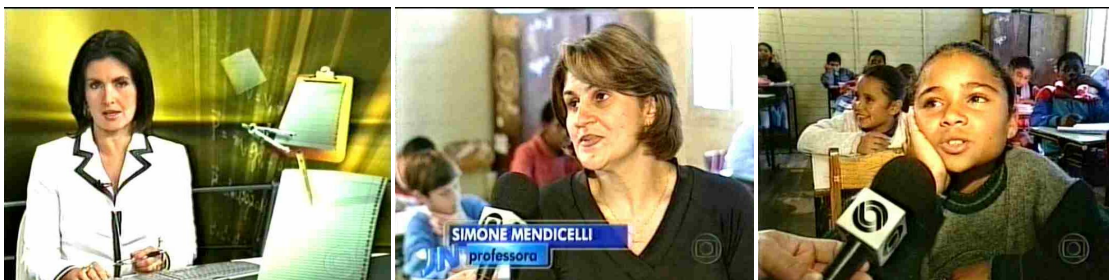
Figura 13: Seqüência de elementos e personagens que indicam e testemunham uma história de violência