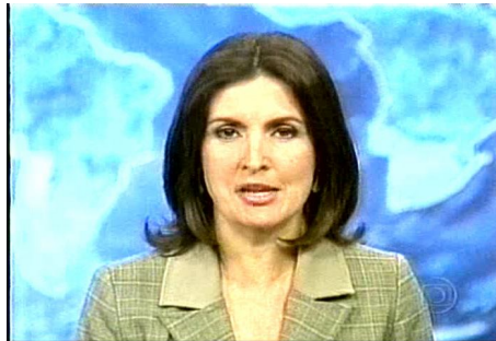
Figura 9: Fátima Bernardes em plano médio fechado

Em Jornal Nacional, são longas as cabeças das reportagens, assim como as notas de locutor. Esses elementos constituem boa parte do tempo total da edição e parecem concentrar a atenção na imagem das personagens dos apresentadores.