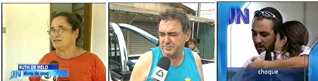
Figura 22: As fontes não-oficiais, informativas ou não, e as que – somente em aparecer – são elementos na trama

E em se falando em texto icônico, é acentuado o contraste entre as vestes das fontes oficiais acima e as do homem sem nome no centro da seqüência abaixo. Um terno, uma farda ou uma camisa escura de manga longa movimentam – na mais ampla gama de comunidades discursivas – os temas da austeridade e rigorismo, principalmente se comparados a uma camiseta regata, veste da personagem do homem sem nome.