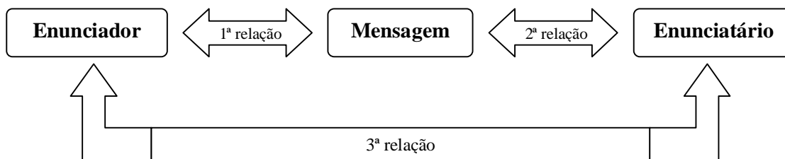
Figura 1: Uma representação para a relação enunciativa

De modo esquemático, pode-se dizer que relação enunciativa entre a instância produtora, o texto (mensagem) e a instância receptora é representada pela figura 1, a seguir: