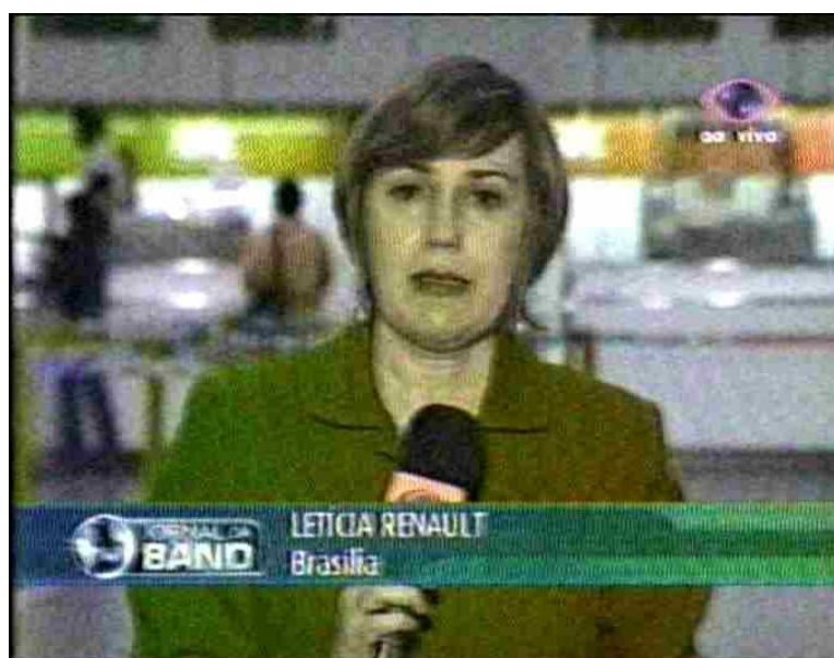
Figura 10: Hardnews : editoria mais freqüente para a nota de locutor em Jornal da Band