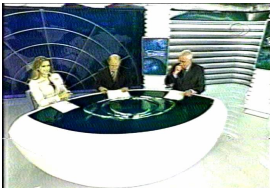
Figura 8: O plongée da abertura de Jornal da Band

Na figura 8, a seguir, Jornal da Band é apresentado como uma entidade onipresente. Os apresentadores são enfatizados na condição de personagens, partes do jogo da enunciação. “Está no ar o Jornal da Band”, texto verbal que abre a edição, funciona como uma voz superior às dessas personagens: