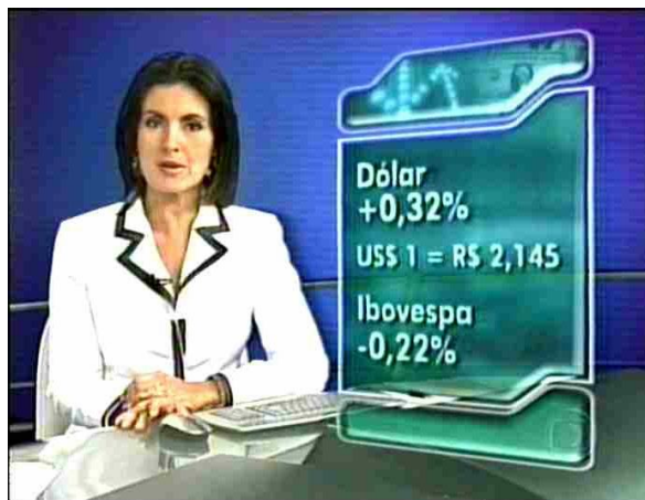
Figura 17: O valor monetário do dólar e das variações de uma das bolsas de valores brasileiras

Novamente – apesar de serem aludidos números, que são forçosamente associados à idéia de exatidão e de certeza – a representação visual dos dados parece ser a opção para que a informação angarie mais credibilidade. Com essa forma de representação, a matemática é ainda mais evocada, já que são utilizados inclusive o sinal representativo da operação de adição (“+”), para indicar o acréscimo no valor do dólar, o sinal de igualdade(“=”), para demonstrar a comparação entre as moedas norte-americana e brasileira, além do sinal de subtração (“-”), para indicar a queda da bolsa de valores Ibovespa. Além desses recursos, ao infográfico é acrescentada a representação de duas setas, que, significando “para baixo” e “para cima”, ilustram a situação de queda e elevação. Aqui, novamente o sentido pedagógico do infográfico faz com que, no contexto comunicativo, o texto visual praticamente prescindia do texto verbal, que acrescenta diferentes dados referenciais que dizem respeito a informações de um outro campo, o mercado financeiro.