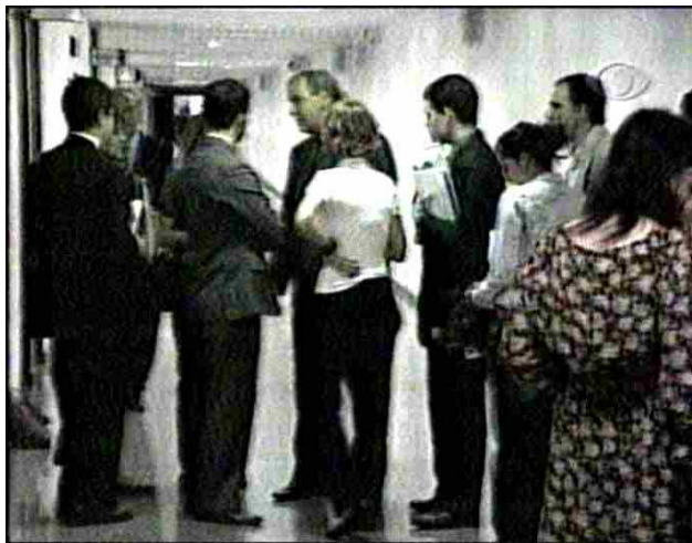
Figura 3: Escalada Jornal da Band / destaque 1

Boechat / destaque 1: CPI dos Sanguessugas garante que tem provas contra 54, dos 90 políticos acusados, e agora vai investigar três Ministérios.