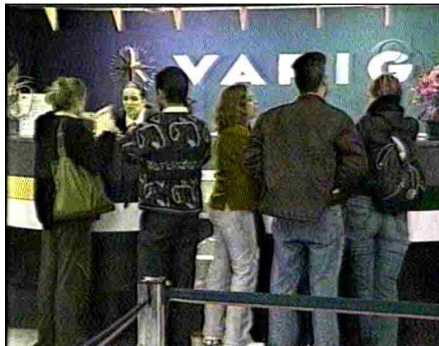
Figura 4: Escalada Jornal da Band / destaque 2

Boechat / destaque 2: Funcionários da Varig conseguem, na Justiça, bloquear 160 milhões de reais para o pagamento de atrasados, e prometem greve para amanhã.