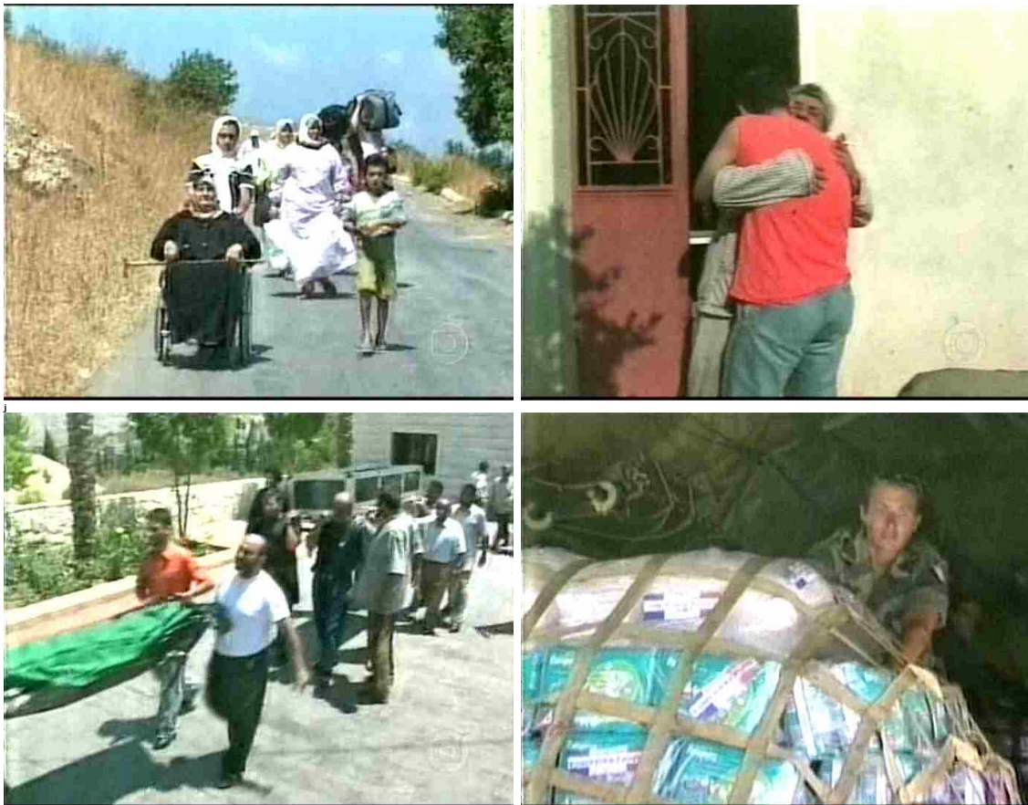
Figura 12: Nota coberta sobre a guerra no Líbano: imagens redundantes em relação o off

Embora no momento raramente atentemos detalhadamente a esses recursos discursivos – até mesmo pela dinamicidade da narrativa televisiva – eles acabam agindo no todo da produção de sentidos. Trata-se de um trecho que movimenta valores de vida e de morte, invariavelmente relacionados a emoções mais intensas em qualquer tempo ou lugar. Abaixo, as imagens que apontam, com redundância, a seqüência narrada em terceira pessoa pela personagem de Mounir Safatli, porém é desse modo que se constrói a isotopia. Nas tomadas a seguir, da esquerda para a direita e de cima para baixo, os quatro sub-temas já mencionados: pessoas que fogem de bombas, o filho que procura o pai, mulher e cinco filhos mortos e as doações que vêm de todo o mundo.