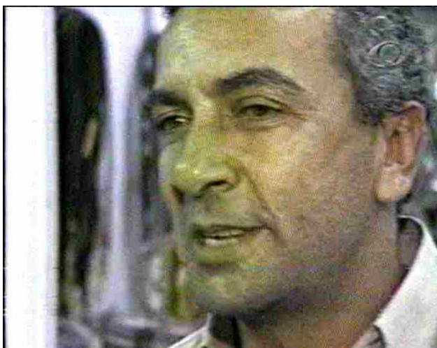
Figura 6: Escalada Jornal da Band / destaque 4

Boechat / destaque 4: E um libanês fugitivo da guerra chega ao Brasil só com a roupa do corpo, e diz que aqui é seu verdadeiro lar.