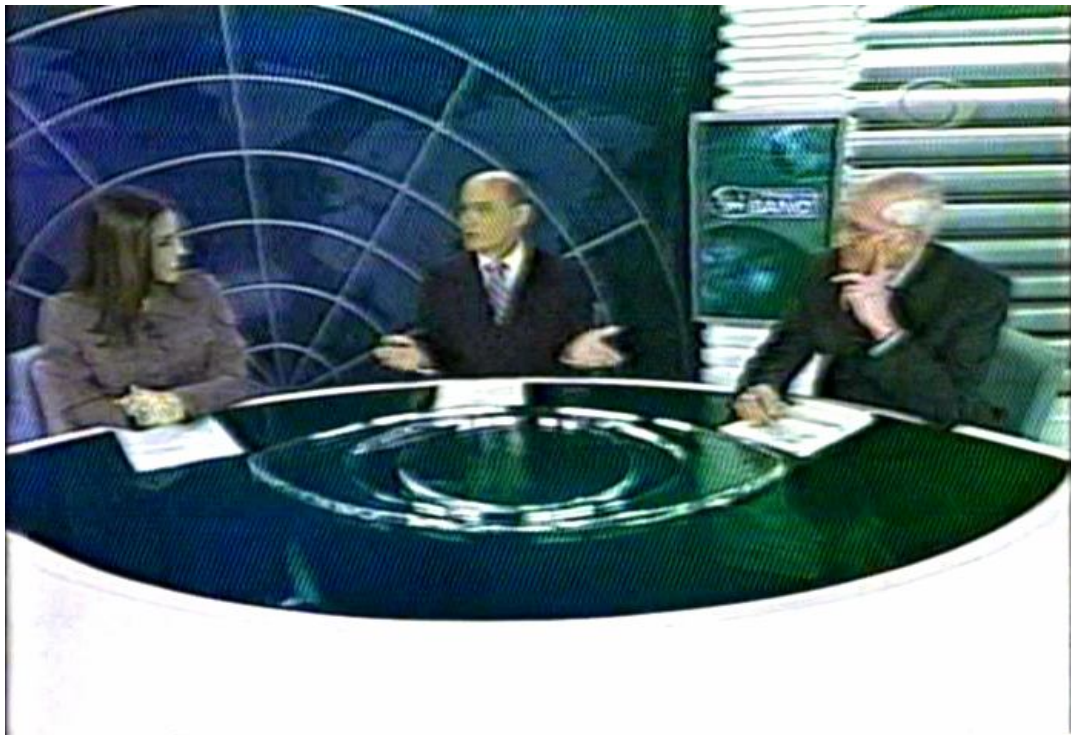
Figura 24: O tom informal do comentário que parece estar “fora do script ”

O próximo trecho de comentário faz uma espécie de avaliação informal da reportagem anterior, que apresenta um livro sobre técnicas de autodefesa para mulheres. É feita alusão a um texto anterior, um episódio esportivo amplamente divulgado: Zidane, famoso jogador da seleção francesa de futebol que, na final da Copa do Mundo de 2006, descontrolou-se e atacou o adversário com uma cabeçada. As personagens dos apresentadores aparecem não mais em close , mas num plano mais aberto, o que confere um tom de descontração ao discurso.