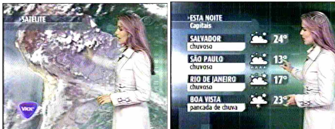
Figura 14: Previsão do tempo: o mais freqüente entre os indicadores em Jornal da Band

Em Jornal da Band, o indicador mais freqüente é o da previsão do tempo. Ao observá-lo, também constatei um amplo recurso a infográficos, mapas e simulações, além de um acentuado uso de cores – das frias às quentes – todos tradicionais efeitos de realidade, expostos na tabela 2 (p. 36). Na figura a seguir, uma compilação da seqüência das principais tomadas da previsão do tempo veiculada na edição de 31/07/06: