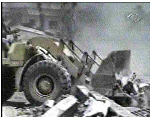
Figura 5: Escalada Jornal da Band / destaque 3

Boechat /destaque 3: Israel não cumpre a trégua depois do bombardeio que matou 37 crianças, e volta a atacar o Líbano.