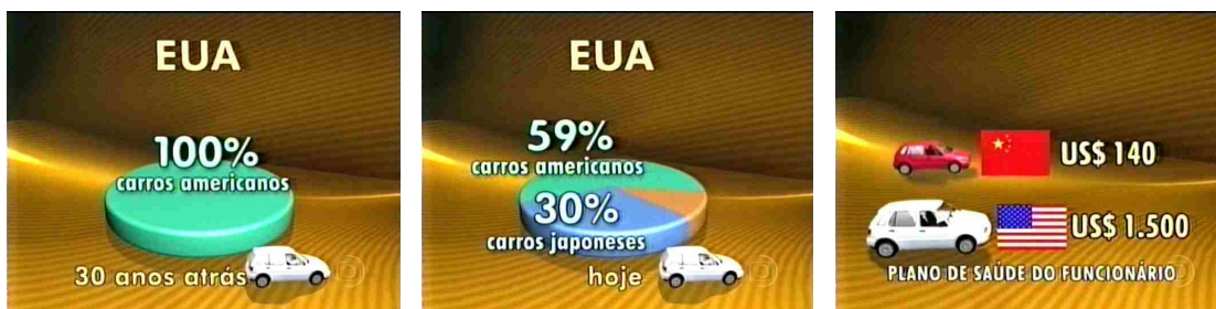
Figura 15: Números em produção e consumo automobilístico

confirma o largo potencial de efeito de realidade contido na idéia de quantificação e contagem, recursos matemáticos como um todo. Vejamos o trecho: