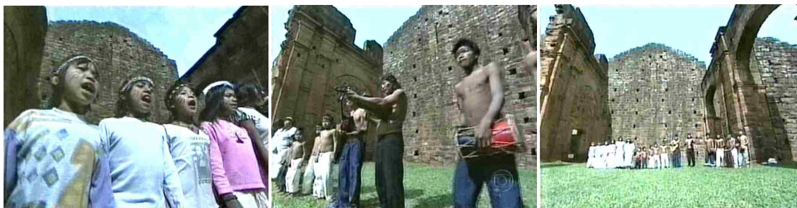
Figura 7: As ruínas de uma “nação perdida”

mesmo que por motivos criados na perspectiva do “homem branco” que faz a reportagem. Vejamos o trecho: