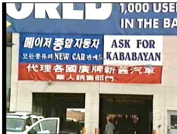
Figura 16: A mostra da coexistência das linguagens no mercado automobilístico americano

Ver e ouvir os dados nessa organização audiovisual permite inclusive a mais fácil memorização do conteúdo, devido a uma espécie de redundância em textos paralelos e de linguagens diferentes, que, no entanto, são de amplo domínio nas mais diversas comunidades discursivas. Fora esses recursos, temos outras referências a dados como substantivos próprios, como “Estados Unidos” e “China” (que inclusive ganham representatividade por meio de pequenos ícones que aludem à bandeira de cada um desses países), “Japão”, “General Motors” e “Ford”, e substantivos comuns, como “quilômetro”, “litro”, “combustível”, “carros”, “americanos”, “preço”, “petróleo”, “motoristas”, “montadoras”, “consumidor”, “gasolina”, “montadoras”, “funcionários”, “fábricas”, “dólares”, além do adjetivo substantivado “japoneses” e da palavra “língua”, que aqui funciona no sentido conotativo para significar “idioma”. Sendo que esses dois últimos exemplos do texto verbal também ganharam uma representação icônica que representa exatamente a forçosa convivência dos produtos vindos das diversas partes do mundo citadas na reportagem. Na tomada a seguir, é evidente o metadiscorso no sentido de traduzir a língua estrangeira para o inglês, e esse dado ilustra perfeitamente a “invasão” do mercado norte-americano pelos asiáticos.