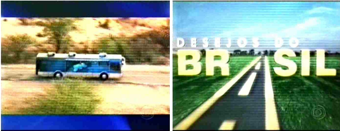
Figura 30: Carvana JN: Autointitulada descobridora dos “desejos do Brasil”

Como no trecho a seguir, em que a personagem do repórter Pedro Bial, vestida com roupas simples e despojadas, mostra-nos a conservação de um vale que guarda pegadas intactas de dinossauros, além da história de um agricultor que enriquecerá rapidamente: