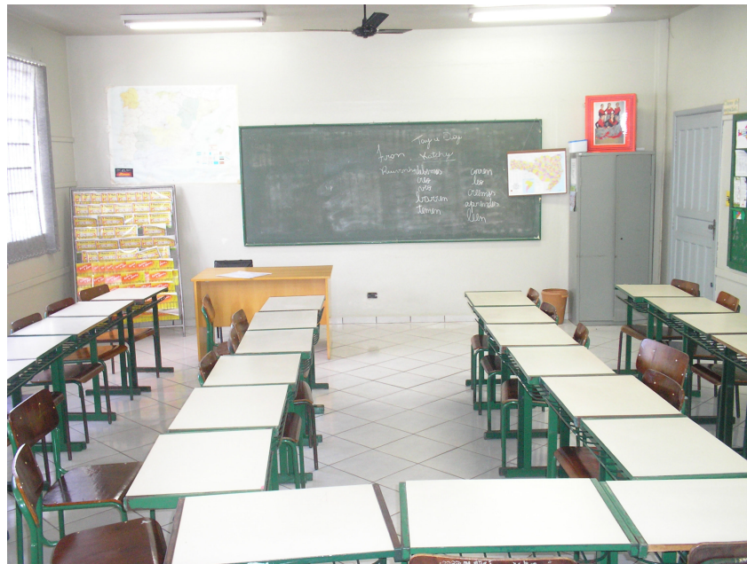
Foto tirada do fundo da sala - ER 2.

Somente nas ER 1 e 2 se utiliza uma sala específica para o professor.