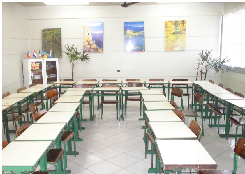
Foto tirada da frente da sala - ER 2.