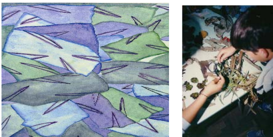
Ilustração 5. Escola Maria Angélica: artes e ciências integradas, Taim, 1991.

A Escola Municipal Maria Angélica Vilanova Leal Campello, desde o início da implantação do programa, mantém a interdisciplinaridade a partir das artes com todas as áreas do conhecimento, com vistas a promover a educação ambiental. A produção artística e científica dos educandos faz parte do acervo do nosso projeto. A direção e a supervisão dessa escola sempre primaram pelo apoio e incentivo à produção cultural, fortemente vinculada à questão identitária da comunidade arroeira e engajamento em prol da defesa dos recursos ambientais do Taim.