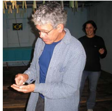
[Após o plantio, a colheita... Contando o dinheiro que conseguiram na Feira: Espontaneamente, alguém rasgou pedacinhos de papel e os distribuiu a todos, que os passavam de mão em mão, simbolizando o sucesso financeiro da Feira no futuro].