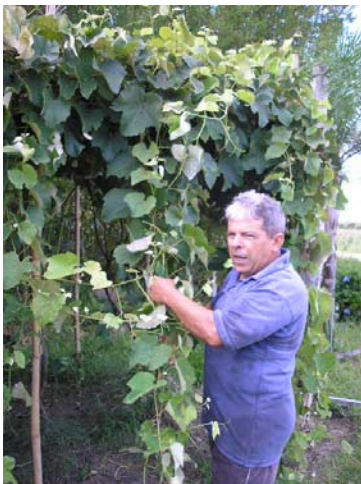
Ilustração 8. Chiquinho

Atualmente, com a consultoria e acompanhamento técnico (Projeto Costa Sul BID/ FURG/ FAURG/ NEMA), quatro famílias de produtores estão retomando os cultivos próprios das videiras, com o objetivo de produzir uvas orgânicas.