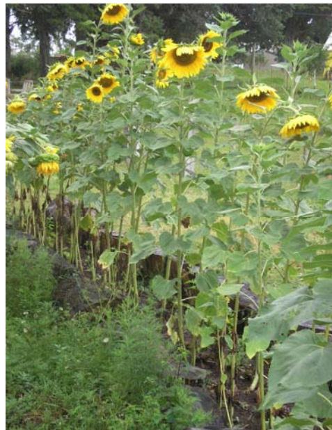
Ilustração 22. Desenhos na terra: dois aspectos do Labirinto de Girassóis: Sítio Talismã, dez. 2006.