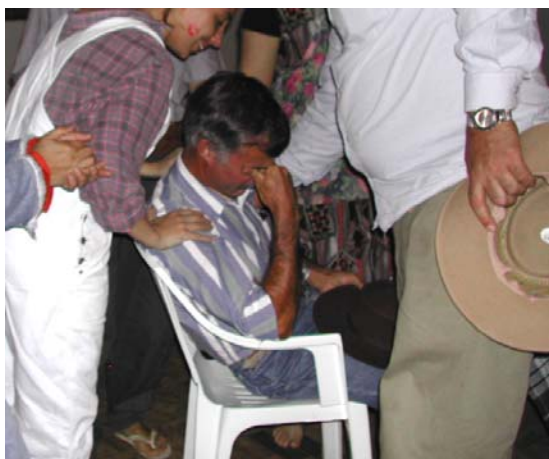
Ilustração 36. Cena do Rique

Resolvi concluir este estudo com a metáfora da transformação da uva em vinho com a qual iniciei a reflexão. No momento oportuno, pude observar essa transformação, especialmente quando se encontraram em cena teoria e prática. Segue-se um breve ensaio de texto-imagem 143 das performances sobre algumas considerações de Boal (1980) acerca do Teatro-Fórum: