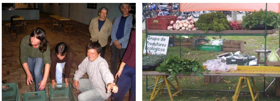
Ilustração 39. A metáfora da “emancipação”; a Feira Ecológica da FURG.

O debate, o conflito de idéias, a dialética, a argumentação e a contra-argumentação – tudo isso estimula, aquece, prepara o protagonista para agir na vida real (BOAL, 1980, p. 146).