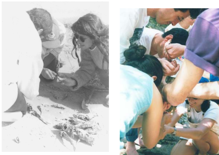
Ilustração 4. Atividades de campo: Praia do Mar Grosso, São José do Norte, 1999; Experimento "A história do rei", 2000, Pelotas.

Narrativas como essa foram me ensinando como esses sujeitos do mar liam criticamente o seu cotidiano. Os males da pesca, hoje mais focados pelas políticas compensatórias da municipalidade, naquela época estavam recém se identificando como passíveis de um maior atendimento por parte do poder público.