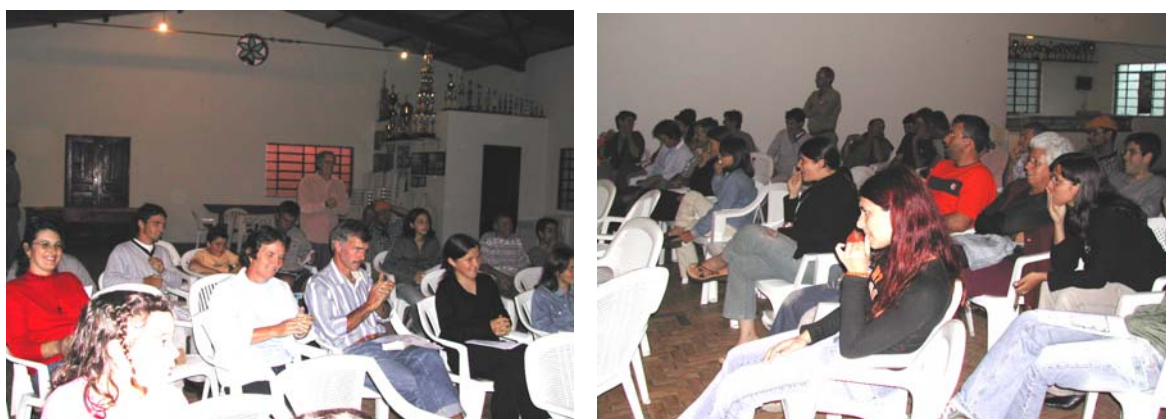
Ilustração 12. Comunidades da Quitéria e do Arraial, reunidas para a apresentação do Teatro-Fórum O problema era a água – 30 de outubro de 2004, Salão Quiteriense.

Fazem parte do grupo-sujeito Quitéria-Arraial agricultores familiares das povoações Quitéria e Arraial, que cultivam hortaliças como a couve e a alface para o comércio local. A maior rentabilidade fica por conta da produção da cebola, que é comercializada diretamente por empresas que compram toda a produção de alguns agricultores. A contribuição desse grupo a esta pesquisa está relacionada com os seus antecedentes, uma vez que a iniciativa de buscar um aconselhamento para a transição agroecológica se deu de forma espontânea, preocupados que estavam com o problema de internações hospitalares freqüentes de integrantes das diversas famílias, sob forte suspeita de contaminação por agrotóxicos.