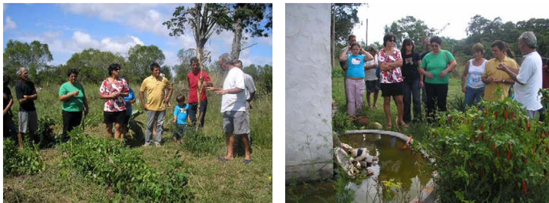
Ilustração 19. Formação do Grupo Ilhéus no Sítio Talismã em março de 2006.