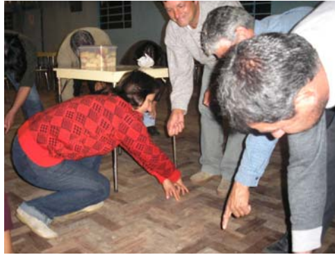
[Plantando... O gesto característico do transplante das mudas de cebola].