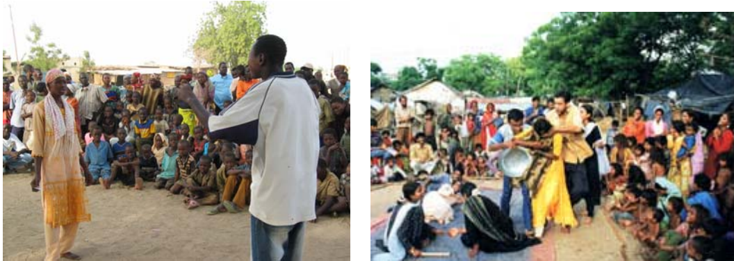
Ilustração 25. Duas performances de rua – Caravane Théâtre no Marrocos e na Índia em 1995.

O Caravane Théâtre , criado em 1996, na cidade de Toulouse, França, dirigido por Besnard, é uma organização não-governamental sem fins lucrativos, composta por atores-capacitadores (curingas, na linguagem do Teatro-Fórum) que têm trabalhado diretamente com educadores, profissionais de saúde pública, entidades filantrópicas e organizações sociais, em diversos países, especialmente na Índia (Calcutá e Jaipur) e na África (Marrocos). Tem atuado ainda na Rússia e no Uruguai, em Montevideú.