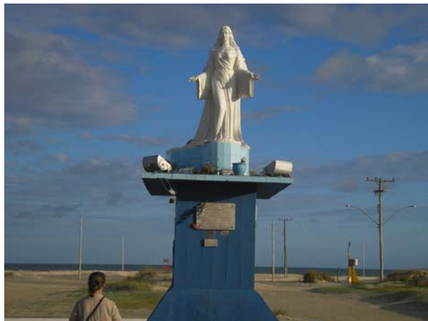
Ilustração 2. Estátua de Iemanjá no Balneário Cassino

No cenário de fundo de minha pesquisa há uma figura feminina, a Noiva do Mar , apelido da cidade do Rio Grande, a mais antiga do estado, localizada no extremo sul do Brasil, no belo ambiente estuarino, banhado pela Laguna dos Patos e pelo Oceano Atlântico. Sempre associei esse cognome à imagem de Iemanjá, a deusa das águas das religiões africanas, que está colocada na entrada do Balneário Cassino, na areia da praia, de costas para o mar e de braços abertos para acolher as preces e oferendas de seus filhos, que somos todos nós, moradores, turistas ou pescadores 9 .