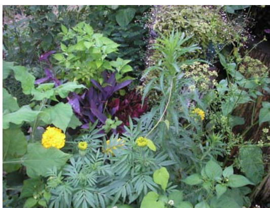
Ilustração 23. Composição com folhagens

Uma vez que pude apresentar, nas fotografias acima, alguns dos desenhos na terra do Sítio Talismã, na tentativa de dar visibilidade ao contexto de formação agroecológica e estética dos integrantes dos grupos que o freqüentam, espero ainda haver contribuído para espelhar o meu próprio imaginário de arte-educadora e a relação que faço entre arte, vida e trabalho na terra, um recorte quase autobiográfico.