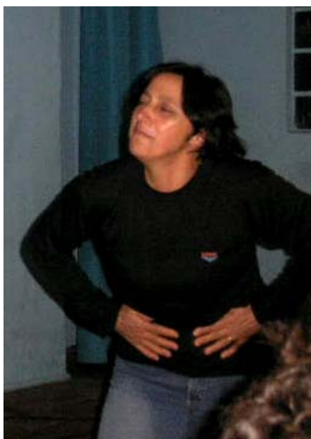
Ilustração 35. Iara: "dor"

Nessa noite, o grupo iniciou essa atividade com tanta intensidade e desenvoltura que surpreendeu até mesmo a diretora, já que todos haviam demonstrado timidez e relutância em relação a um trabalho mais formal que pudesse vir a ser apresentado à comunidade, limitando-se ao fórum interno. Embora não se tenha acertado uma efetiva apresentação ao público, desnecessário dizer da minha admiração pela performance realizada. Tal resultado, para além de minha expectativa, veio a confirmar a aceitação e entrega do grupo à linguagem do teatro e seu caráter prazeroso e reparador.