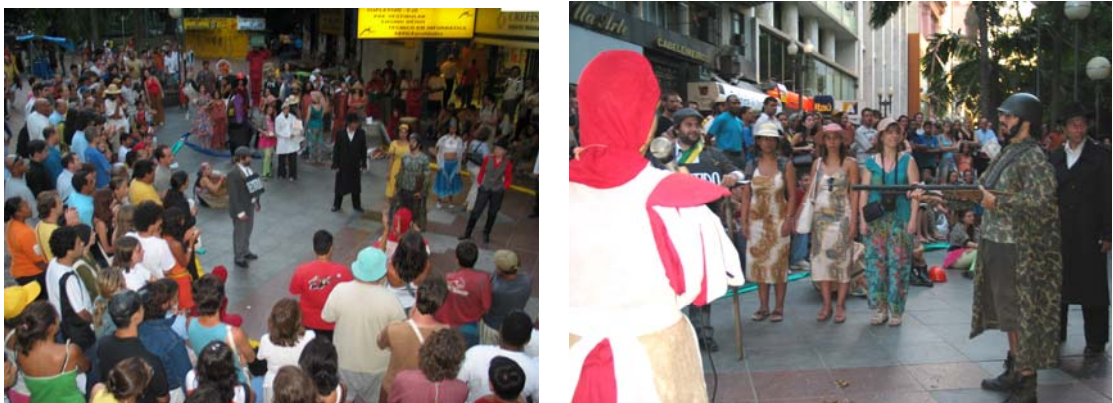
Ilustração 27. Teatro-Imagem: Integração dos grupos franceses, uruguaios e brasileiros. Performance de rua: Política brasileira , em Porto Alegre, Fórum Social Mundial – jan. 2005.