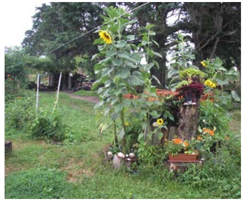
Ilustração 21. Desenhos na terra: Labirinto de Troncos, ago. 2006, e Jardins Verticais, set. 2006