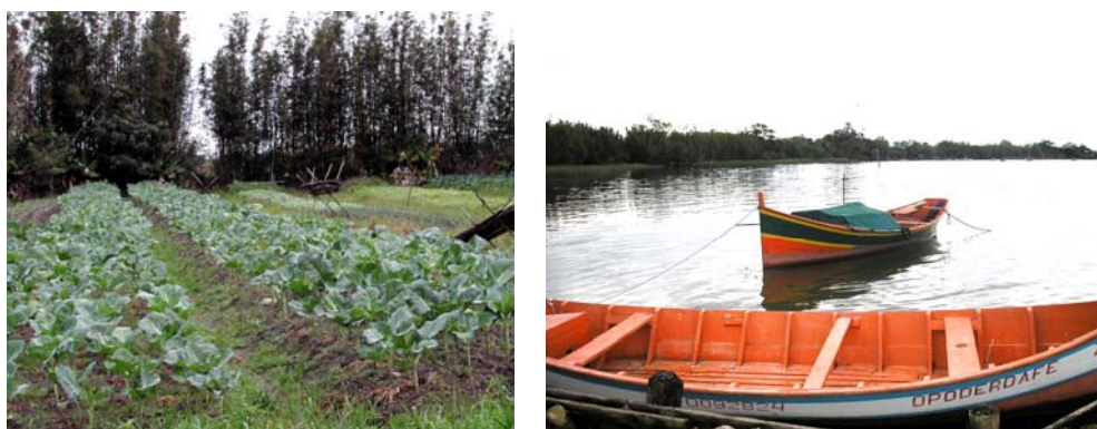
Ilustração 15. Cultivo de couve convencional; ancoradouro Porto do Rei.

A Ilha dos Marinheiros tem hoje 1.324 habitantes, divididos em 445 domicílios. No entanto, já abrigou uma população oito vezes maior, por volta da década de 1950. Seus moradores são, na grande maioria, descendentes de colonos portugueses, os portugas . A localidade passou a ser colonizada por portugueses continentais e açorianos a partir de 1737, mas teve um período de maior entrada de oriundos da região de Águeda entre 1901 e 1945, decaindo um pouco durante a 1ª Guerra Mundial. Nessa época a ilha era um grande celeiro de hortigranjeiros, vendendo seus produtos até para o Rio de Janeiro, para onde eram transportados em navios 47 . Sobre isso, um morador da Ilha dos Marinheiros relatou a um integrante do grupo-sujeito que sua família guardava um recorte de um jornal de 1912 sobre a fabricação de vinho, produzido com uvas cultivadas na própria ilha, o