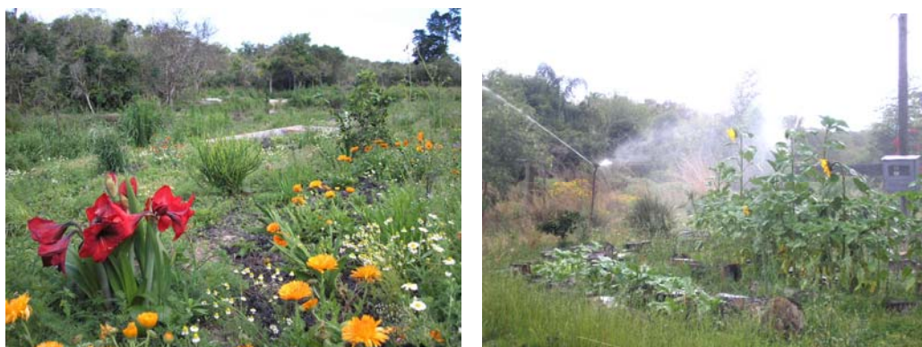
Ilustração 17. Panorâmicas do Sítio Talismã: out. 2005 e dez. 2006.

atualmente. O Sítio Talismã também aportou conhecimentos de permacultura, com desenhos de agroecossistemas integrados, que são formas de se produzir em espaços reduzidos, racionalizando ao máximo a energia, tanto solar como aeólica e também o esforço dos seus trabalhadores. De acordo com Bill Mollison (1999), “permacultura (permanente cultura) é um sistema de desenho para a criação de meios ambientes sustentáveis”. O autor diz que esse conceito encerra em si mesmo uma contradição, uma vez que não é possível se sustentar uma permanente agricultura sem uma ética do uso da terra.