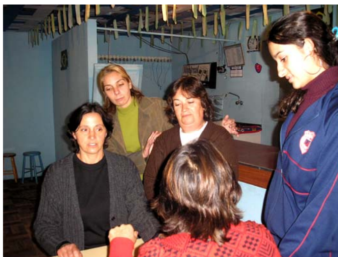
Ilustração 38. Cena de “Maria José a Vizinha”

atravessam as suas relações de trabalho. Assim, partindo do sujeito, o Teatro-Fórum promoveu a Multiplicação (BOAL, 1980, p. 128), nesse caso, por identificação entre as personagens e as lideranças que se encontravam na platéia – os diversos “Paivas”; lideranças comunitárias podem protagonizar diversas subjetividades, ensaiando sua inserção nos coletivos de luta.