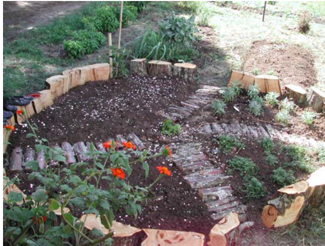
Ilustração 20. Desenhos na terra: Mandala Ervas Aromáticas, jan. 2004.

estilo de vida tem, de um lado, a ancoragem de uma ciência em construção, do mesmo modo tem nas artes a sua complementaridade. Exemplo disso são os desenhos na terra, que se transformam em hortas e floreiras no estilo permacultural, feitos por mim e pelos estudantes, condição primeira da experiência pedagógica que integra artes e ciências no Sítio Talismã.