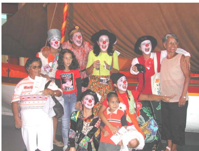
Ilustração 28. Grupo ClownDestino – Festa do Mar, Rio Grande, mar. 2005

A partir dos cursos de formação citados e do intercâmbio cultural com o grupo francês, portanto, criou-se o grupo de teatro interativo vinculado à FURG, ClownDestino , que vem atuando junto às comunidades de agricultores de nossa região costeira-estuarina, junto à Universidade e também junto à Intecoop, além das demandas da própria Universidade. O trabalho desse grupo vem desempenhando um papel importante junto às comunidades locais, desenvolvendo performances que se equiparam, em objetivos e metodologia, às desempenhadas simultaneamente nos demais países citados, nos quais também se formaram grupos como esse.