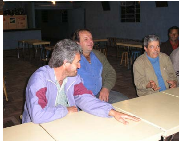
Ilustração 16. Dois momentos do curso de agroecologia: as duas fotos acima mostram a formação no Sítio Talismã (Povo Novo); as demais, debates no próprio local do curso, Salão São João Batista, na Ilha dos Marinheiros.