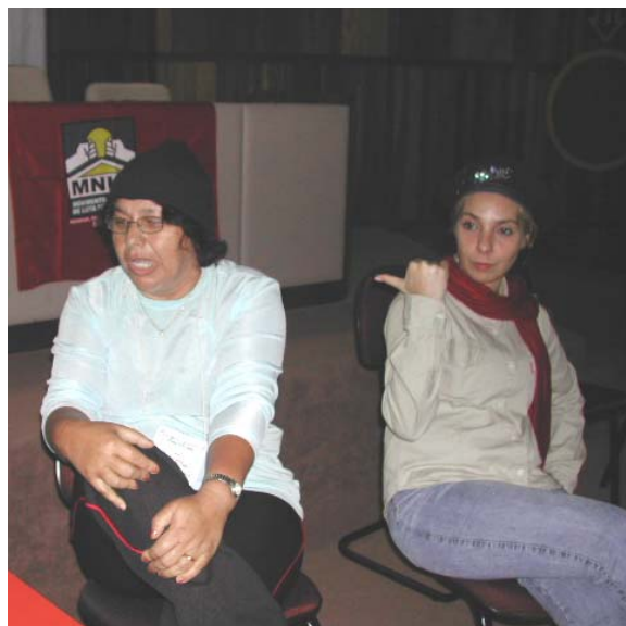
Ilustração 37. Cena da “Sabidona”