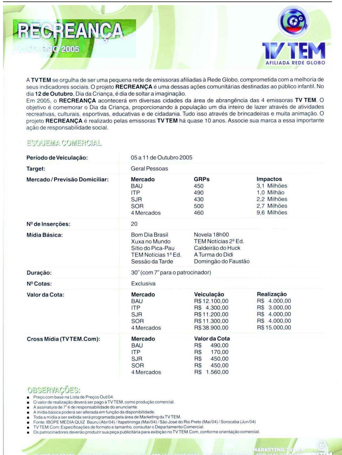
FIGURA 7 – “Recreança”, outro exemplo de evento “da casa” da TV Tem