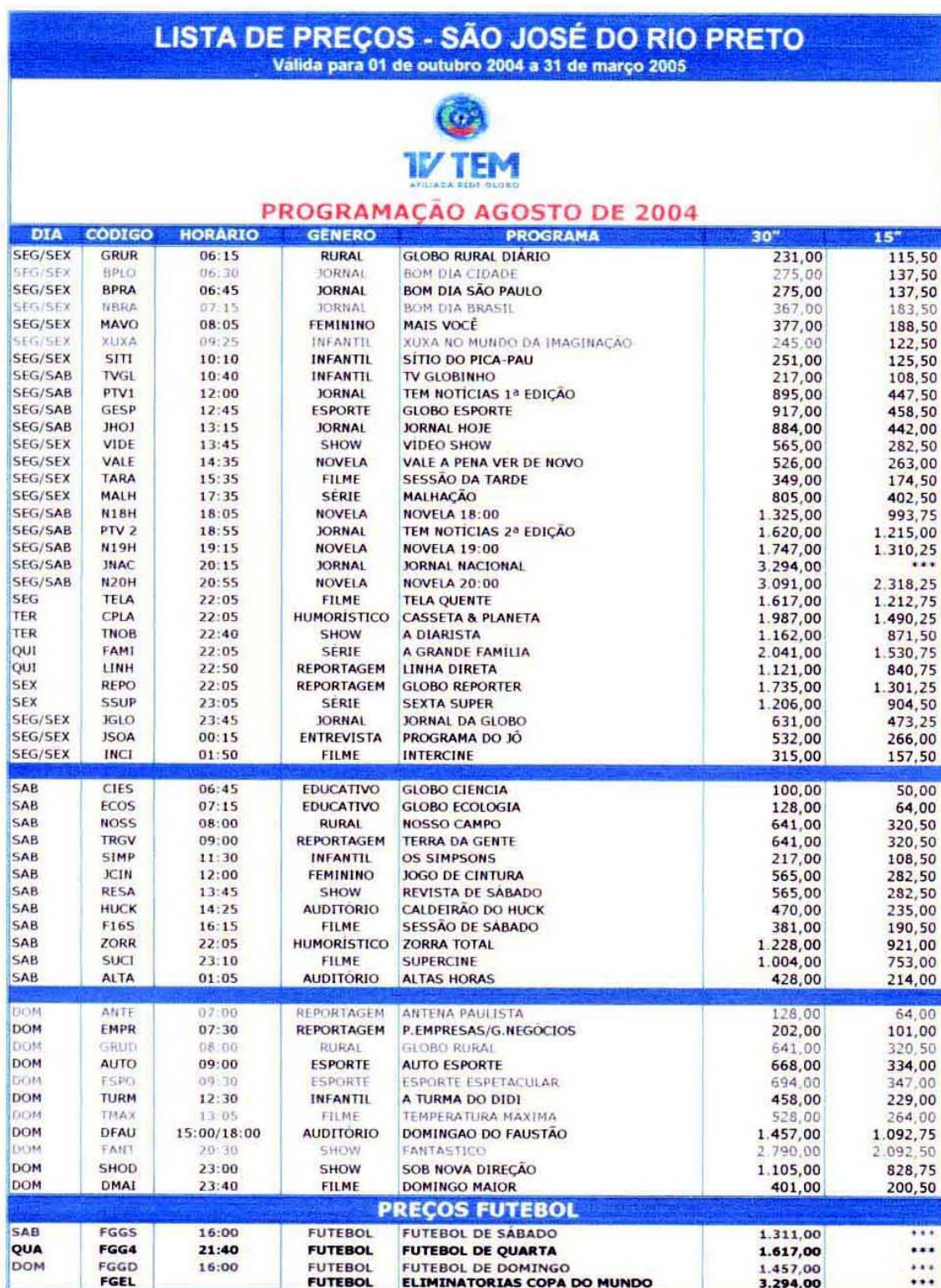
FIGURA 1 – Grade de programação e tabela de preços da TV Tem