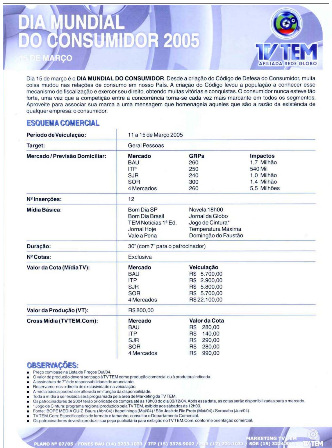
FIGURA 8 – Material publicitário do Dia Mundial do Consumidor