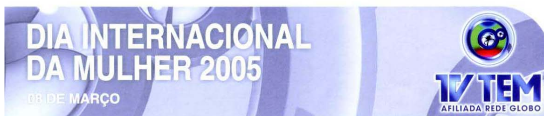
FIGURA 9 – Material publicitário do Dia Internacional da Mulher

Oito de março é o DIA INTERNACIONAL DA MULHER . Em todo o mundo, essa data é celebrada através das mais variadas manifestações. Mulher é sinônimo de sensibilidade, carinho, força e determinação. O poder de compra das mulheres vem aumentando ano após ano, consequência dos tempos em que estamos vivendo. Ser mulher num mundo tão competitivo (desempenhando as funções de mãe, esposa, executiva entre outras) não é tarefa das mais fáceis. Mas, as mulheres dão a isso um charme todo especial. Se as mulheres fazem parte do seu público-alvo, aproveite a ocasião para prestar a sua homenagem.