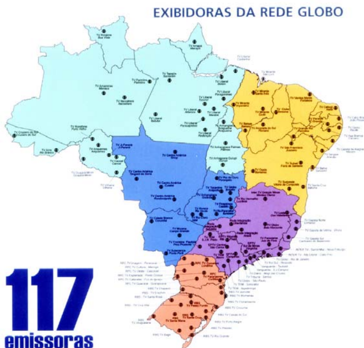
FIGURA 2 – Distribuição das exibidoras da Rede Globo

O período de estreita ligação com o regime militar serviu para consolidar a expansão da rede. O desejo de integração nacional expresso pelos governos militares estava cumprido. A imagem da televisão chegava aos cantos mais remotos do país através da Rede Globo e de suas retransmissoras, mas o poder de decisão sobre os conteúdos que iriam ao ar se concentrava nas mãos de um experiente “ gatekeeper ” (veja definição do termo mais adiante), acostumado aos bastidores do poder e às turbulências cíclicas da política. A escada emprestada pelo regime militar garantia a chegada de Roberto Marinho ao topo. Há um reconhecimento de que os executivos globais da época souberam utilizar todas as ferramentas postas à disposição da empresa e, aos poucos, construíram um império de comunicação.