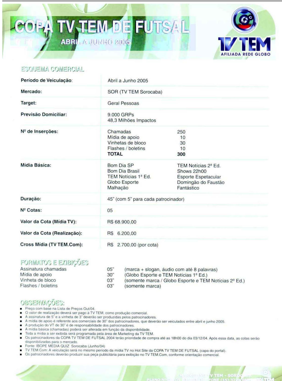
FIGURA 6 – Folder da Copa TV Tem de Futsal, um evento “da casa”