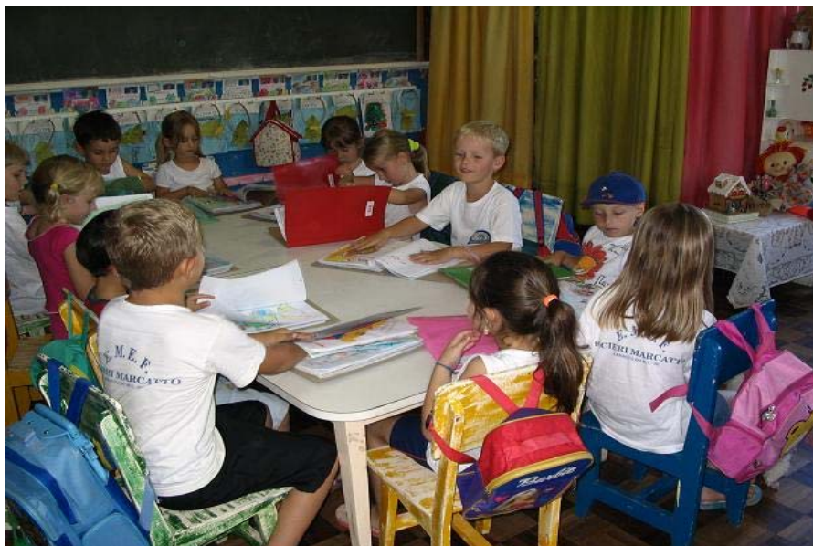
Foto 7- Crianças em sala olhando pastas de atividades.