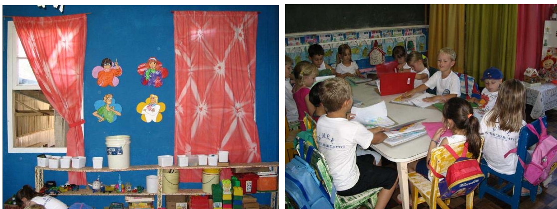
Foto 4- Visão interna da sala de aula.

O Jardim é estruturado em duas turmas, sendo uma no período matutino com funcionamento das 7h30min às 11h30min; e uma turma vespertina com horário das 13h às 17hs. As turmas da manhã e da tarde contêm aproximadamente 20 alunos cada uma e a mesma professora para ambos os turnos. A idade dos alunos no contexto investigado varia entre 3 a 5 anos, isso acontece pois não há turmas anteriores ao Jardim. A Educação Infantil apresenta as turmas do Jardim e Pré-escola somente, sendo que o Jardim atende as crianças na faixa etária de 3 a 5 anos e a Pré-escola acima de 5 anos.