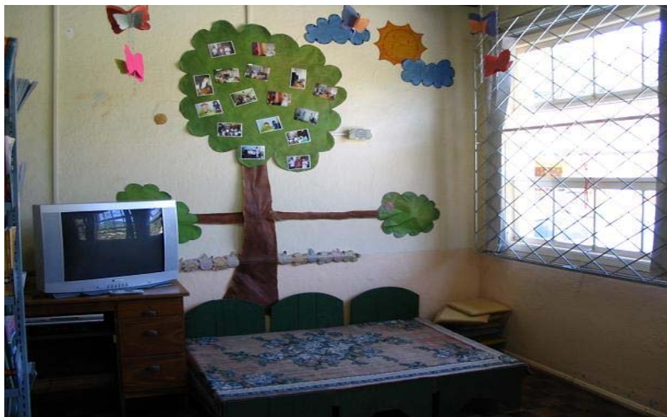
Foto 6- Local na biblioteca onde acontece a contação.