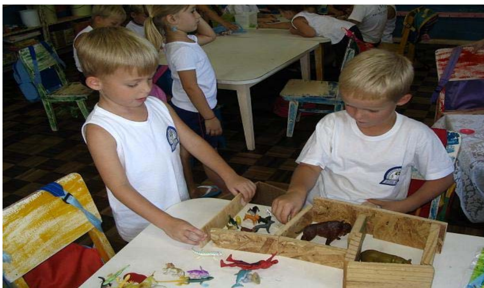
Foto 11- Crianças brincando de montar uma fazenda.

Assim como no parque, a observação na brincadeira livre é difícil pelo fato das crianças ficarem espalhadas e falarem todas ao mesmo tempo ou falarem muito baixo quando estão conversando com suas bonecas ou lendo livros e em alguns momentos essas falas eram uma fala para si. A única vantagem é que o ambiente de sala é menor e por isso mais fácil do todo ser observado e as crianças não trocavam de ambientes/ brinquedos tão frequentemente como acontecia no parque.