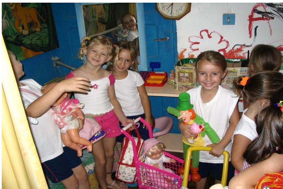
Foto 8- Meninas brincando com bonecas.