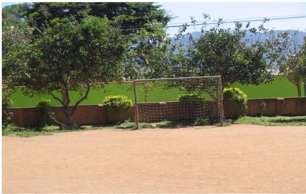
Foto 9- Campo de futebol, onde acontece a aula de Ed. Física.

A aula de educação física, que acontece duas vezes por semana, possibilita às crianças trabalharem movimentos amplos e específicos, sendo o pátio coberto e o campinho os locais onde as aulas acontecem.