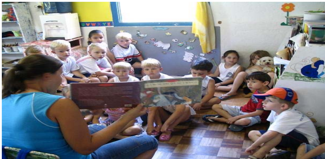
Foto 5- A contação na sala de aula.