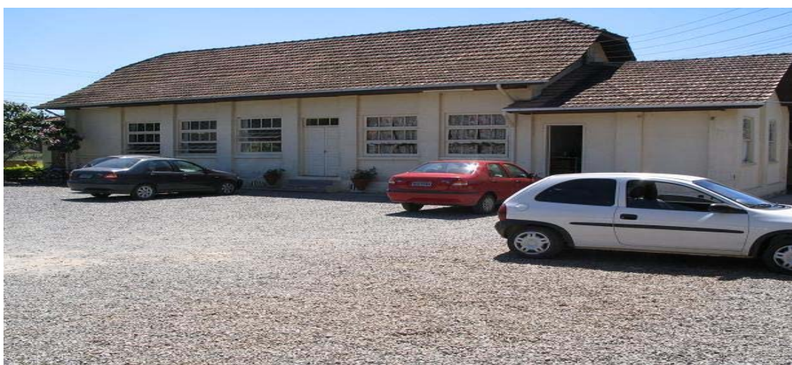
Foto 2- Vista parcial da Escola Municipal de Ensino Fundamental Ricieri Marcatto

Caminharemos neste tópico no sentido de conhecer a escola de uma forma ampla, abarcando aspectos históricos de sua fundação, a localidade em que se encontra, seu quadro funcional, sua proposta pedagógica e espaço físico; e seguiremos para os espaços de maior interesse, que são a biblioteca e a sala aula, alinhavando a essa descrição estrutural minha inserção nos mesmos. Os dados aqui apresentados, tanto históricos ou de cunho pedagógicos e funcionais, foram cedidos pela própria escola e os demais emergiram das observações, vivências e anotações em diário de campo realizadas pela pesquisadora.