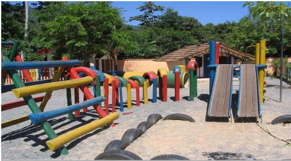
Foto 10- Parque.

No parque a observação é mais difícil e por isso não há tantas informações, a dificuldade vem do fato das crianças ficarem espalhadas nos diversos brinquedos, muitos em movimento, o que inviabilizou a aproximação por parte da pesquisadora. Além disso, neste ambiente o som se dispersa com maior facilidade, sendo muitas vezes inaudível, ou melhor, incompreensível, pois não há falta de falas, ao contrário, há muitas falas acontecendo ao mesmo tempo.