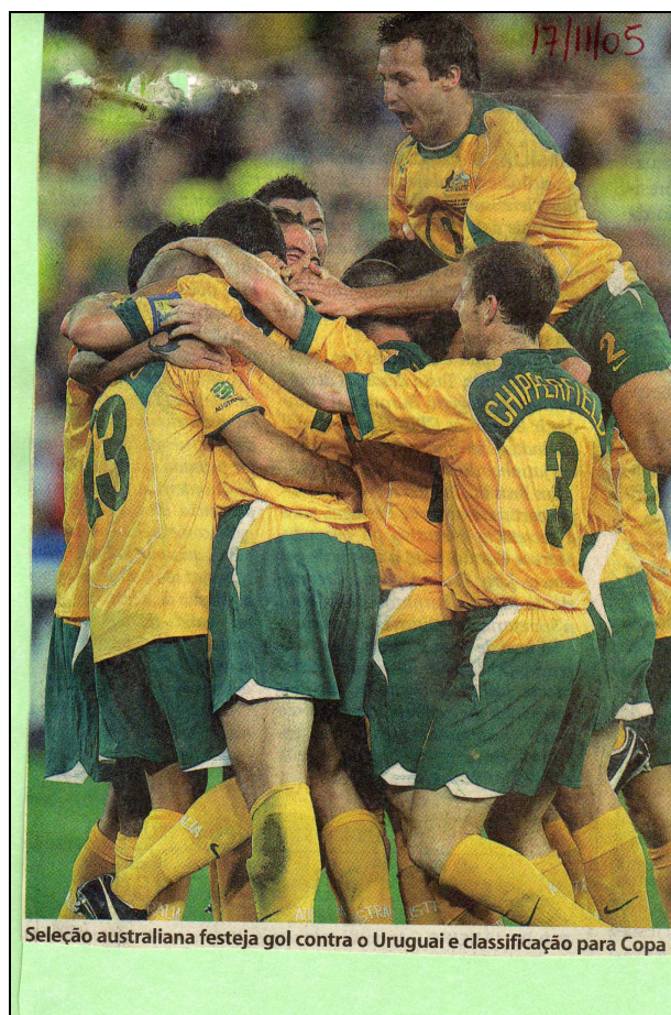
Figura 8 - Foto do jornal Folha de S. Paulo do dia 17.11.2005.

Nessa foto, os jogadores australianos se passaram por brasileiros. A família acrescentou que a cor do uniforme comprovava essa informação. Não consideraram, por exemplo, o nome dos jogadores grafados na camiseta. No entanto, ao lerem a legenda, observaram o equívoco de sua interpretação: