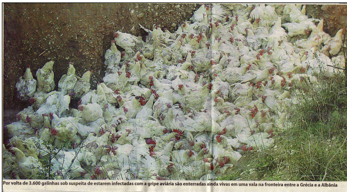
Figura 5 - Foto do jornal Folha de S. Paulo do dia 21.10.2005. Em relação a essa imagem, foram feitos os seguintes comentários:

Em um dos encontros semanais, a família separou uma foto específica para apresentar à pesquisadora. A reportagem era sobre o vírus da gripe aviária e a foto retratava as medidas que haviam sido tomadas: galinhas enterradas vivas.