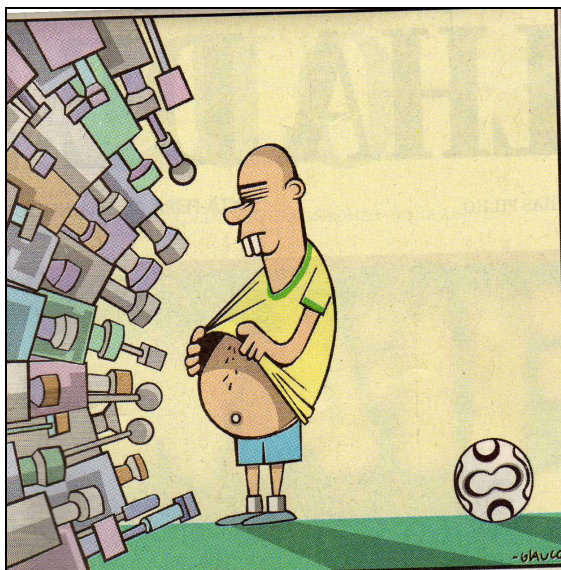
Figura 4 - Charges do Jornal Folha de S. Paulo do dia 16.06.06.

A família relacionou a reportagem 'O peso da Copa' publicada no dia 16.06.2006 (ANEXO A) com a charge escolhida. Para a família,