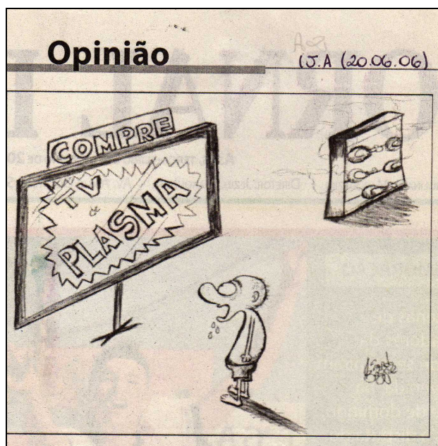
Figura 2 - Charges do Jornal de Assis do dia 20.06.06.

A 2 - “Está babando por uma televisão, mas não pode comprar. Na Copa as pessoas preocupam-se com televisão. É como se as pessoas dessem mais atenção para a Copa do que para os problemas. As pessoas não querem saber o que os políticos estão fazendo”.