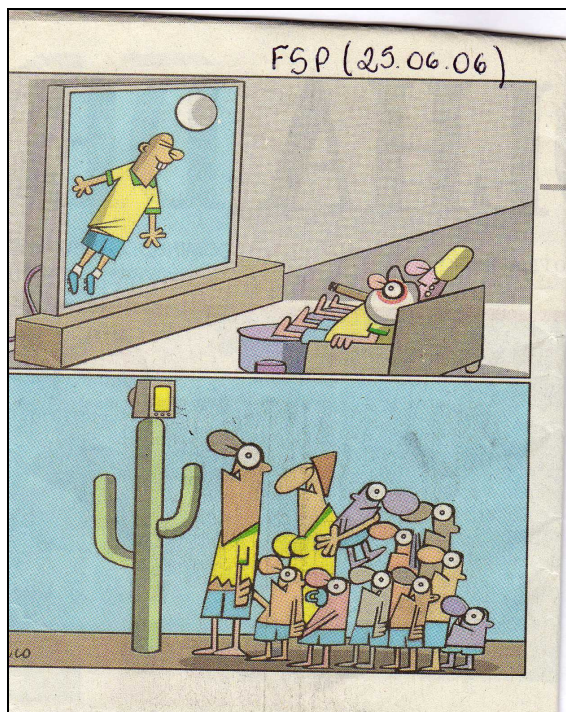
Figura 3 - Charges do Jornal Folha de S. Paulo do dia 25.06.06.

A 3 - “Eu entendi que o Lula está na casa dele com uma televisão grande, sofá confortável, vendo televisão. E em baixo, as outras pessoas estão todas desconfortáveis, debaixo do sol, situação de pobreza, e o governo não toma nenhuma atitude”.