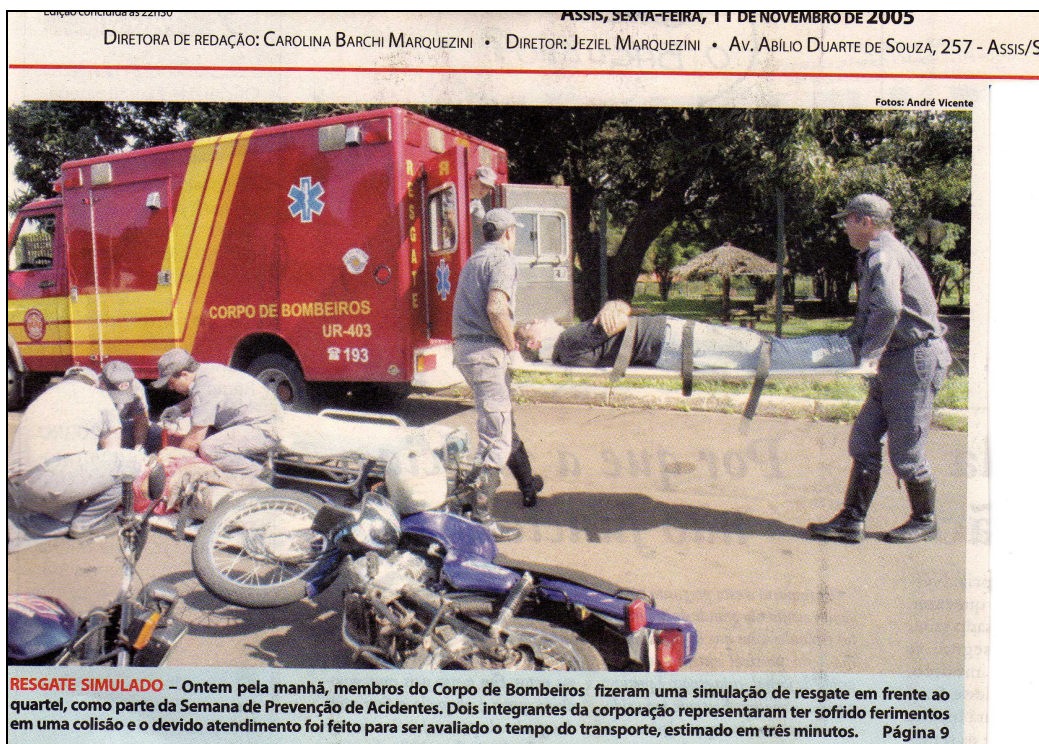
Figura 6 - Foto do Jornal de Assis do dia 11.11.2005.

Sem a leitura da legenda, por exemplo, a fotografia abaixo, mostrando a simulação de um acidente pelo Corpo de Bombeiros, foi tomada por F 2 como um acidente real.