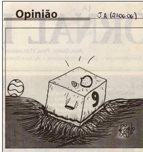
Figura 1 - Charges do Jornal de Assis do dia 21.06.06.

A 1 - “Confesso que não achei fácil realizar essa atividade. Essa faz crítica à gordura do Ronaldinho, está todo mundo dizendo que ele está gordo. Crítica a maneira como Ronaldo vem jogando, tanta pressão que acaba afundando no campo. A mídia é capaz de mudar a imagem das pessoas. Hoje, olhei na internet e vi que estavam abraçando o Ronaldo, estava sorrindo, mudou a imagem dele”.