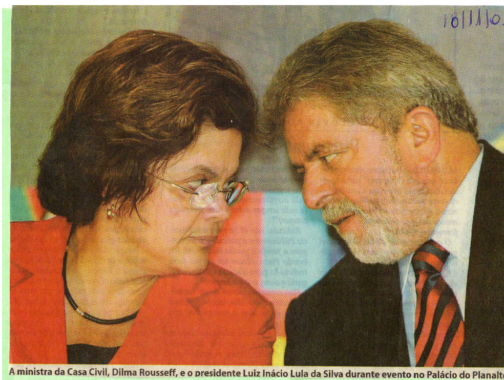
Figura 9 - Foto do jornal Folha de S. Paulo do dia 18.11.2005.

Embora essa família seja contemporânea aos acontecimentos veiculados pelo jornal, a distância entre os sujeitos da pesquisa e os contextos retratados gerava a incompreensão. É preciso direcionar o olhar para o exercício da busca de indicadores, para as possibilidades a que o signo não-verbal remete o leitor e assim construir seu significado.