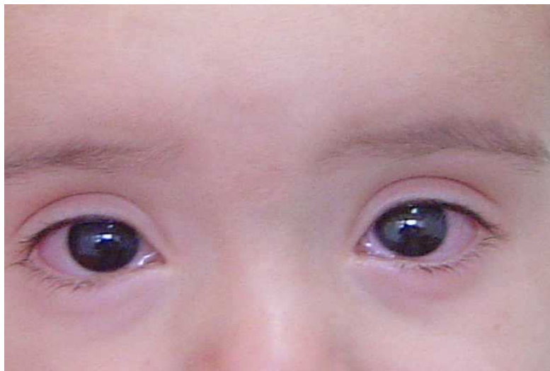
FIGURA 2 - FOTO DE CRIANÇA COM MANIFESTAÇÕES ALÉRGICAS APÓS A APLICAÇÃO DA VACINA MORUPAR® - PR, 2004

Quanto à apresentação clínica de hipersensibilidade imediata, houve predomínio de hiperemia conjuntival e manifestações cutâneas, conforme ilustração da figura 2.