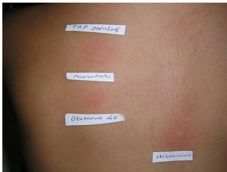
FIGURA 4 - FOTO ILUSTRATIVA DE TESTE CUTÂNEO POR PUNTURA POSITIVO PARA VACINA MORUPAR® E DEXTRANO 40, REALIZADO EM UM DOS CASOS DE REAÇÃO DE HIPERSENSIBILIDADE À VACINA MORUPAR® - CURITIBA, 2004

OBS.: Histamina = controle positivo.