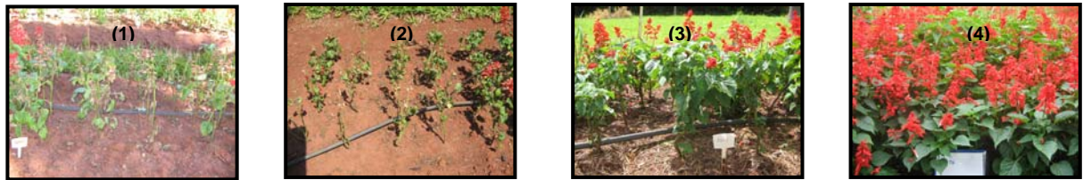
Figura 2. Plantas de Salvia splendens submetidas ao tratamento que recebeu 2 L/ha de oxyfluorfen, sem acréscimo de palha. 1) aos 7 DAA; 2) aos 14 DAA; 3) aos 42 DAA; 4) aos 56 DAA (ausência de sintomas de fitotoxicidade). Jaboticabal, 2007.

A análise dos dados de número de inflorescências das plantas de Salvia splendens (Tabela 5) mostrou que a interação quantidade de palha aplicada e dose de herbicida foi significativa aos 7, 14, 28 DAA.