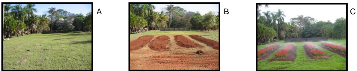
Figura 1. Preparo da área. A) local onde foi instalado o experimento, ainda com a grama; B) retirada da grama no local onde foi acrescido o solo; C) experimento instalado e em condução. Jaboticabal, 2007.

Para o preparo da área retirou-se a grama presente e no local foi introduzido solo no qual foram preparados quatro canteiros de dimensões de 14,0 m x 1,0 m e 0,30 m de altura, totalizando um incremento de 16,8 m 3 de solo na área. Cada canteiro possuía 12 parcelas de 1 m 2 .