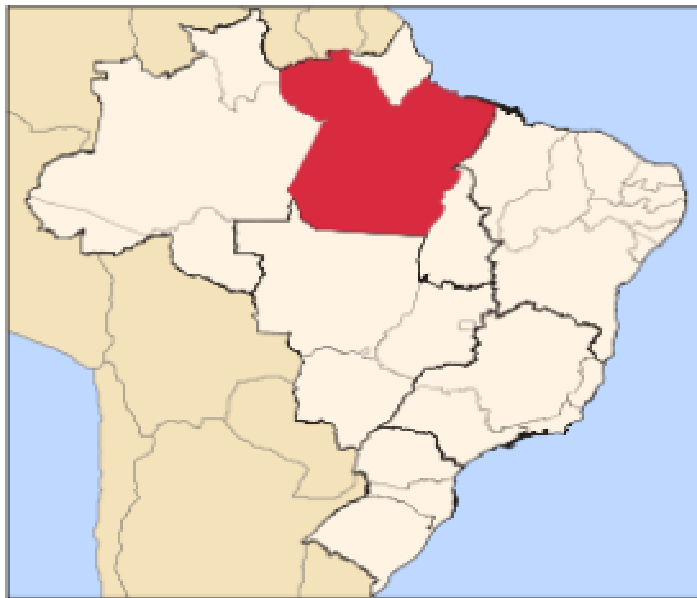
Figura 2 - O Estado do Pará destacado do mapa do Brasil.

Aliado a esse fator, a estratégia de criação da Superintendência de Desenvolvimento da Amazônia - SUDAM, com o objetivo de promover o desenvolvimento e a ocupação da Amazônia com o emblema "Integrar para não entregar", desencadeou uma série de ações de cunho desenvolvimentistas no Estado, como a construção da Hidrelétrica de Tucuruí, da rodovia Transamazônica e Perimetral Norte, a exploração dos minérios da Serra de Carajás e a instalação dos distritos de Barcarena, Icoaraci (Região Metropolitana de Belém) e Marabá que, integrados à instituição da lei dos incentivos fiscais e a demarcação política da Amazônia Legal, levaram empresários a perceber o grande potencial industrial na região.