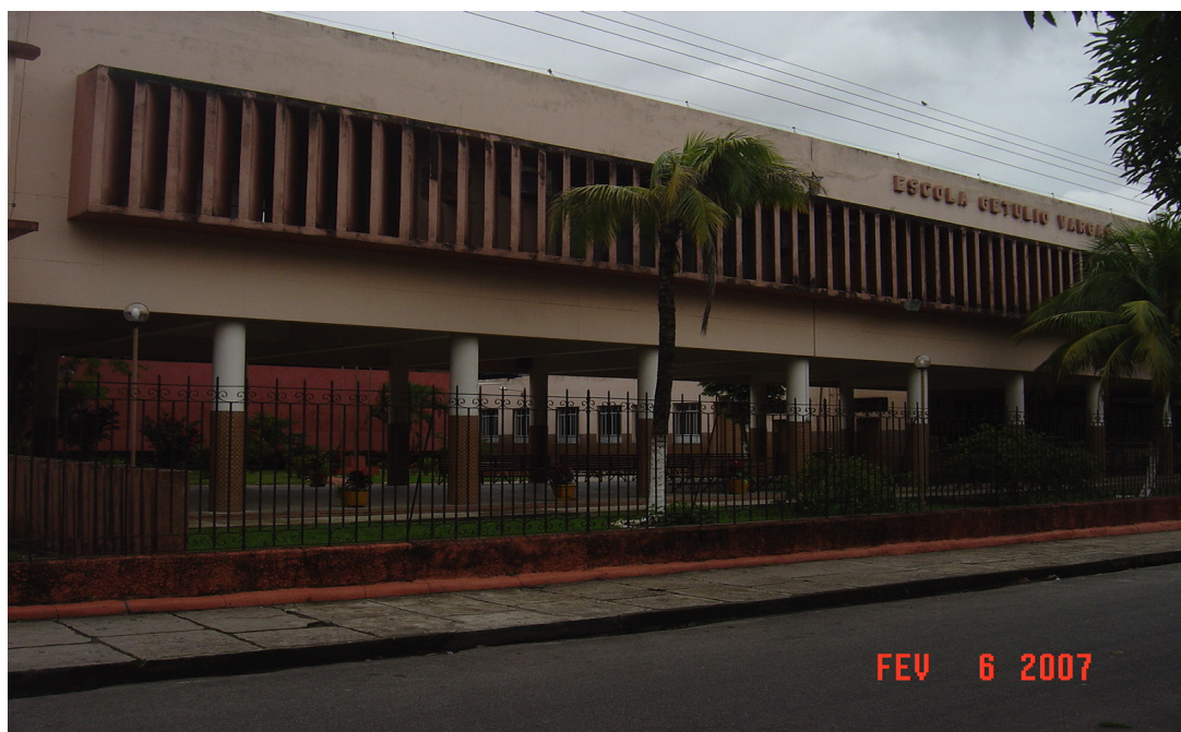
Figura 1 - Centro de Formação Profissional Getúlio Vargas.

A primeira unidade de qualificação para o trabalho do SENAI no Pará foi o Centro de Formação Profissional Getúlio Vargas, inaugurado em Belém, em 1º de maio de 1953.