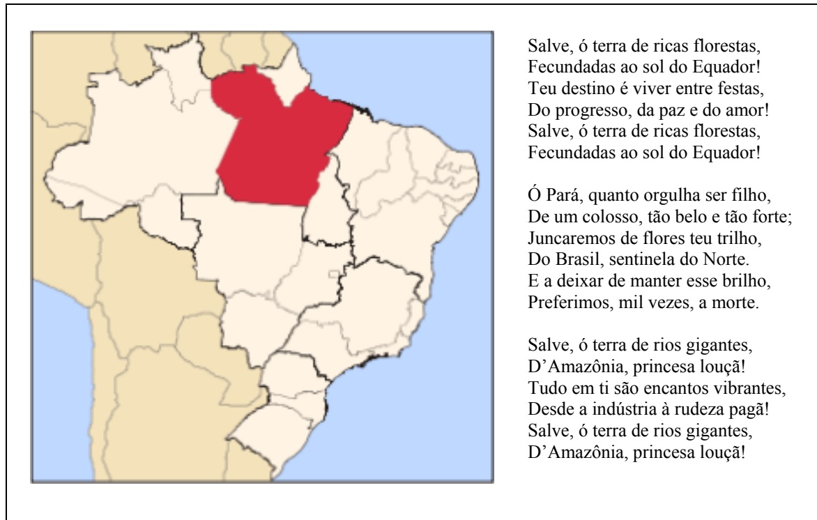
Figura 1: Mapa de localização e hino do estado do Pará