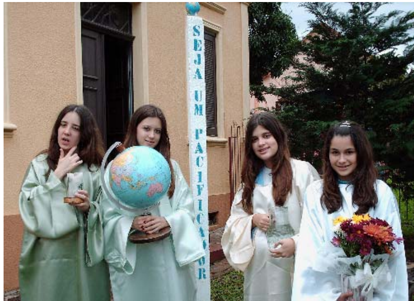
Foto 4: Dia Internacional da Paz - Escola Imaculado Coração de Maria - 21/09/06

Um dos momentos mais fortes do ano foi Dia Internacional da Paz onde todos os alunos da escola foram envolvidos. As turmas dos pequenos foram as ruas entregar mensagens de paz, fizeram o pedágio pela paz no trânsito e a tarde participaram de uma celebração pela Paz com a presença das escolas mais próximas. A 8ª série ficou responsável para colocar o marco da Paz na frente da escola, como pode ser visto na foto 3 e 4, onde foi escrito: Seja um pacificador. As turmas de 5ª à 7ª séries distribuíram mensagens de paz nas escolas públicas.