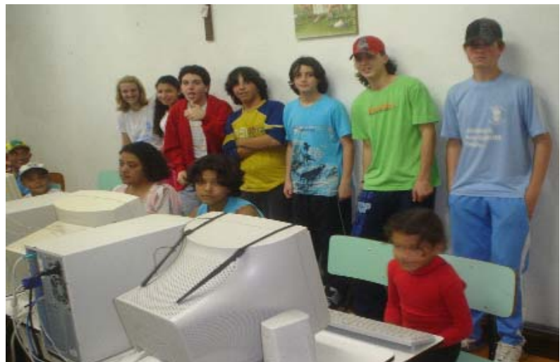
Foto 5: Grupo LUTE - Projeto Inclusão Digital - Escola Imaculado Coração de Maria - 14/08/06

O grupo de jovens assessora o trabalho junto aos computadores e tem a supervisão da professora de informática e das assessoras do grupo. O encontro acontece mensalmente.