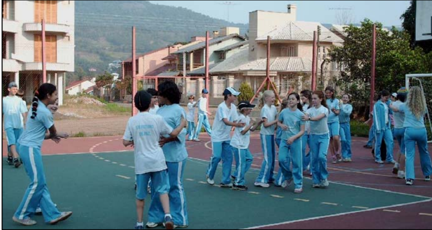
Foto 1: Encontro de Formação - Escola Imaculado Coração de Maria -12/09/06

Os alunos têm consciência do objetivo destes encontros de formação. Num encontro em que foram trabalhados as fases da vida humana e como se expressa nossa afetividade e sexualidade, apareceram muitas perguntas. Quando questionados sobre o sentido destes encontros eles expressaram: