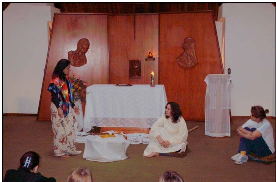
Foto 6: Retiro dos professores e funcionários - Viamão - 07/10/06

No segundo semestre tivemos o Retiro para professores e funcionários, que teve como tema: Um Encontro na Fonte , fundamentado no texto bíblico do encontro de Jesus com a Samaritana, junto ao poço de Jacó. Na foto 6 podemos observar um momento celebrativo realizado na capela.