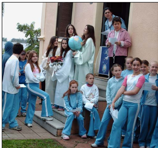
Foto 3: Dia Internacional da Paz - Escola Imaculado Coração de Maria - 21/09/06

A menina da mãe A, está na 2ª série. A celebração ocorreu à tarde, no horário de aula da filha. O menino tem aula pela manhã e compareceu à celebração por iniciativa própria. Quando a família cultiva estes valores em casa, na escola os alunos também aderem a proposta. Quando eles são menores contam para os pais as atividades desenvolvidas na escola, quando são adolescentes, em geral, não comentam muito, mas deixam transparecer se estão de acordo ou não com as atividades.