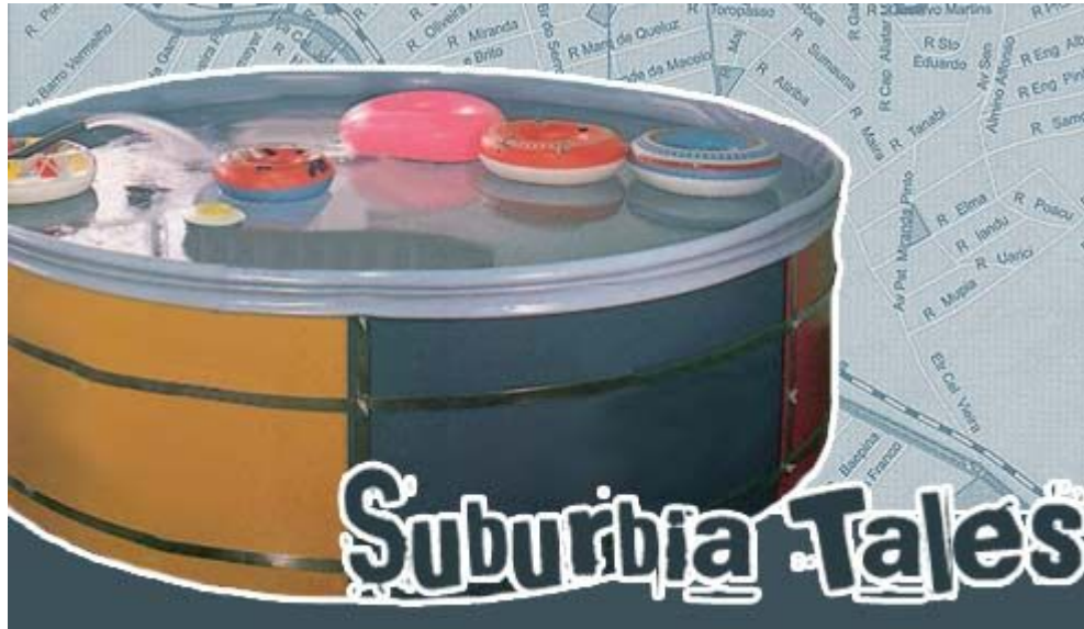
Figura 2: site suburbia tales (Maio/2006)

Entretanto, essa compreensão de que o explicador atua nesses espaços é compartilhada pelo site suburbia tales , dedicado aos moradores do subúrbio carioca: