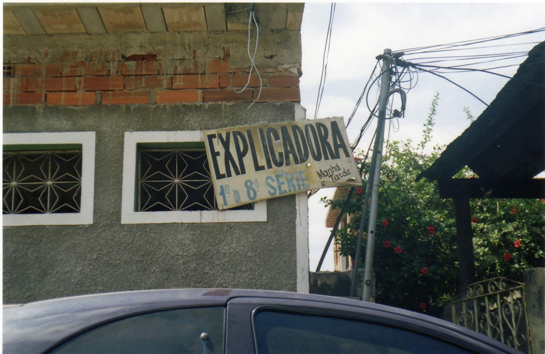
Foto 1: placa na residência de uma explicadora do bairro Realengo (cidade Rio de Janeiro). Fotografada em novembro de 2005.

Ao observarmos as placas expostas nas casas dos explicadores em um bairro da periferia da cidade do Rio de Janeiro, percebemos que elas fazem parte de um cenário mais abrangente, de uma paisagem formada por outras diversificadas placas, presas nos muros das