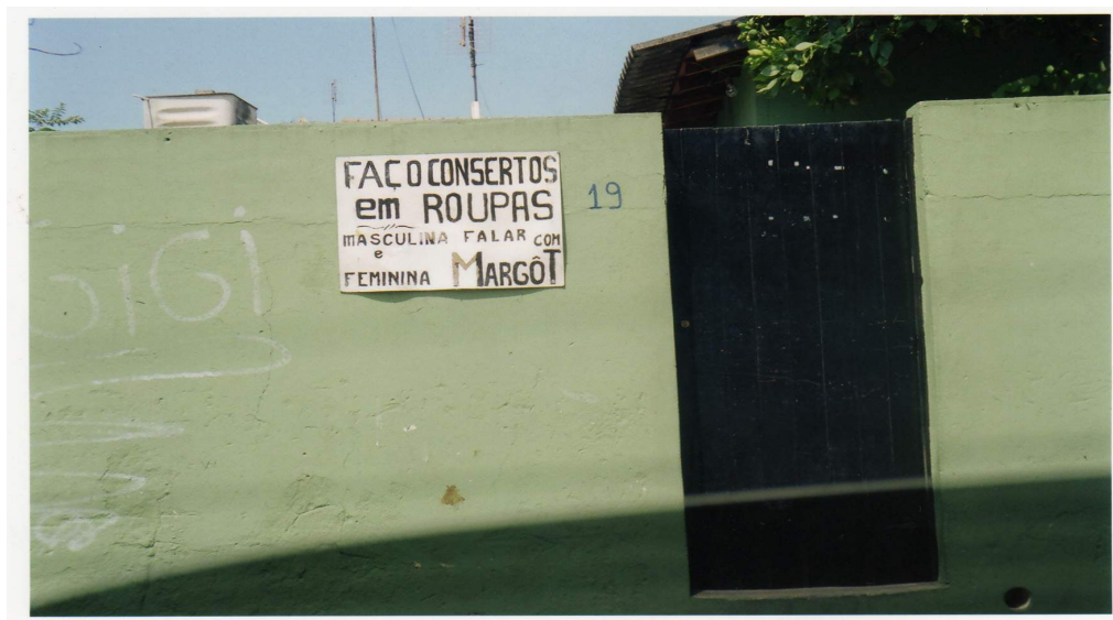
Foto 2: placa de oferta de serviços. Bairro: Realengo Rio de Janeiro. Nov/2005

Para Martins e Vaz (2005), este é um fenômeno que o nosso olhar não consegue notar a intencionalidade da comunicação. Os autores, ao referirem-se às placas de maneira geral, consideram que esta onipresença da escrita manifesta-se discretamente no espaço urbano e disputa esse espaço tanto com estratégias de publicidade sofisticadas quanto com a rebeldia estetizada (p. 04).