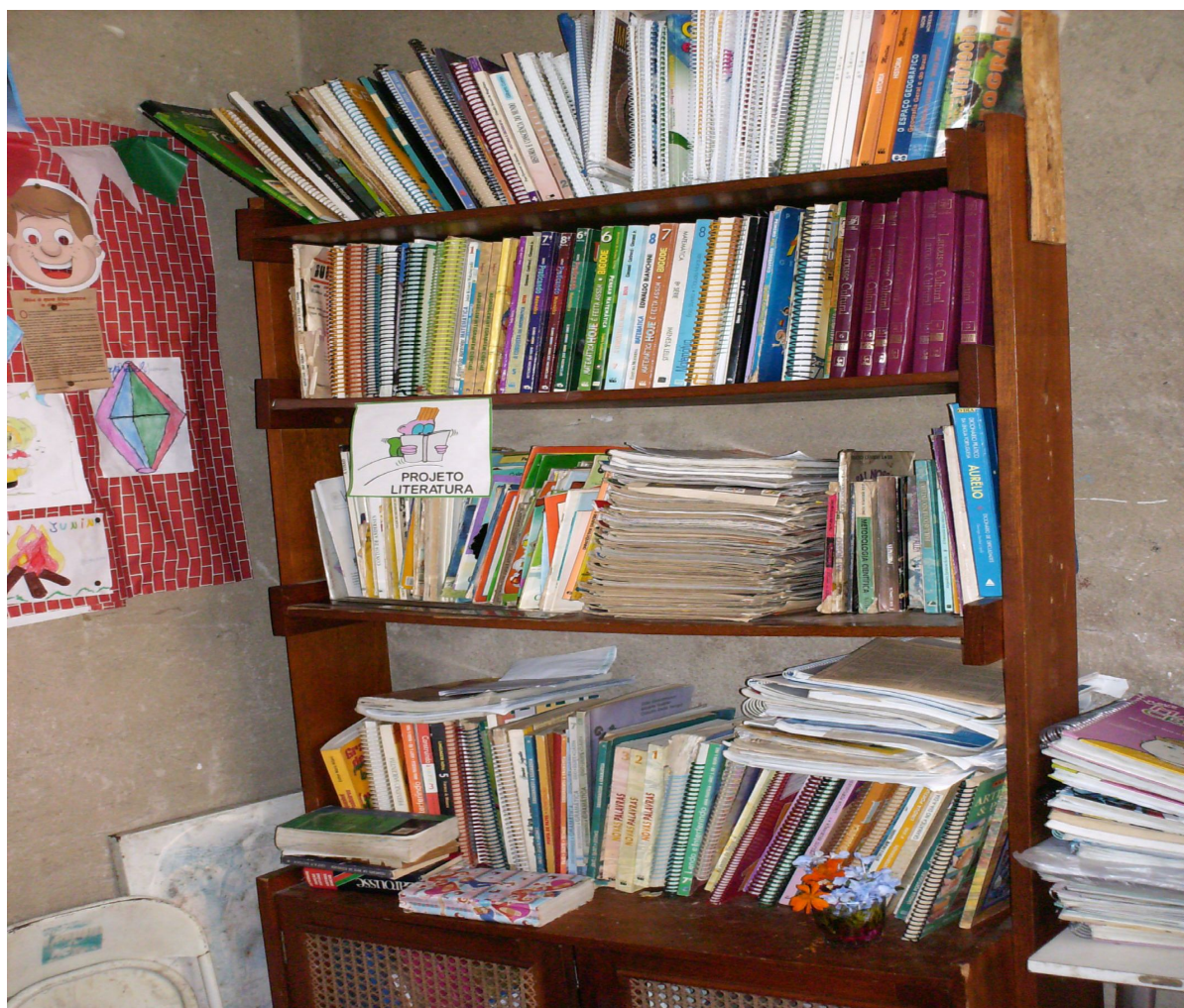
Foto 8: Estante de livros localizada na varanda da explicadora. Rio de Janeiro, julho/2006.

Eles dinamizam o trabalho colocando à disposição dos alunos o material que pode ser utilizado na explicação: livros didáticos, mapas geográficos, revistas e jornais para pesquisas, cadernos escolares dos anos anteriores e o arquivo das atividades já realizadas. Ou seja, eles já possuem um acervo e uma pequena biblioteca.