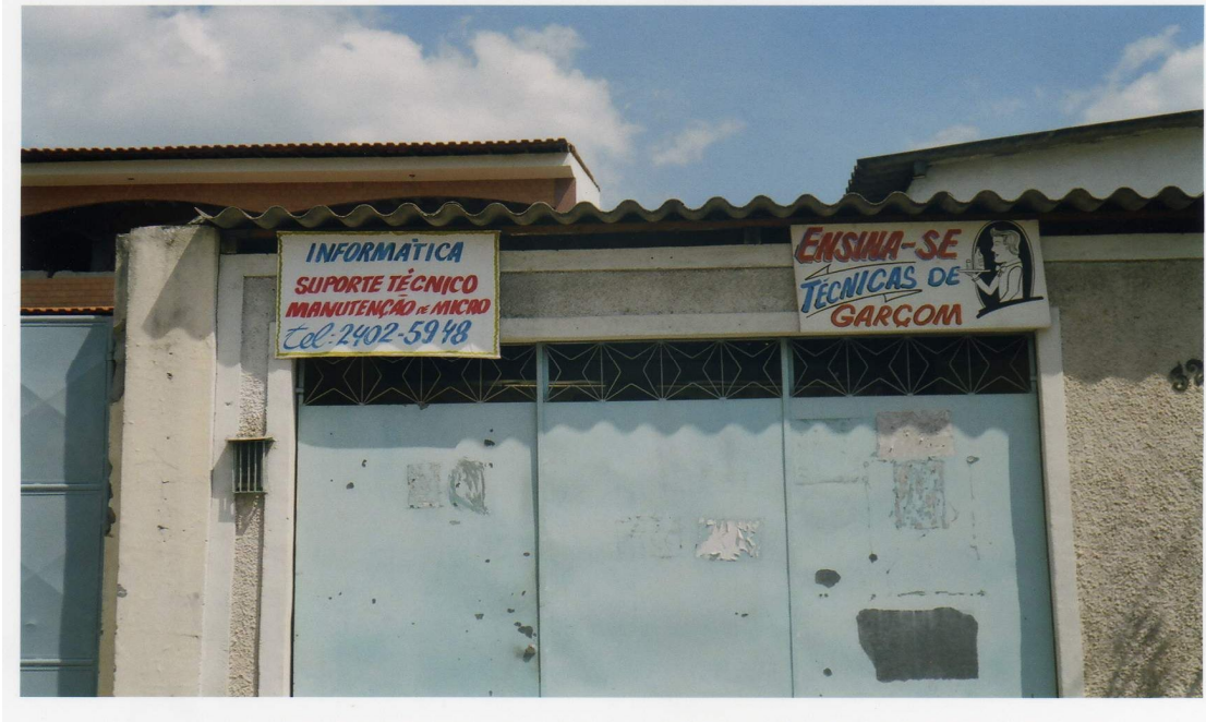
Foto 5: placa de prestação de serviços. Bairro: Realengo (Rio de Janeiro).

Rio das Pedras e Realengo: favela e subúrbio – lugares donde la ciudad cambia su nombre . Esta expressão em espanhol é utilizada por Fernandes (1995), e foi inspirada numa novela conhecida na literatura de Barcelona, publicada em 1957, por Francesc Candel. Na obra, ainda, segundo Fernandes (1995), o escritor catalão resume o duro processo de urbanização capitalista que produziu bairros excluídos em termos simbólicos e/ou materiais a tal ponto de projetar na consciência social a visão de que esses espaços não fazem parte da cidade (Idem).