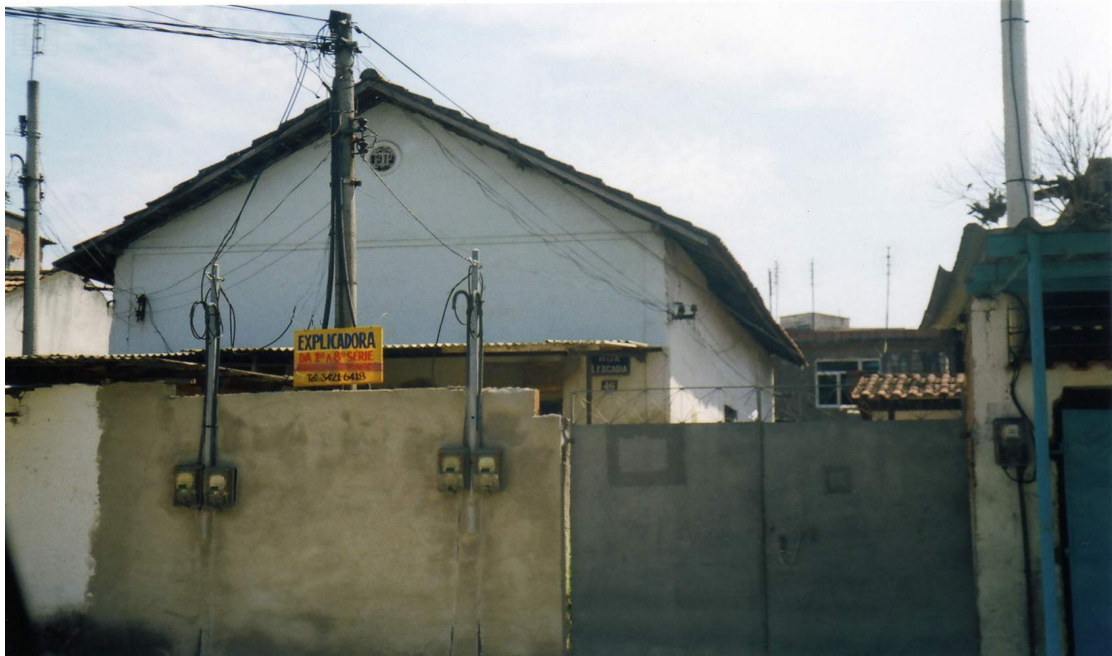
Foto 4: placa exposta no muro da residência da explicadora. Bairro: Realengo (Rio de Janeiro). Novembro/2005.

Mais do que uma simples diferença semântica, a expressão “ o pequeno suburbano não tem professor particular, tem explicadora ” sugere que há algo para além da geografia da cidade, conforme foto a seguir: