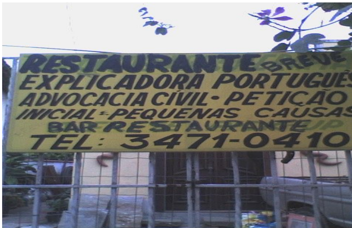
Foto 3: Placa de prestação de diversos serviços, entre eles, de explicadora. Bairro Jacarepaguá (Rio de Janeiro). Março/2006.

Durante a pesquisa, encontramos alguns explicadores que não utilizam a placa como recurso. Eles nos informaram que a indicação das famílias dos alunos é suficiente para a quantidade de alunos desejada. Como foi o caso de uma entrevistada que não tinha qualquer placa de identificação no muro de sua residência, tão comumente encontrada ao longo da cidade. Quem passasse por sua rua jamais saberia o trabalho que desenvolvia no interior de sua casa, a não ser por intermédio de vizinhos. O interessante é que a entrevistada transformou sua varanda em uma típica sala de aula, com mesa, livros, murais e bancos improvisados. Conhecer esse ambiente só foi possível com a autorização da entrevistada. Para as entrevistas foram usados três tipos de abordagens: panfleto; indicação e placas nos muros. A seguir, o esquema do percurso pelos bairros visitados e as formas utilizadas para abordagens aos explicadores: