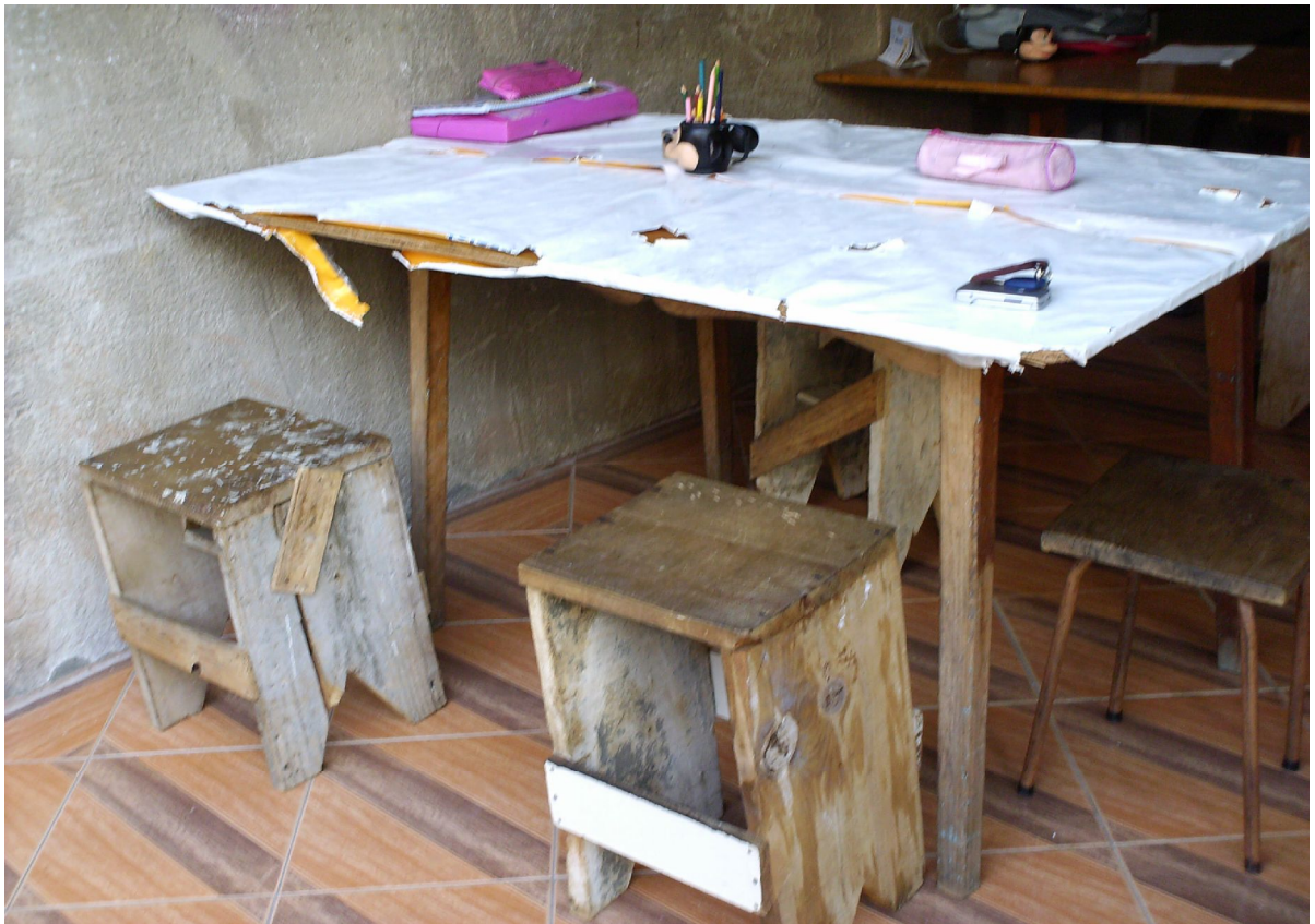
Foto 9: Mesa e bancos para o estudo dos alunos da explicadora. Rio de Janeiro, julho/2006

Entretanto, o critério de escolha do ambiente mais adequado para as explicações não está vinculado ao espaço mais público ou mais intimista da casa. Contudo, a varanda, para aqueles que a possuem, se constituiu no local mais indicado. Trata-se de uma tentativa de preservar o que resta de privacidade.