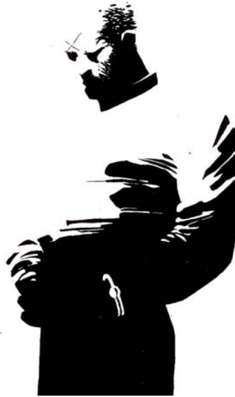
Ilustração 4 186

Um efeito que só funciona, é verdade, se abstraímos por um momento da tridimensionalidade do objeto representado. Nem isto é por acaso. Na experiência, a luz, como os conceitos do entendimento, revela sempre parcialmente. O que a imagem da determinação completa nos sugere é algo totalmente inacessível ao nosso modo de conhecer e representar, e que só nos esforçamos para dar algum esboço por um anseio sublime mas irresistível da razão.