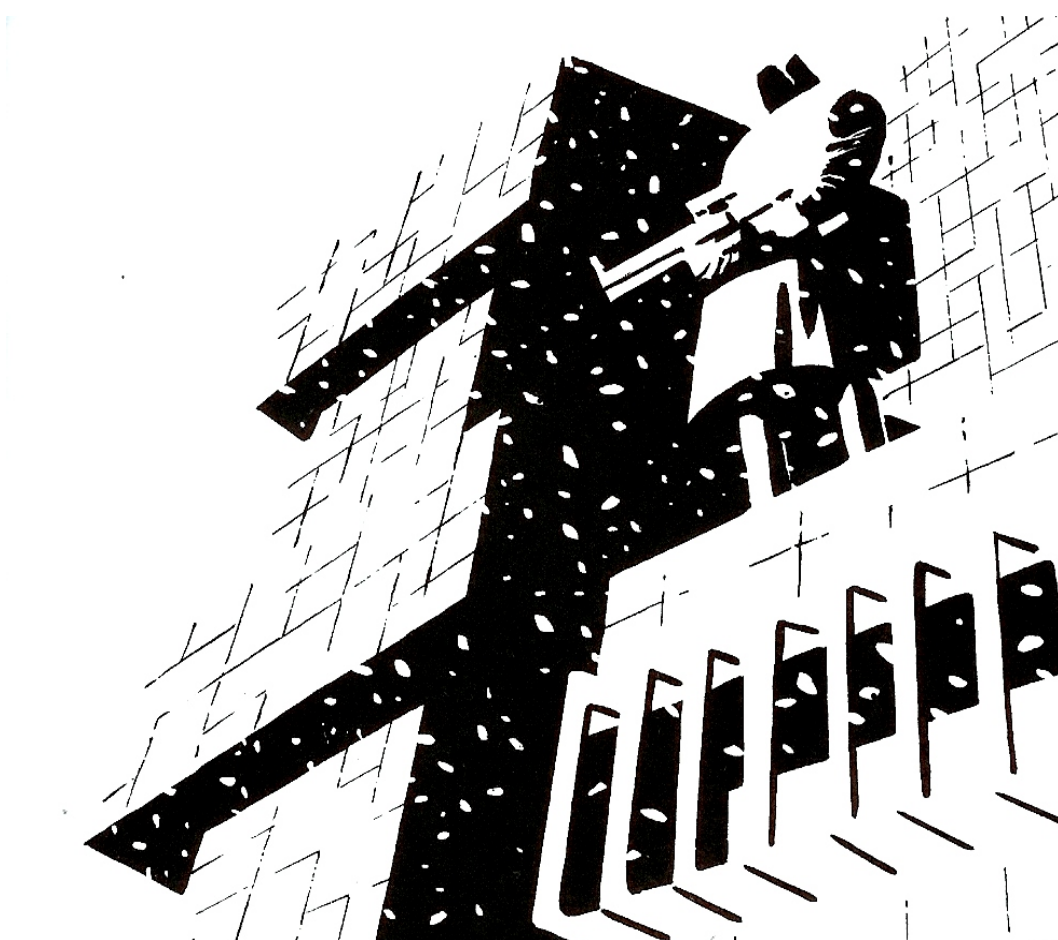
Ilustração 3 185

experiência, inobstante se nos apresente sempre por perfis incompletos e fugidios, seja em si mesma inteiramente determinada, pois deste modo podemos organizar todas as determinações parciais que obtemos como se estivéssemos produzindo um conceito individual da mesma, mas que em direção ao qual apenas nos aproximamos indefinidamente. A determinação completa desta coisa supõe que todo o material da determinação em geral esteja dado como uma só matéria homogênea e positiva, uma vez que toda a negação é representada, a priori, como derivada e contraposta a uma realidade. A realidade total é assim tomada como inteira positividade em geral e a realidade das coisas é pensada como derivada desta totalidade mediante um decréscimo de determinação expresso pelo predicado infinito. Neste caso, a imagem da luz sumo-abrangente é bastante adequada, pois neste modelo (ilustrações 3 e 4), as figuras são delineadas conforme escurecemos as áreas do plano de fundo que está inteiramente iluminado, como se emergissem todas de um mesmo material e fossem dadas em sua singularidade justamente no que lhes falta deste.