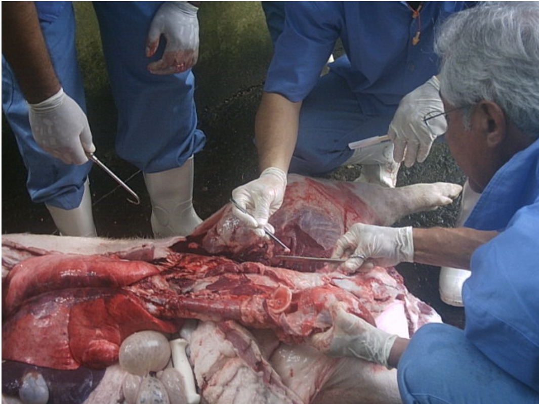
Figura 6 - Colheita de amostras de tecidos de suínos para Exame de PCR

laboratório para a realização do teste de RT-PCR para fins de averiguação dos 2 animais soropositivos para PRRS.