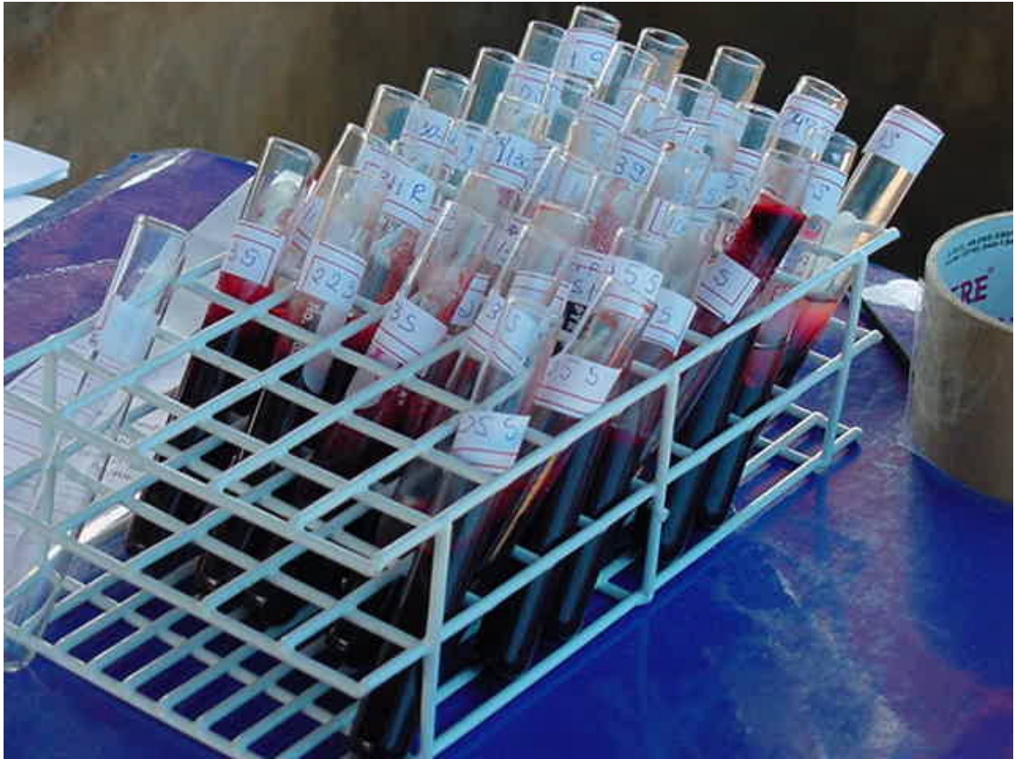
Figura 4 - Amostras de sangue de suínos colhidas em tubos de vidro de 9ml.

4.1.4 AMOSTRAS DE SÊMEN: Foram colhidas 53 amostras de sêmen durante os procedimentos de rotina de obtenção de sêmen, observando as normas de manejo da Central de Inseminação (Figura 5) segundo metodologia preconizada por CORRÊA et al.,(2001).