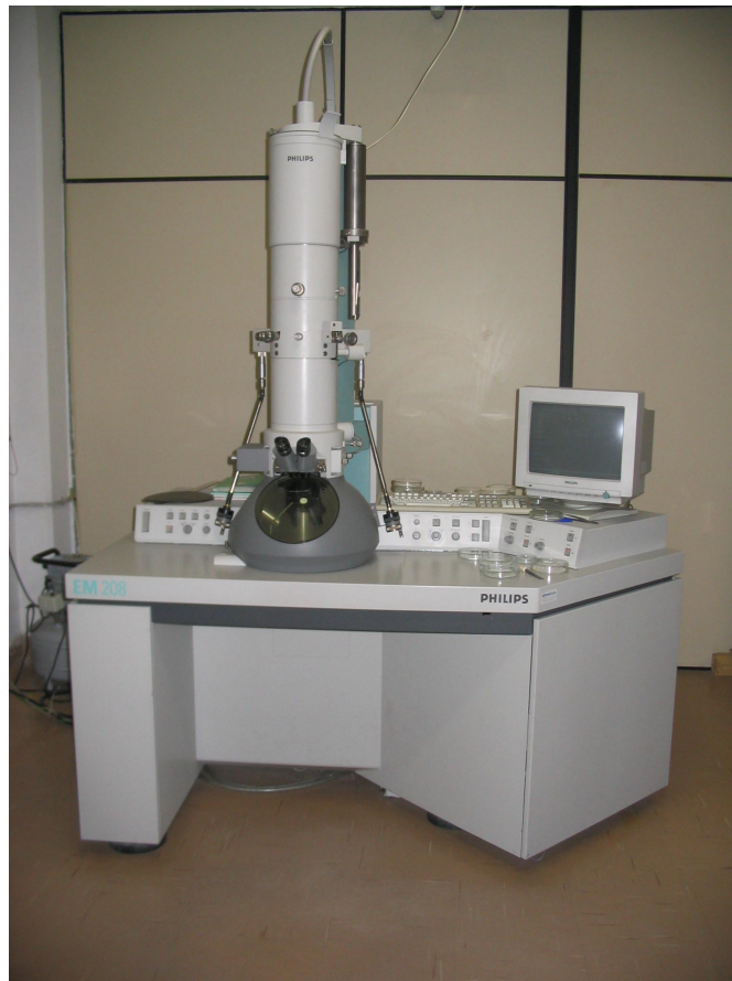
Figura 7 - Microscópio eletrônico Philips EM-208

4.2.4. DIAGNÓSTICO EPIDEMIOLÓGICO. Baseou-se na correção da prevalência e cálculo do Valor Preditivo de um Valor Positivo (VPRP) segundo THRUSFIELD, (1986) ; MARTIN et al (1987) Cálculo do VPRP Valor Preditivo de um Valor Positivo (THRUSFIELD, 1986)