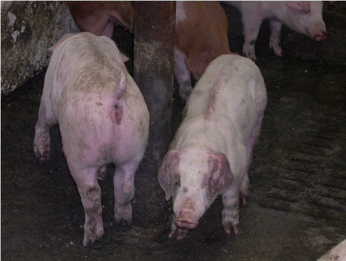
Figura 3 - Animais com sinais clínicos de PRRS