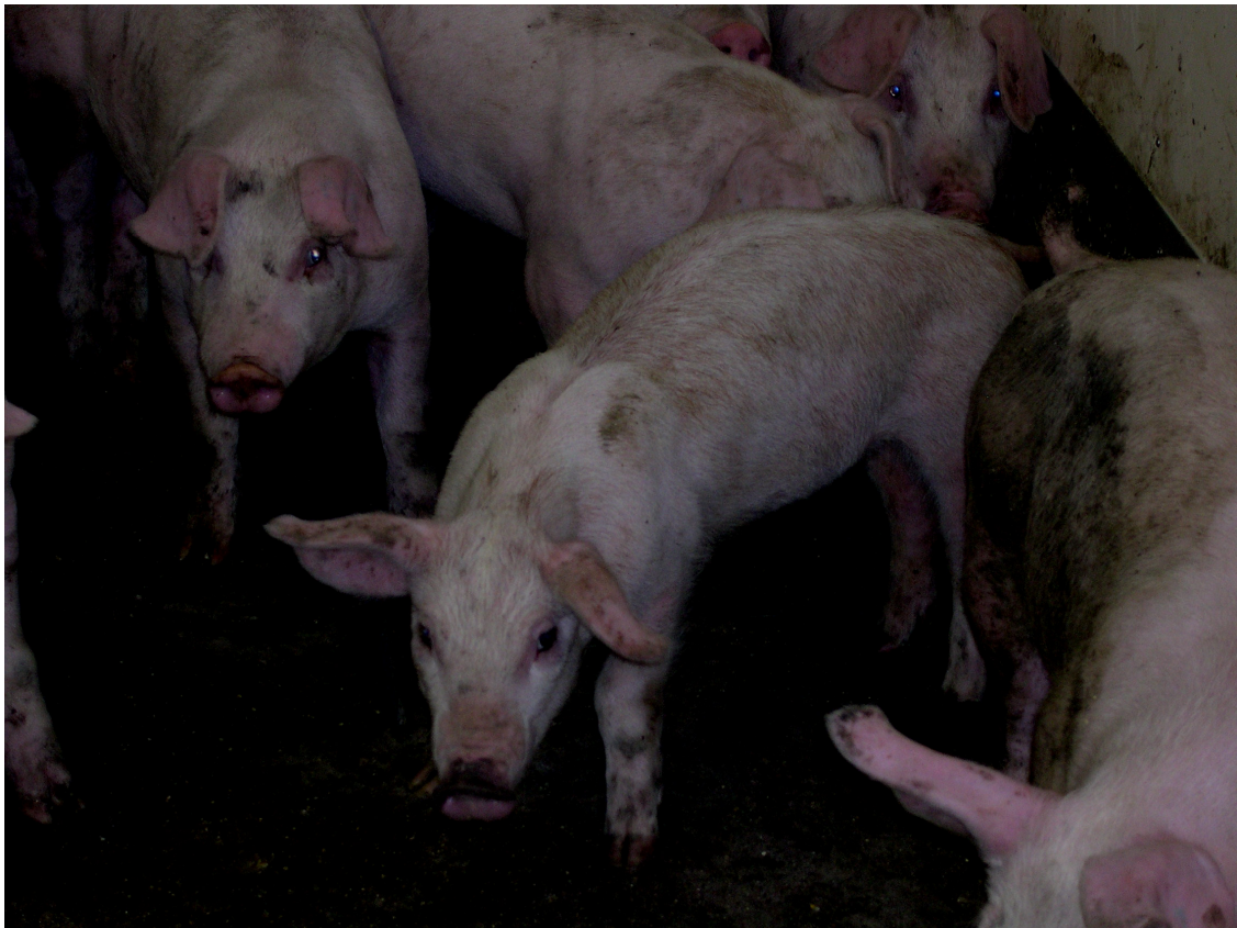
Figura 2 - Animais refugos são comuns numa granja com PRRS

Além da redução nas taxas de crescimento e aumento na mortalidade, a infecção pelo PRRSV reduz a eficácia de medicamentos e das vacinações (CIACCI-ZANELLA et al, 2004). ( Figura 2)