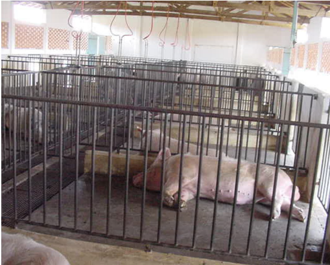
Figura 5 – Suínos de uma Central de Inseminação Artificial de Suínos, clinicamente normais.

4.1.5 AMOSTRAS DE TECIDOS: Foram colhidas amostras de tecido de amígdalas, pulmões e linfonodos mediastínicos dos animais positivos (2) submetidos ao teste de ELISA .As amostras (cerca de 100mg de tecido) foram congeladas em nitrogênio líquido e conservadas em gelo seco. Foram colhidas 3 fragmentos, em duplicata, de cada órgão dos 2 animais positivos á sorologia. Uma parte da amostra foi colocada em tubos contendo Trizol® (GibcoBRL) e a outra foi enviada ao laboratório congelada, embalada em sacos plásticos tipo ziploc e enviada em gelo seco. Quanto ao procedimento de colheita das amostras, foi utilizado um conjunto de luvas, pinças e tesouras para cada animal, objetivando prevenir contaminações cruzadas, pois, procurou-se realizar colheita asséptica de amostras. Foram colhidas amostras de sangue, aproximadamente 5 mL em frascos contendo anticoagulante ( EDTA) e conservado em gelo seco . Estas amostras foram imediatamente enviadas ao