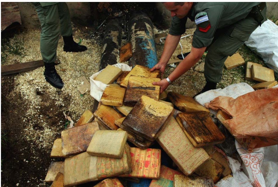
Pronto para queimar

Quando as quantidades de droga são grandes, como costuma acontecer mais ou menos desde 2001 -ano em que começaram a deter caminhões com 3 mil quilos de maconha prensada- a droga é mantida em resguardo nas unidades da Gendarmería que ainda tem espaço. Geralmente a maconha é transportada em pacotes de tamanhos e formas variáveis, a maioria retangulares, que oscilam entre dez por vinte centímetros cúbicos, a vinte por trinta.