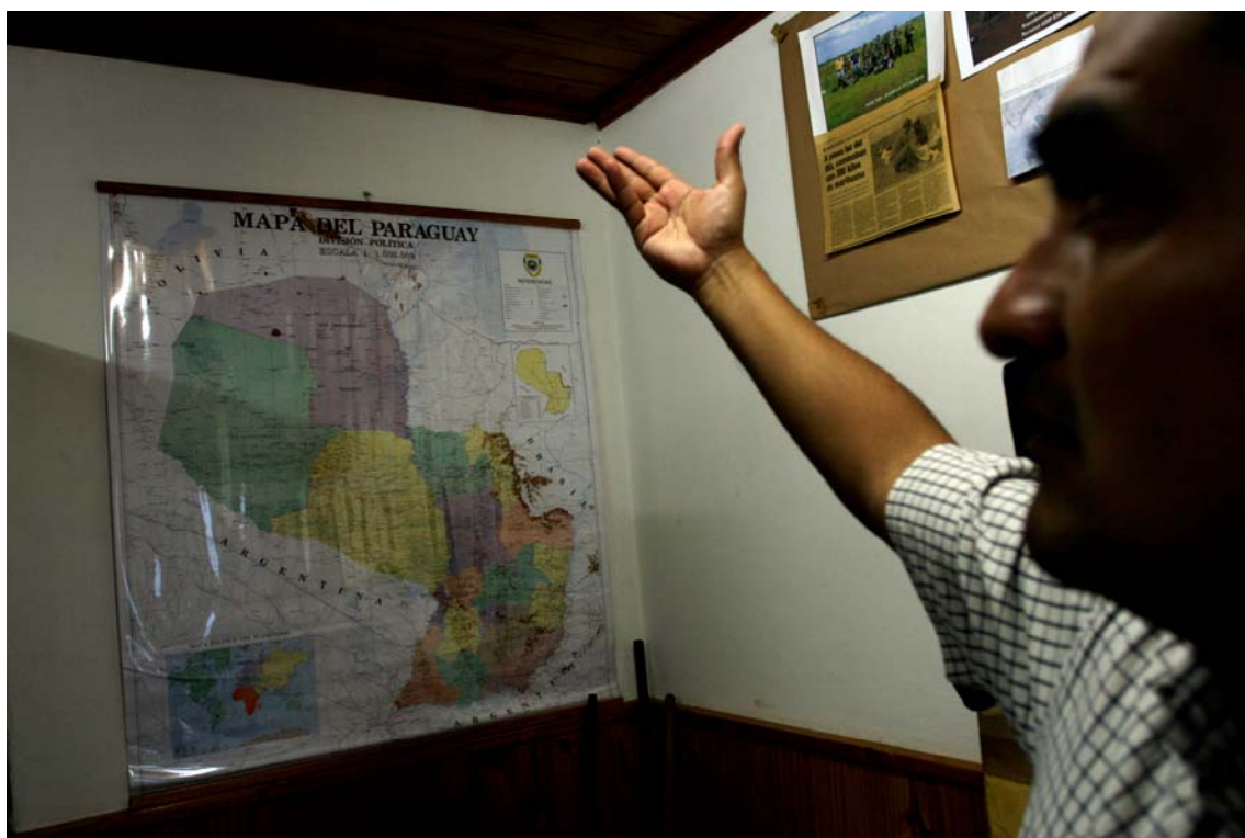
Para além das fronteiras

Da mesma forma que ocorre com quem realiza prevenção, conhecer o lugar é um dos requisitos fundamentais para que o trabalho dê bons resultados. Por isso a importância dos mapas na sala.