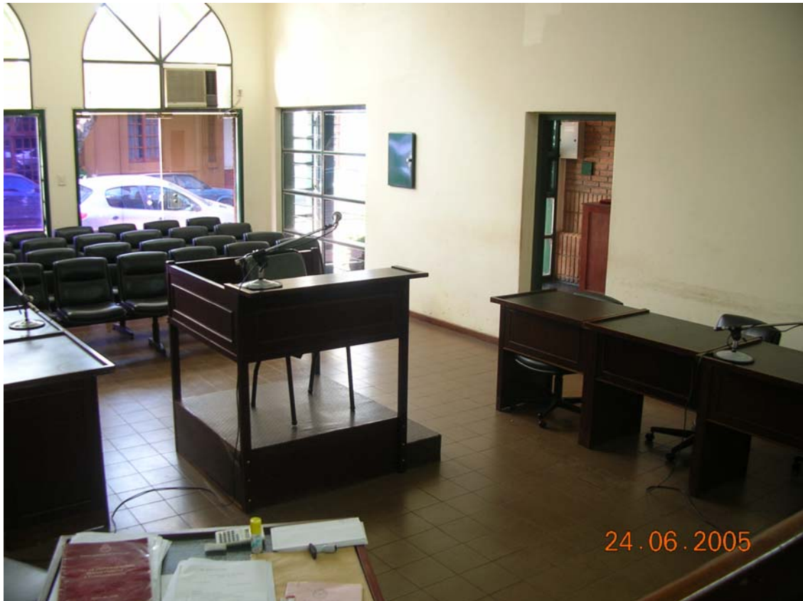
O que os juizes vêem