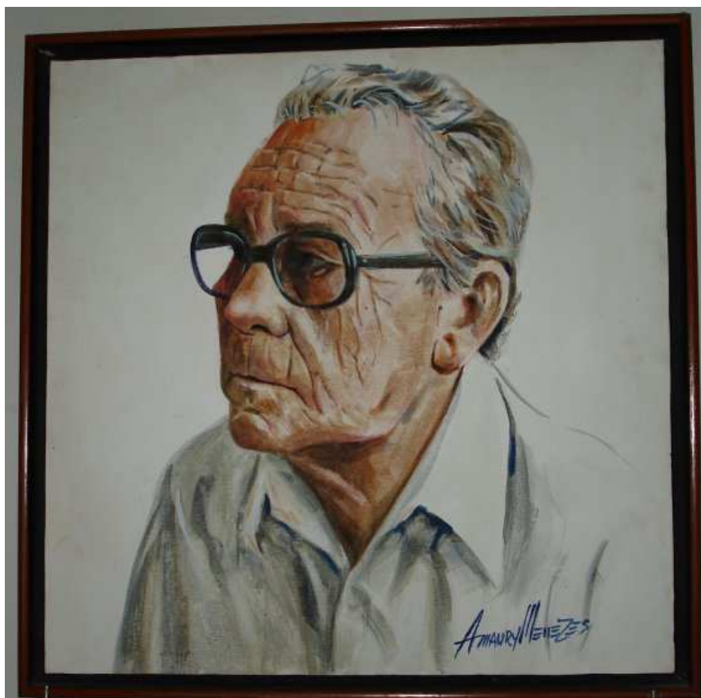
Foto 1 - Poster de Carmo Bernades, afixado na sala de visita de sua casa em Goiânia - GO.