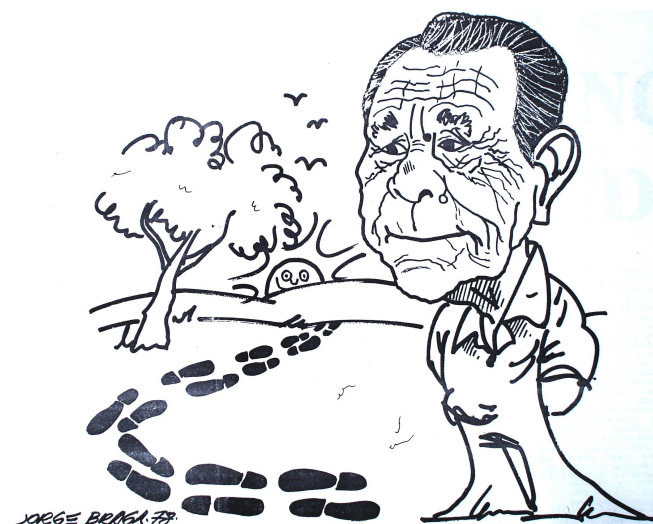
Foto 4 - Caricatura de Carmo Bernardes, feita por Jorge Braga, por ocasião do lançamento do livro de contos Idas e Vindas .

O tom quase raivoso e, ao mesmo tempo, profundamente político permite observar como Bernardes visualizava os seus escritos: espaço de atuação em defesa dos seus. Tema que se repete em outros livros de contos – “Idas e Vindas”, “Areia Branca” e “A Ressurreição de um Caçador de Gatos” –, nas crônicas, entrevistas e mesmo na produção que para Bernardes lhe é mais cara, seus romances. Isso, é possível dizer, leva ao extremo o compromisso de Carmo Bernardes com o que acredita ser um mundo mais brasileiro e mais autêntico que outros.