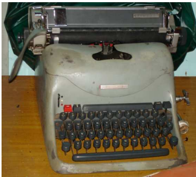
Foto 2 - Máquina de escrever de Carmo Bernardes, com a qual datilografava suas crônicas diárias, desde a década de 1960.

nova capital goiana; os dramas e desafios vividos, por uma população que, à semelhança do autor, era originária do campo e, que nesse período, perdiam as condições de permanecer nas roças migrando continuamente rumo às cidades; a dificuldades vividas diariamente pela emergência da ditadura militar. Muitas crônicas são ainda de “rememórias”, apresentando uma leitura de passado em relação ao que experimentava naquele período. Essas crônicas não têm títulos. São numeradas e separadas pelos anos de suas publicações. Ao todo, são mais de 120 crônicas divididas entre os dois livros 3 .