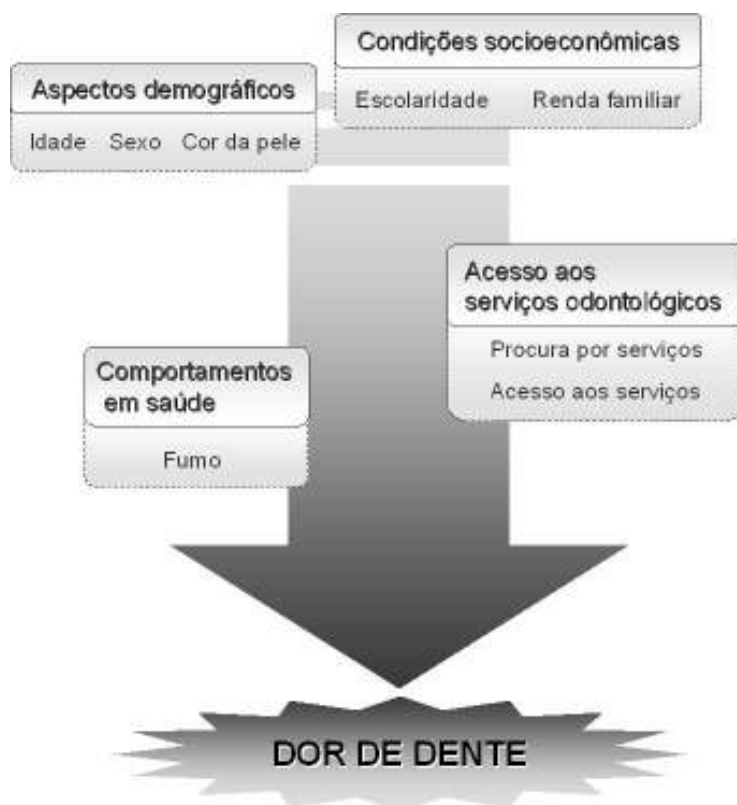
Figura 1. Modelo para determinação da dor de dente.