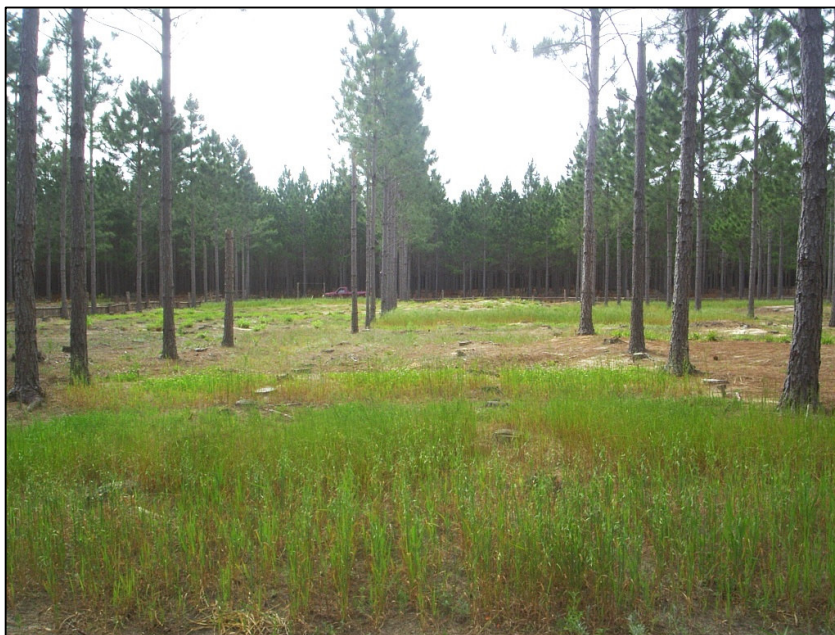
FIGURA 1 – Vista da área experimental sob sombra de Pinus elliottii Engelm. Em primeiro plano, parcelas de aveia-branca e aveia preta, na densidade de 555 árvores/ha (sombra moderada). Em segundo plano, a densidade de 333 árvores/ha (sombra fraca). 11 de outubro de 2006, Capivari do Sul, RS.

branca cv. FAPA 2, trevo-branco cv. Zapicán e cornichão cv. São Gabriel, estabelecidos segundo um fatorial 3 x 5, com três repetições, num total de 45 unidades experimentais.