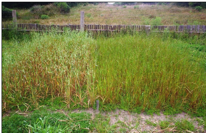
FIGURA 2 – Parcelas de aveia-branca e aveia-preta cultivadas fora do bosque (condição luminosa plena). 11 de outubro de 2006, Capivari do Sul, RS.