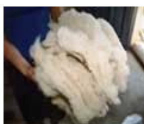
Lã cardada para ser fiada