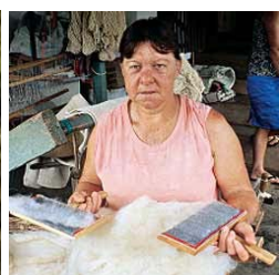
Lã sendo cardada