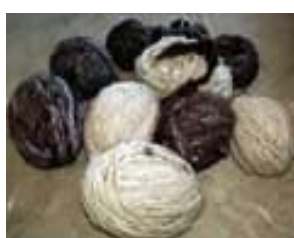
Novelos de lã após fiação