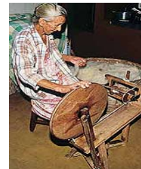
Roca de fiar