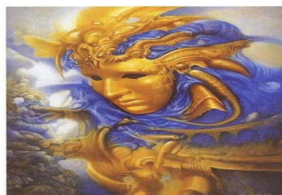
Tecido após a tecitura