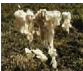
Lã em estado bruto

Pensamento falante como atravessamento de discursos como práticas que produzem determinados modos de ser e estar aluna e professora. Pensamento como sentidos que muitas vezes não conseguimos compreender. São experiências que acontecem e contribuem para que nos tornemos aquilo que estamos sendo. Entre as diversas passagens de fios tramados à urdidura esteve o da necessidade de conversar comigo mesma, no sentido de remontar lembranças dos tempos vividos na escola pública e as relações que se estabeleceram entre diferentes crianças. Estas lembranças referem-se às experiências escolares vividas que deram início ao processo de cardar e fiar em que, mesmo sem muita problematização, produziu os primeiros dos muitos fios a serem urdidados e tramados.