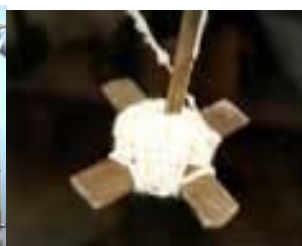
Navete com a lã para tramar