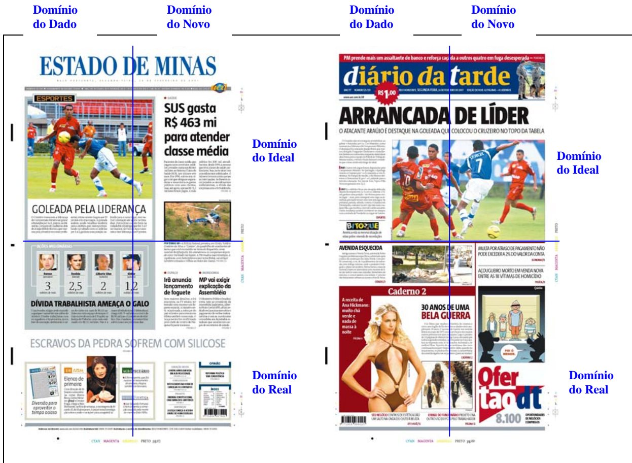
QUADRO 3 – Valor informacional na primeira página dos jornais Estado de Minas e Diário da Tarde .