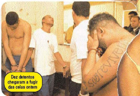
Dez detentos chegaram a fugir das celas ontem

Presos promovem fuga da Delegacia de Tóxicos