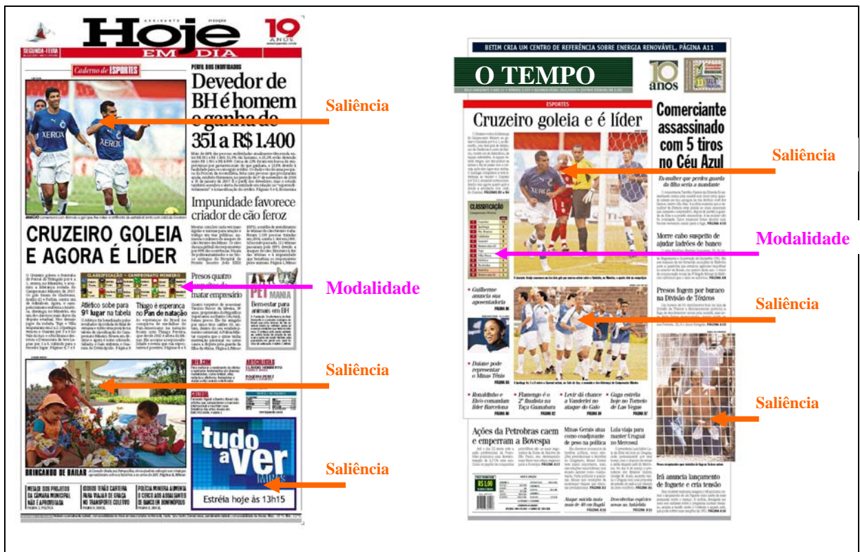
QUADRO 8 – Saliência na primeira página dos jornais Hoje em Dia e O Tempo .