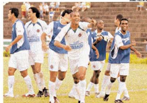
▶ Itabirato fez 3 a 0 sobre o Guarani ontem, no Vale do Açu, e assumiu a vice-liderança do Campeonato Mineiro

• Ronaldinho e Eto'o comandam líder Barcelona PÁGINA B6