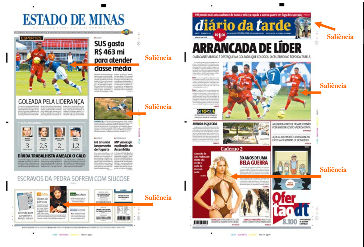
QUADRO 7 – Saliência na primeira página dos jornais Estado de Minas e Diário da Tarde .