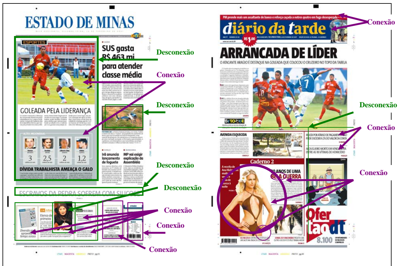
QUADRO 9 – Recursos de moldura na primeira página dos jornais Estado de Minas e Diário da Tarde .

Os QUADROS 9, 10 e 11 mostrados a seguir indicam os principais recursos de moldura utilizados entre os elementos dispostos em cada uma das páginas analisadas.