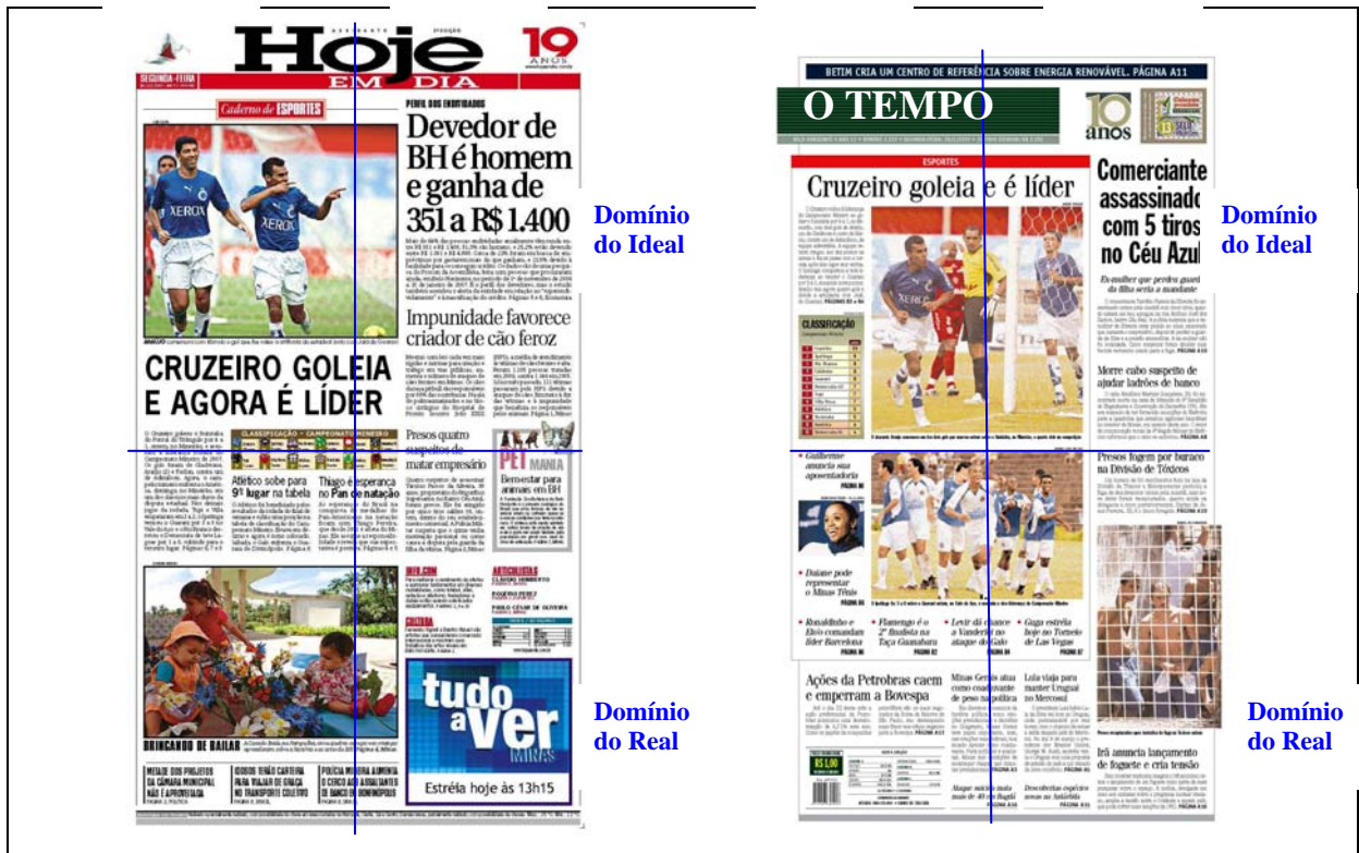
QUADRO 5 – Valor informacional na primeira página dos jornais Hoje em Dia e O Tempo .

A partir da observação dos quadros apresentados acima, é possível inferir que a representação de chamadas esportivas sobressaem na seção superior da primeira página de todos os jornais analisados. Entretanto, ressalta-se que, enquanto este tipo de chamada ocupa praticamente todo o domínio do Ideal da página dos jornais Diário da Tarde , Aqui e Super Notícia ; nos jornais Estado de Minas , Hoje em Dia e O Tempo tais chamadas também são dispostas em uma estrutura Dado-Novo, figurando em geral no domínio do Dado. No que concerne à seção inferior da página, domínio do Real, nota-se o predomínio da representação sensual de artistas famosas nos jornais Diário da Tarde , Aqui e Super Notícia , ao passo que nos demais jornais são apresentadas chamadas pertencentes a variadas seções. Vale salientar que, na primeira página do Super Notícia , Aqui , Diário da Tarde e O Tempo , verifica-se a ocorrência de chamadas junto ao espaço destinado ao cabeçalho do jornal, o que não ocorre nos jornais Estado de Minas e Hoje em Dia . Cumpre destacar a presença de propagandas na