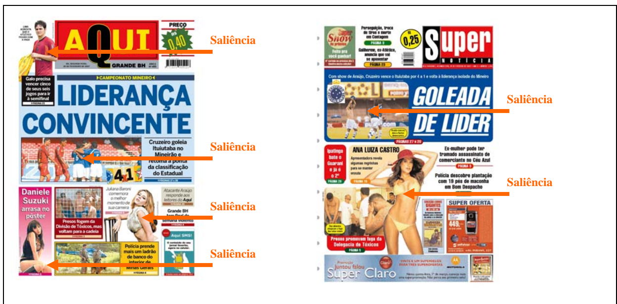
QUADRO 6 – Saliência na primeira página dos jornais Aqui e Super Notícia .

Os QUADROS 6, 7 e 8 mostrados abaixo apontam os elementos de maior grau de saliência nas páginas analisadas.