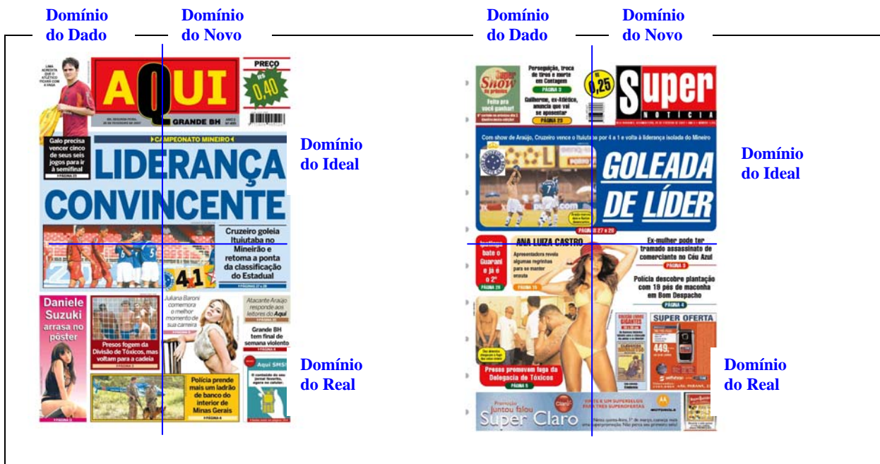
QUADRO 4 – Valor informacional na primeira página dos jornais Aqui e Super Notícia .