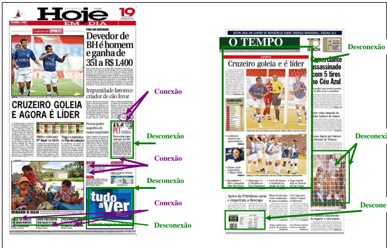
QUADRO 11 – Recursos de moldura na primeira página dos jornais Hoje em Dia e O Tempo .