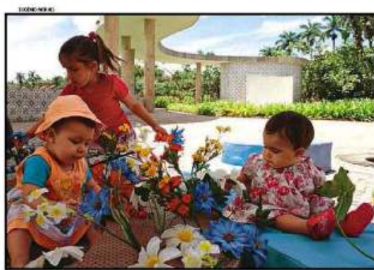
BRINCANDO DE BAILAR A Casado Baila, na Parquilha, ensina quebra-cabeças e depois ensina crianças a aprenderem sobre a história e as artes de BH. Página 4, Minas