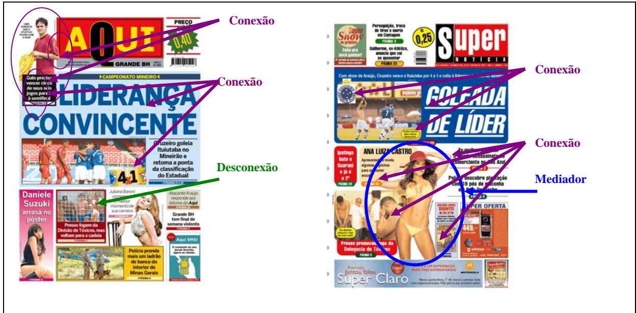
QUADRO 10 – Recursos de moldura na primeira página dos jornais Aqui e Super Notícia .