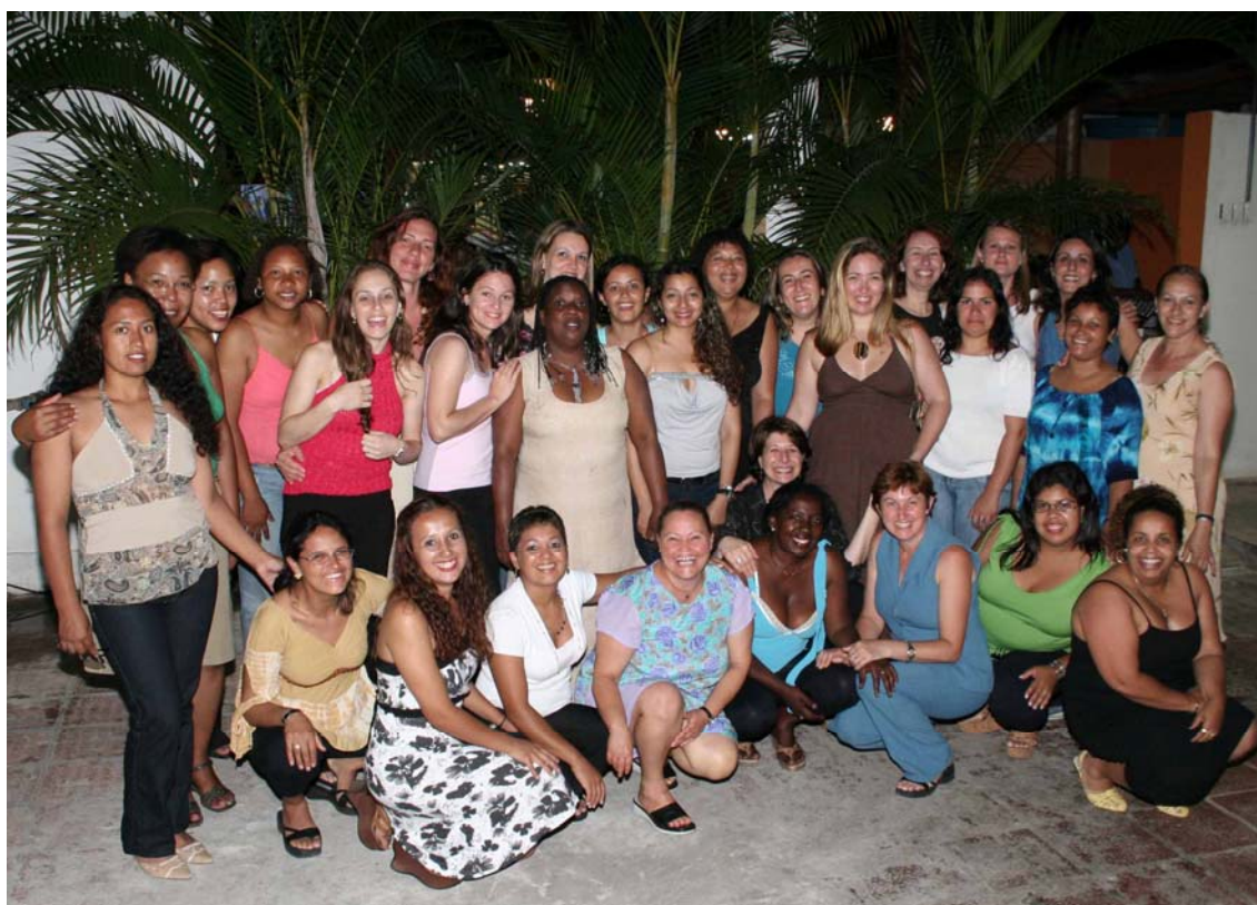
Homenagem especial às mulheres adultas universitárias, da turma do Curso de Pedagogia/Educação Infantil, da UERGS, Unidade Porto Alegre/RS.