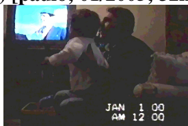
Fig. 5 – Excerto (13)

374 375 376 377 378 379 380 381 382 383→ 384 385