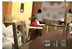
Fig. 4 – Excerto (6)