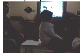
Fig. 6 – Excerto (14a)