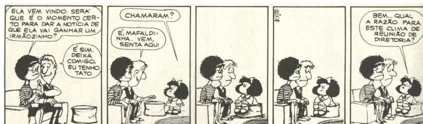
Fig. 1 – Mafalda e sua família QUINHO (2002, vol. 4, p. 50).